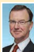
Президент ИСО Терри ХИЛЛ