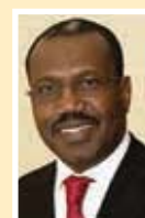
Генеральный секретарь МСЭ Хамадун ТУРЕ