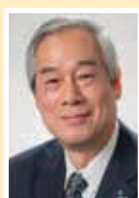
Президент МЭК Джунджи НОМУРА