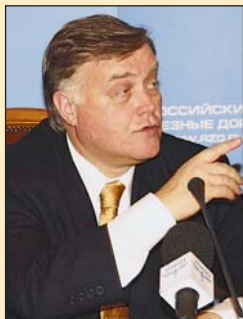
Владимир Иванович ЯКУНИН

30 июня 2008 г. одному из известнейших и влиятельнейших представителей современной российской бизнес-элиты, президенту ОАО «Российские железные дороги» Владимиру Ивановичу ЯКУНИНУ исполняется 60 лет.