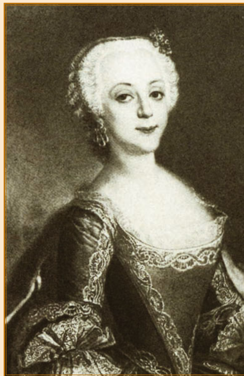
София Августа Фредерика фон Анхальт-Цербстская (Фике)