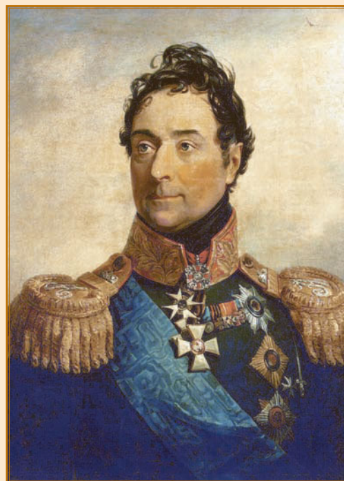
Дж. Доу. Портрет А. Ф. Ланжерона