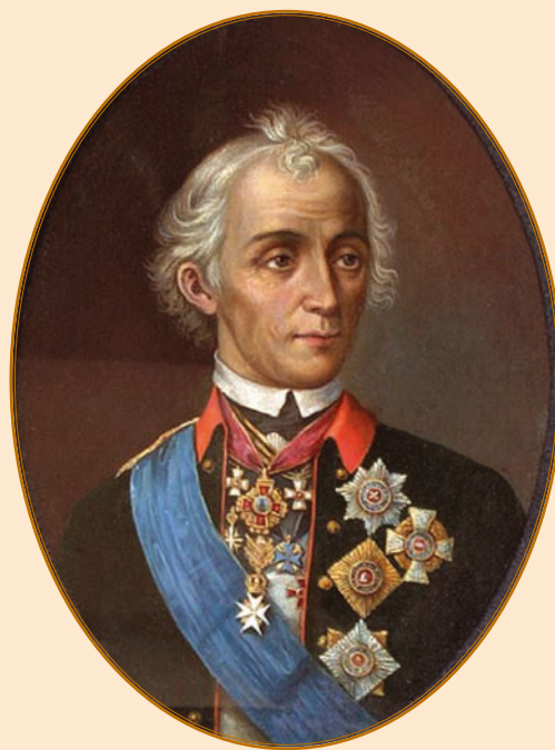
Портрет А. В. Суворова. XIX в.

Первый боевой опыт Михаил Кутузов получил в Польше, где с 1 марта 1764 по 1 марта 1765 г., а затем и в 1769 г. он участвовал в подавлении мятежа поляков. Когда в 1763 г. умер польский король Август III, король Пруссии Фридрих II и Екатерина II возвели на престол своего ставленника графа Понятовского. Это не устроило польских дворян, они подняли восстание, но оно вскоре было подавлено. Командование отметило, что капитан Кутузов отличился в боях с повстанцами, проявил талант командира и личную храбрость. Впрочем,