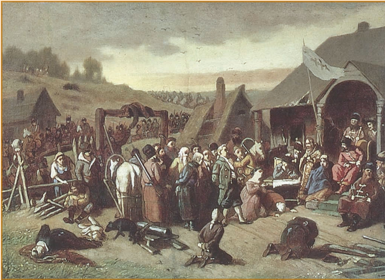
В. Г. Перов. Суд Пугачева. 1875.

чем летом 1774 года, никогда мятеж не свирепствовал с такой силой». Мятеж перекидывался от одной деревни к другой, от одной области к другой. Испуганная Екатерина отозвала с фронта самого А. В. Суворова, чтобы справиться с повстанцами, и спешно заключила мир с Турцией. Только в августе 1774 г. Пугачев был окончательно разбит и пленен. 10 января 1775 г. его казнили в Москве. А спор с Турцией за господство в Черном море был отложен.