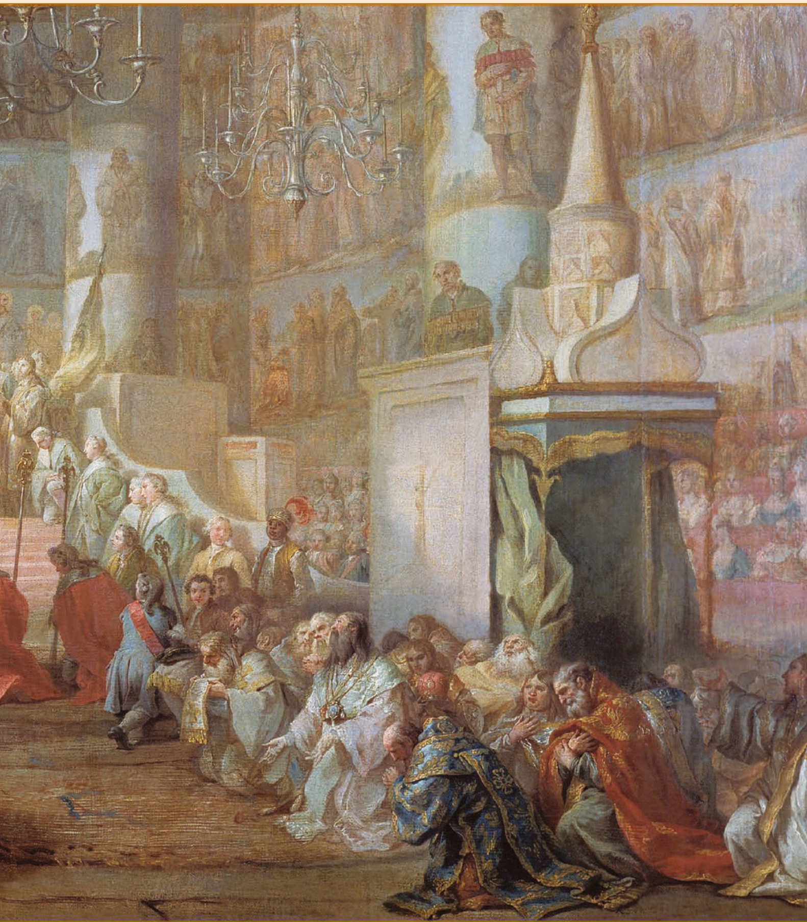
С. Торелли. Коронация императрицы Екатерины II Алексеевны