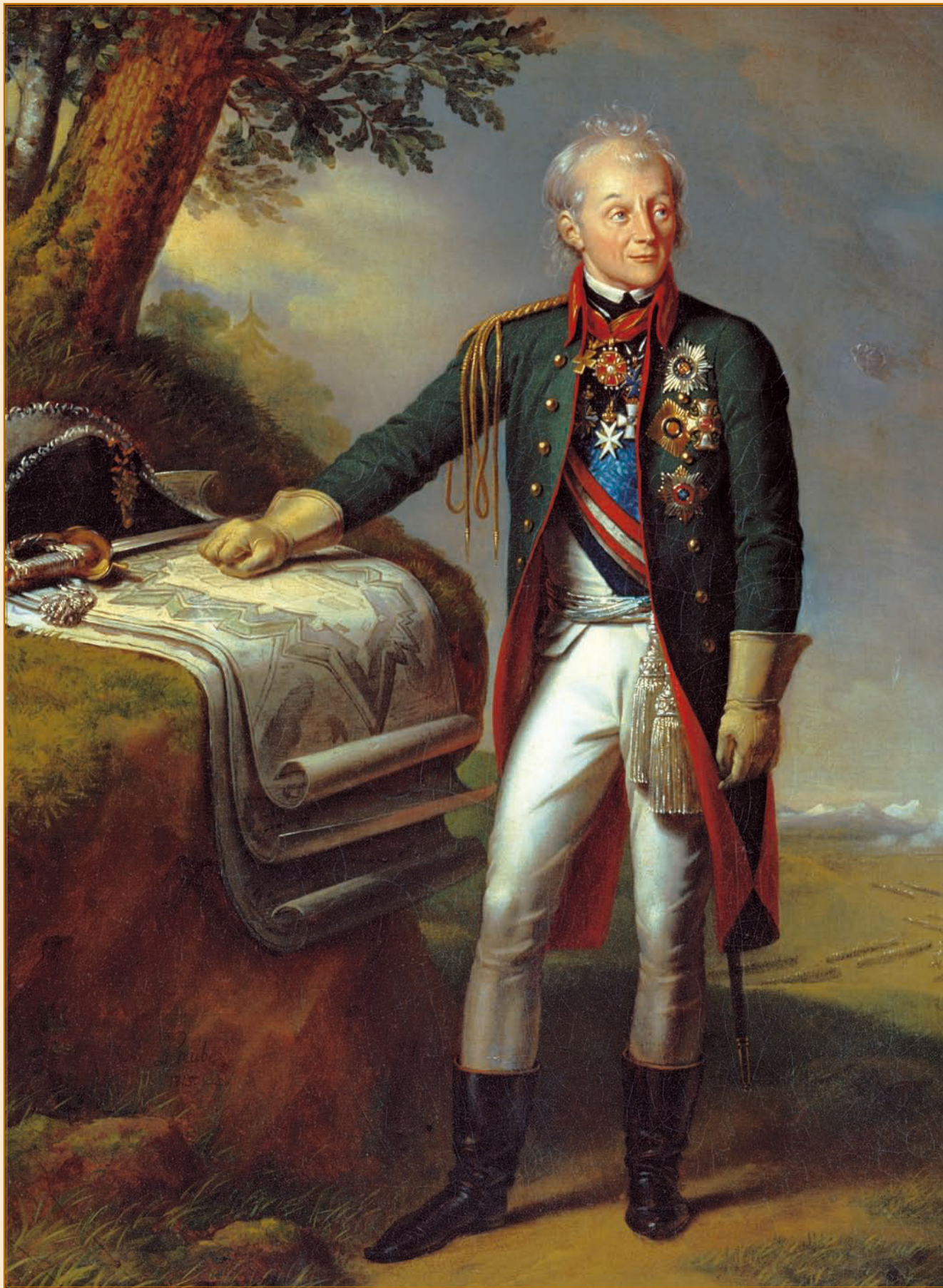
К. Штейбен. Граф Рымникский, князь Италийский генералиссимус А. В. Суворов