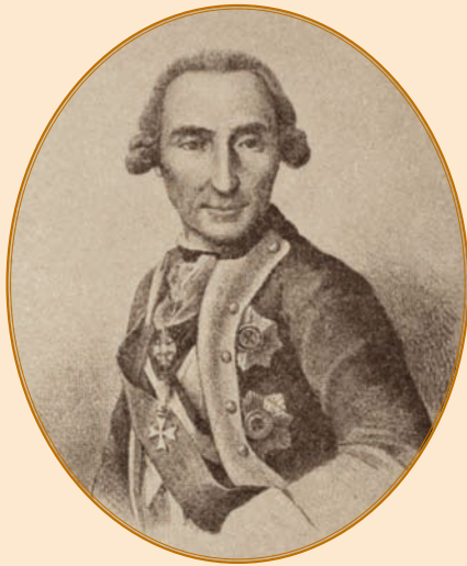
И. Л. Голенищев-Кутузов