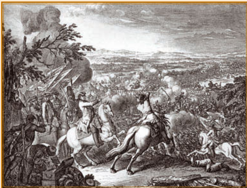
Победа над турками при Кагуле. 1770 г. Гравюра Д. Ходовецкого. 1793.

турок ничего не могла им противопоставить. 19 июля укрепленный лагерь турок был взят.