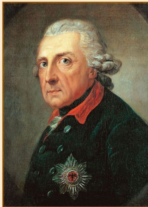
А. Граф. Портрет Фридриха II. 1781.

ливали традиции Петра Великого. Переиздавались и пересматривались воинские уставы, совершенствовалась военная подготовка. В Семилетней войне (1756–1762) русские войска неоднократно били лучшую в Европе армию Фридриха II, прусского короля, военного реформатора и знаменитого полководца. Участник этой войны А. Т. Болотов с гордостью писал: «... Победа сия одержана была... паче отменного храбростью наших войск». Можно сказать, что победу в этой войне у России «украл» Петр III. Преклоняясь перед Фридрихом II, он заявлял, что «прусская шляпа для него дороже русской короны». Петр III отказался от всех завоеваний России в Семилетней войне, заключил с Пруссией мир и стал переучивать русскую армию по прусским образцам. Сводилось это к слепому подражательству, переодеванию русских солдат и офицеров в прусские мундиры.