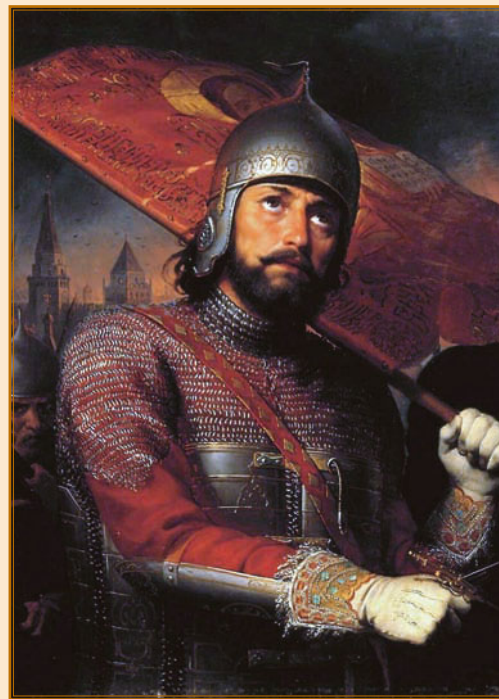
М. И. Скотти. Д. Пожарский. Фрагмент картины «Минин и Пожарский»

В истории порой встречаются столь причудливые совпадения, что стоит задуматься: не есть ли это тайный знак судьбы? Ведь род Беклемишевых дал России мать знаменитого князя Дмитрия Михайловича Пожарского. Таким образом, по материнской линии Кутузов, изгнавший из России полчища французов в 1812 г., прямой потомок князя Пожарского, освободившего в 1612 г. Москву от поляков!