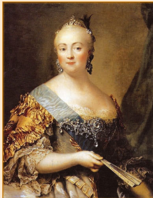
В. Эриксен. Портрет Елизаветы Петровны

Во второй половине XVIII в. русская армия переживала сложные времена. В правление Елизаветы Петровны (1714–1761) армия медленно, но неуклонно восстанавли-