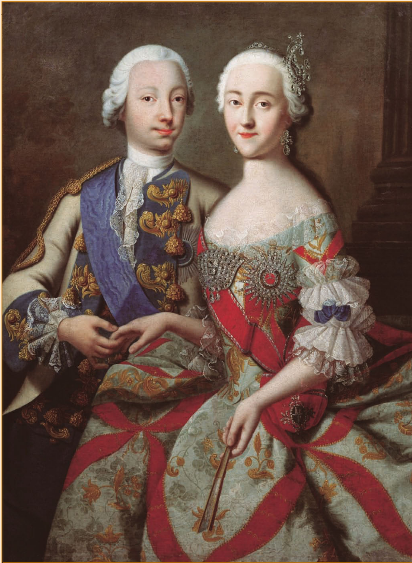
Г. Х. Гроот. Портрет цесаревича Петра Федоровича и великой княгини Екатерины