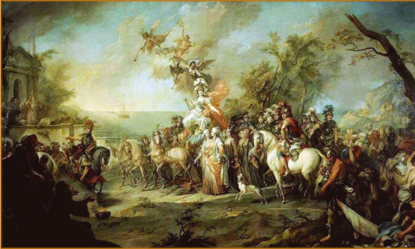
С. Торелли. Победа Екатерины над турками

Екатерина II отличалась удивительной интуицией в отношении людей талантливых, способных составить гордость и славу Отечества. О молодом офицере М. И. Кутузове она говорила: «Надобно беречь Кутузова, он будет у меня великим генералом», – и с тех пор называла его всегда «мой генерал Кутузов».