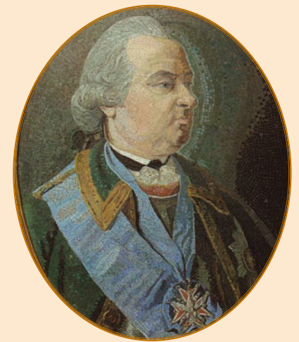
П. И. Шувалов. Мозаика М. В. Ломоносова

Отец будущего фельдмаршала второй раз не женился и воспитывал сына сам. В детстве М. И. Кутузова окружали люди замечательно интересные. Так, рос он в доме двоюродного брата отца – Ивана Логгиновича Голенищева-Кутузова, адмирала, наставника великого князя Павла Петровича (будущего императора Павла I), владельца богатейшей библиотеки. Сын адмирала Иван, друг юности Михаила Кутузова, стал впоследствии почетным академиком Российской Академии наук. Кутузов был очень привязан к дяде и в письмах часто называл его «батюшкой», стремясь этим подчеркнуть свою к нему любовь. Когда в 1800 г. Михаил Илларионович получил орден Андрея Первозванного, одну из высших наград империи, в письме к Ивану Логгиновичу он признался: «В ту самую минуту, когда государь возлагал на меня голубую ленту, думал я о Вас и живо видел, как Вас, батюшка, сие радует. Вот Вам лучшее доказательство моей привязанности и чувств моих к Вам».