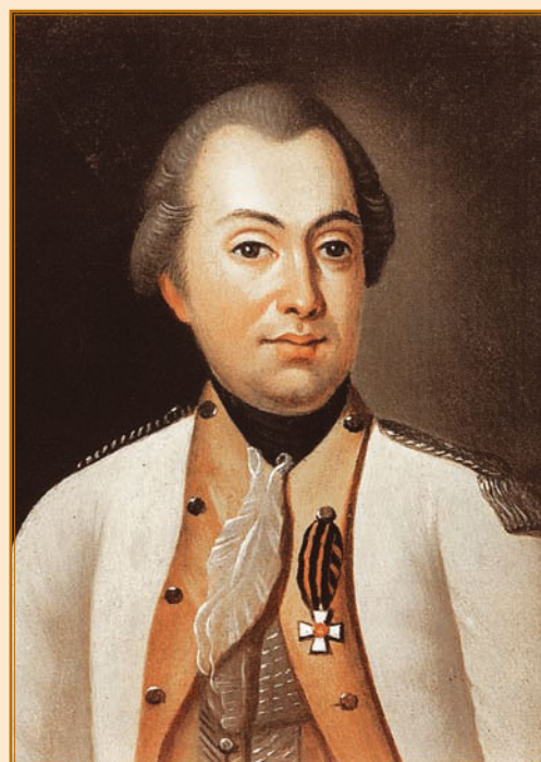
Неизв. худ. М. И. Кутузов. 1770-е.

Из устава русской армии времен Петра III