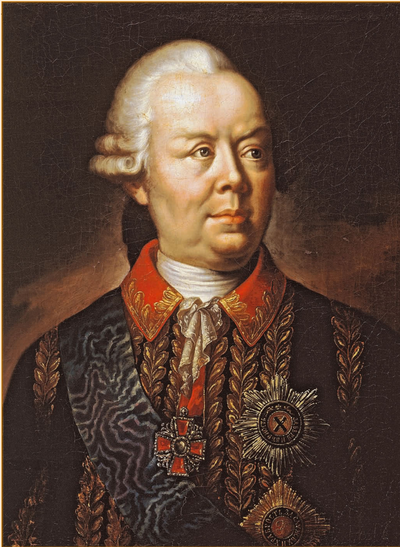
Неизв. худ. Граф П. А. Румянцев-Задунайский