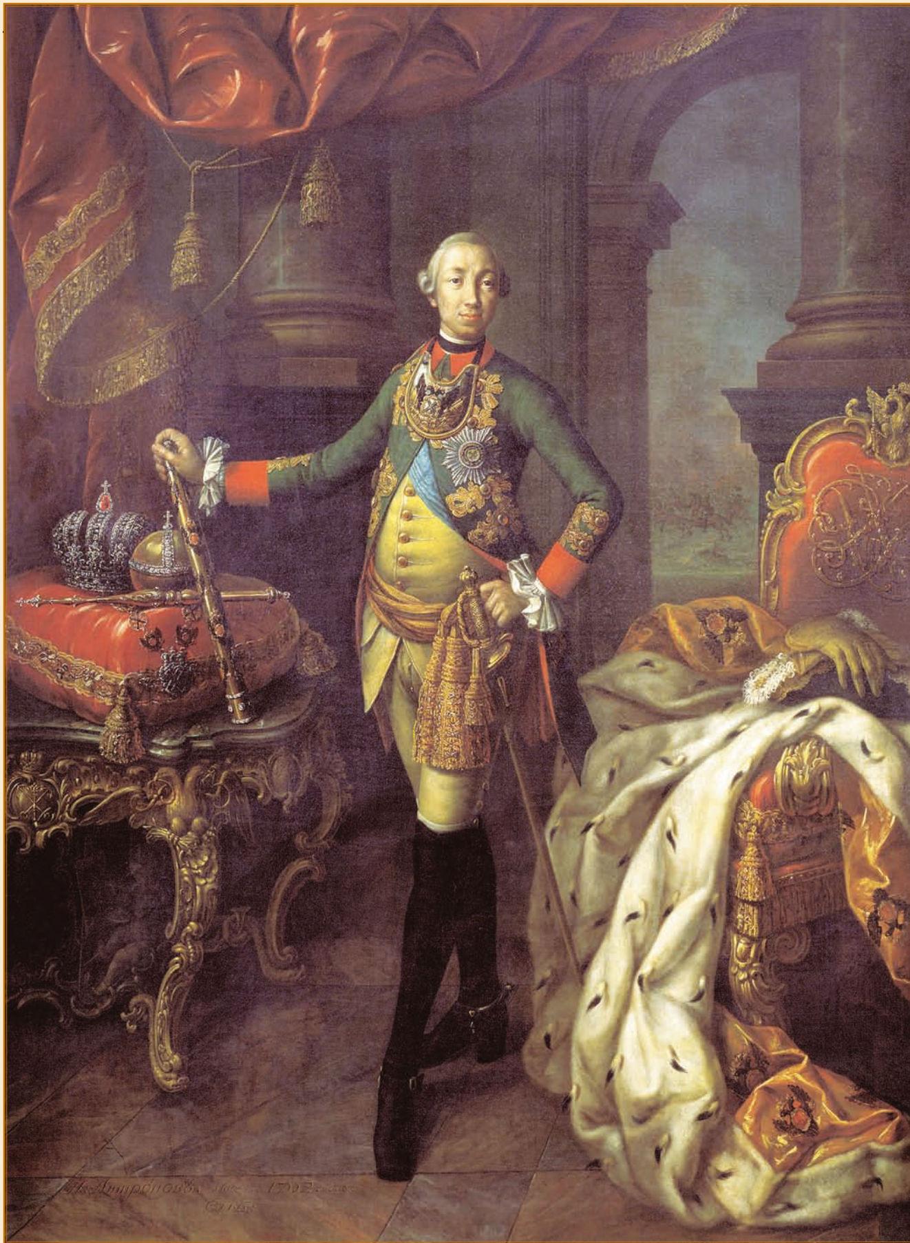
А. П. Антропов. Портрет Петра III. 1762.