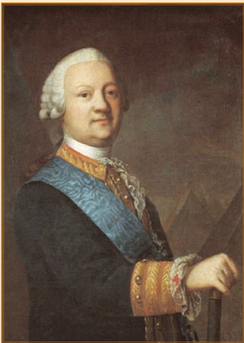
Портрет графа П. И. Панина. Не позднее 1767.

Кутузов блестяще проявил себя в этих сражениях. Как офицер генерального штаба, он сам вел разведку, дотошно изучал расположение войск неприятеля, составлял планы действий своего корпуса, был первым там, где назревала опасность. При Кагуле он вместе с подполковником графом Воронцовым преследовал неприятеля на «великое расстояние».