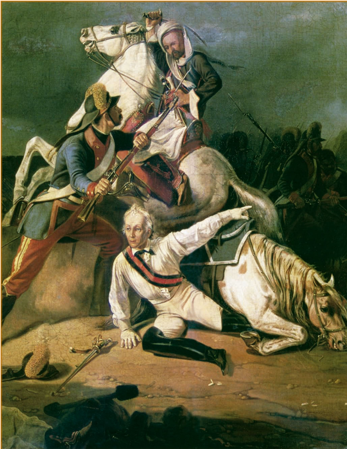
К. И. Кеппен. Спасение А. В. Суворова гренадером Степаном Новиковым в сражении при Кинбурне 1 октября 1787 г. Фрагмент