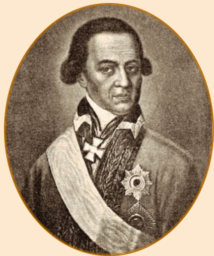
А. П. Ганнибал