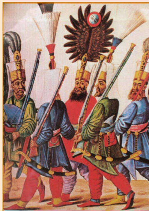
Султан Мурад с янычарами. Миниатюра

В сражении при реке Ларге турецкая армия имела двойной численный перевес. И вновь Румянцев не колеблясь решил атаковать противника: «Слава и достоинство наше не терпит, чтоб сносить присутствие неприятеля, стоящего на виду у нас, не наступая на него». Русский полководец построил свои войска в каре. Эти каре в виде четырехугольника численностью от батальона до дивизии были прекрасно готовы и к обороне, и к наступлению, поддерживались огнем артиллерии и представляли собой грозную силу. Огромная конница