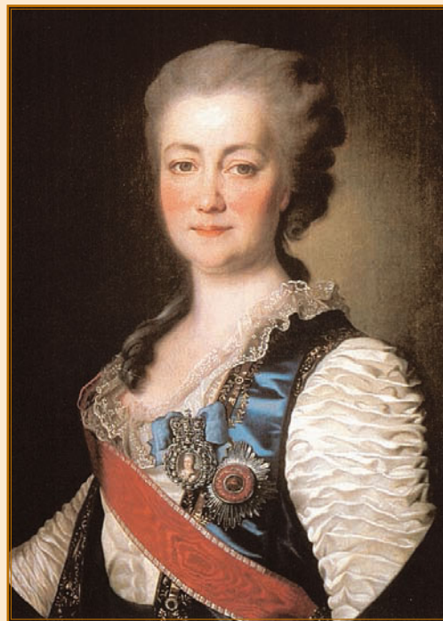
Д. Г. Левицкий. Княгиня Е. Р. Дашкова