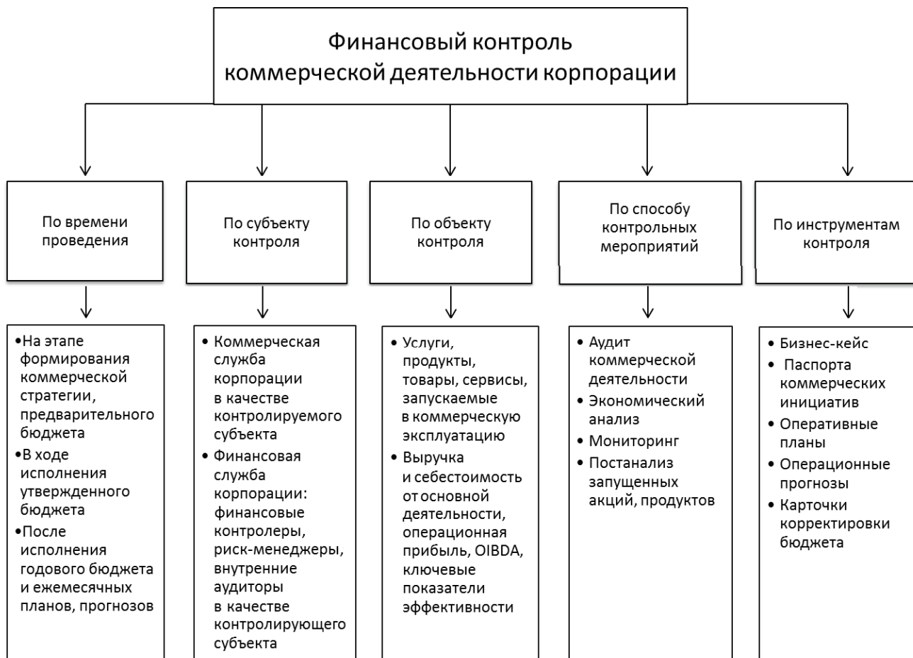
Рис. 1. Классификация финансового контроля коммерческой деятельности корпорации

К специфическим инструментам финансового контроля коммерческой деятельности корпорации