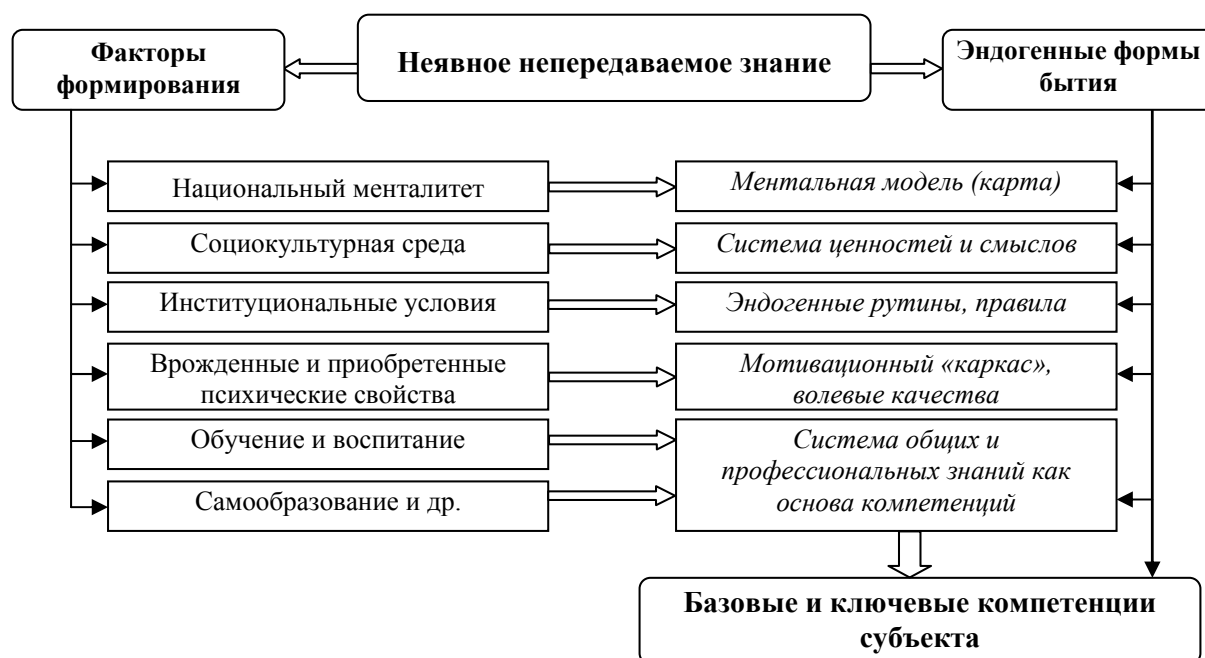
Рис. 1. Факторы формирования и элементы содержания неявного непередаваемого знания

Таким образом, доказательство гипотезы непосредственно увязывается с обоснованием как минимум двух предположений. Первое предположение связано с необходимостью формирования нового качества неявных знаний в системе социально-экономического генотипа . Термин «социально-экономический генотип» введен в научный оборот В.Л. Макаровым и Г.Б. Клейнером [18]. Второе предположение связано с императивом