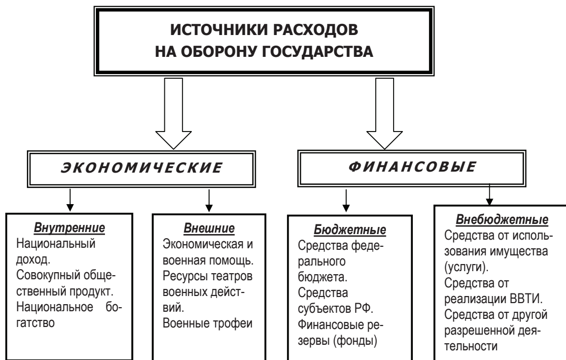
Рис. 2. Источники формирования оборонного бюджета

Современная война, скорее всего, может принять коалиционный характер, причем уже в мирное время страны – члены коалиций будут оказывать помощь более слабым и менее развитым партнерам. Эта помощь выступает как внешний ресурс для страны-получателя. Эти ресурсы могут быть представлены в виде займов, кредитов, конкретной экономической и военной помощи [2].