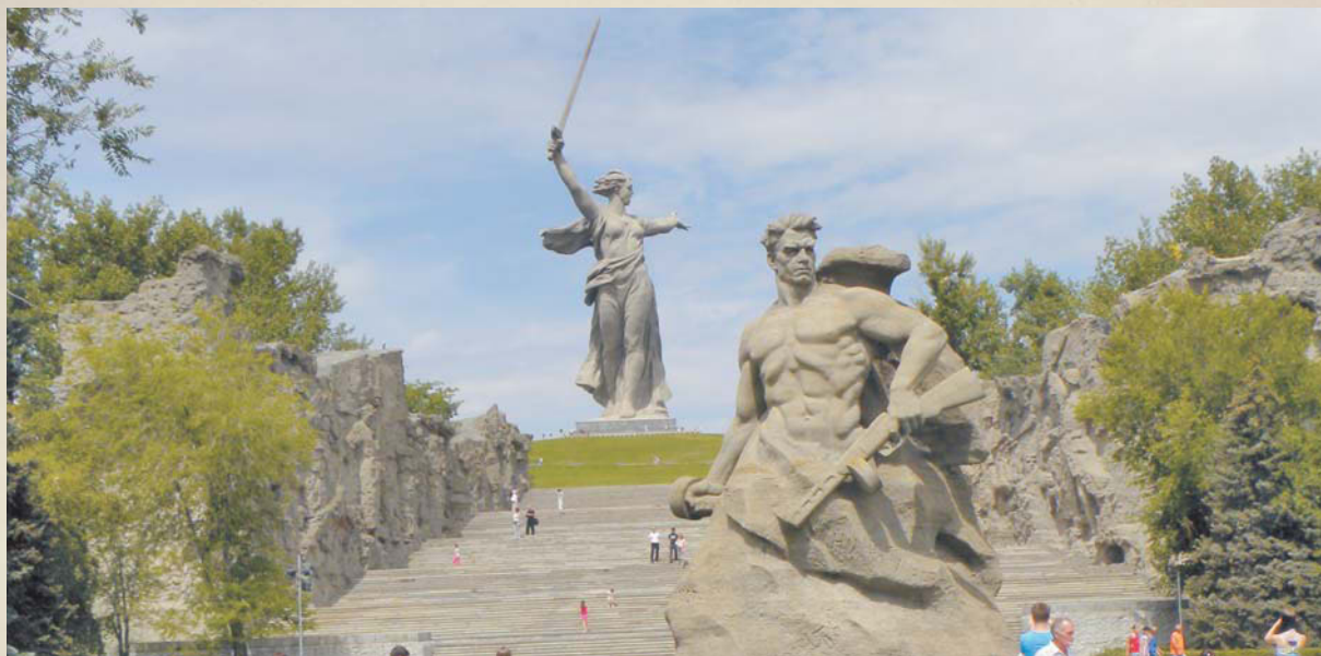
Мемориальный комплекс на Мамеевом кургане в Волгограде