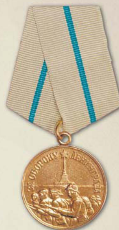
Медаль «За оборону Ленинграда»

шал Ф. Паулюс, один из авторов плана «Барбаросса», захвату Москвы «должно было предшествовать занятие Ленинграда. Овладением Ленинграда преследовалось несколько военных целей: ликвидация основных баз русского Балтийского флота, вывод из строя военной промышленности этого города и ликвидация Ленинграда как пункта сосредоточения для контрнаступления против немецких войск, наступавших на Москву».