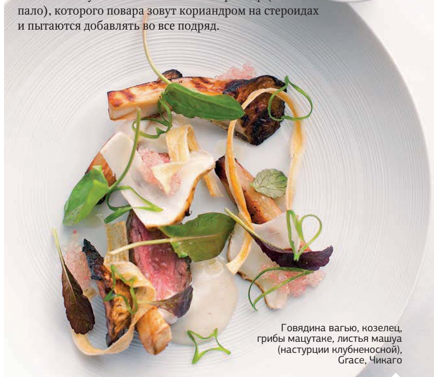
Говядина вагью, козлец, грибы мацутакэ, листья машуа (настурции клубненоносной), Grace, Чикаго