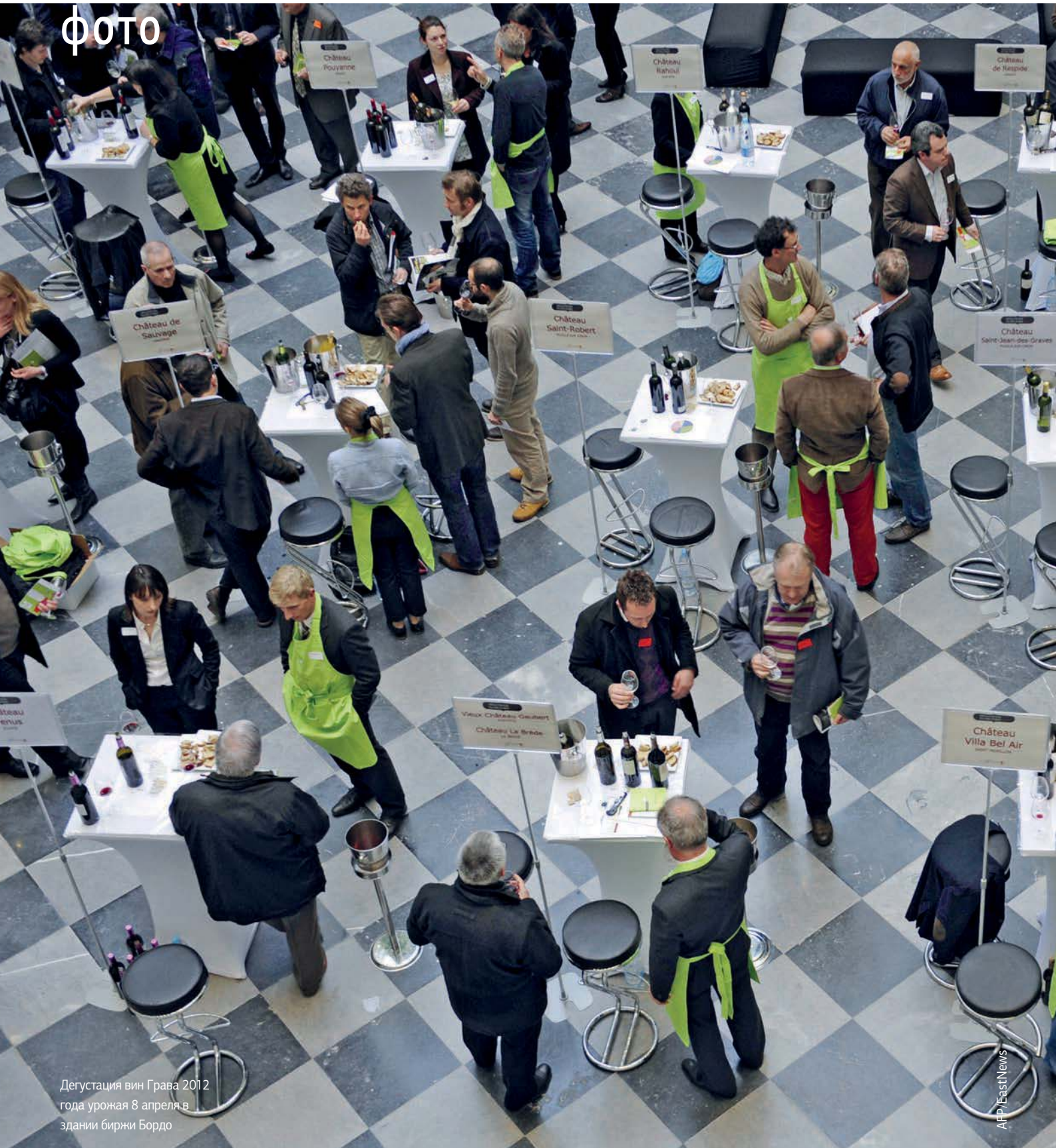
Дегустация вин Грвава 2012 года урожая 8 апреля в здании биржи Бордо