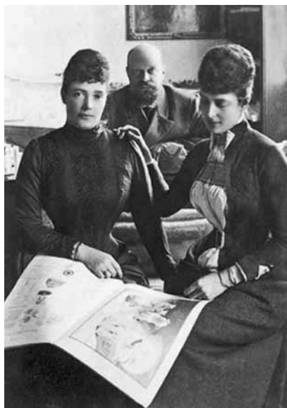
Императрица Мария Федоровна, Александр III, Александра Датская. Фреденсборг, Дания, 1880-е гг.