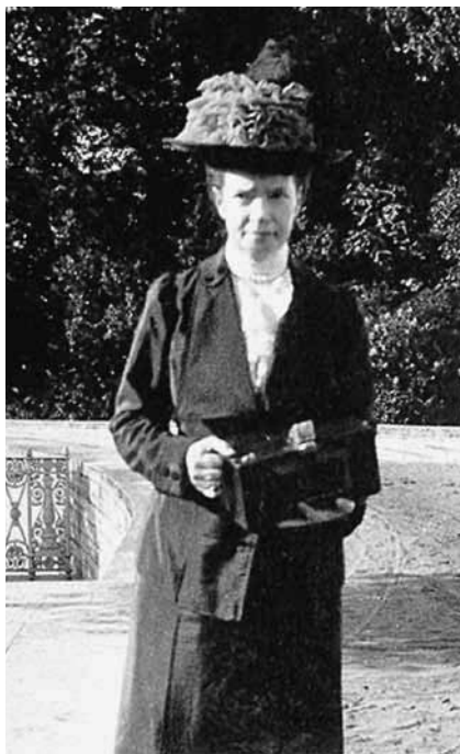
Императрица Мария Федоровна