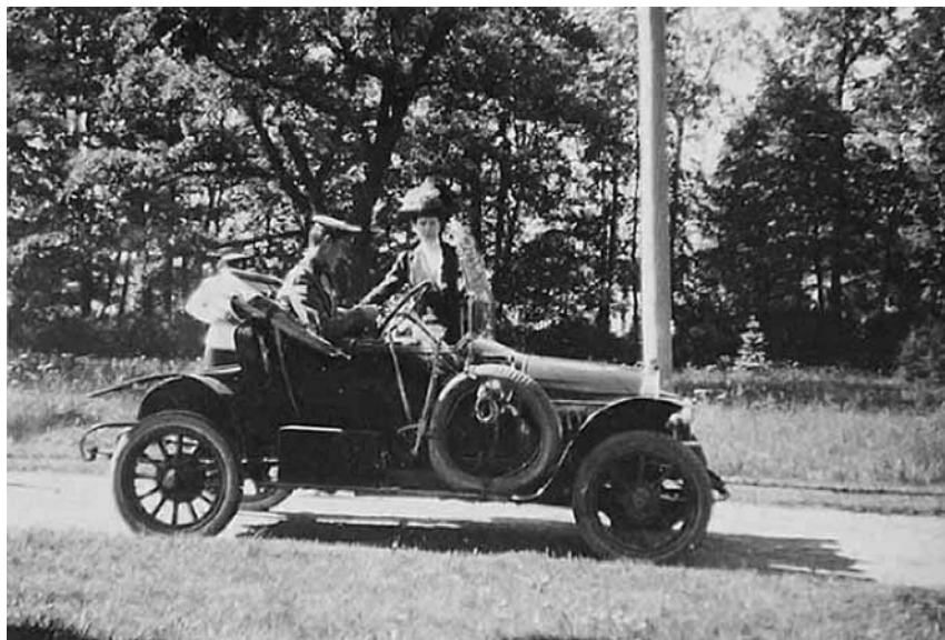
Императрица Мария Федоровна и ее внук кн. Андрей Александрович.