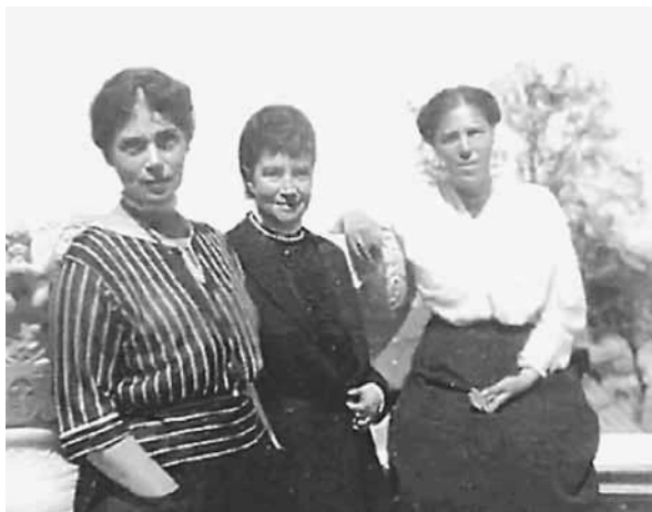
Великая княгиня Ксения Александровна, императрица Мария Федоровна, великая княгиня Ольга Александровна. Видоре, 1920-е гг.