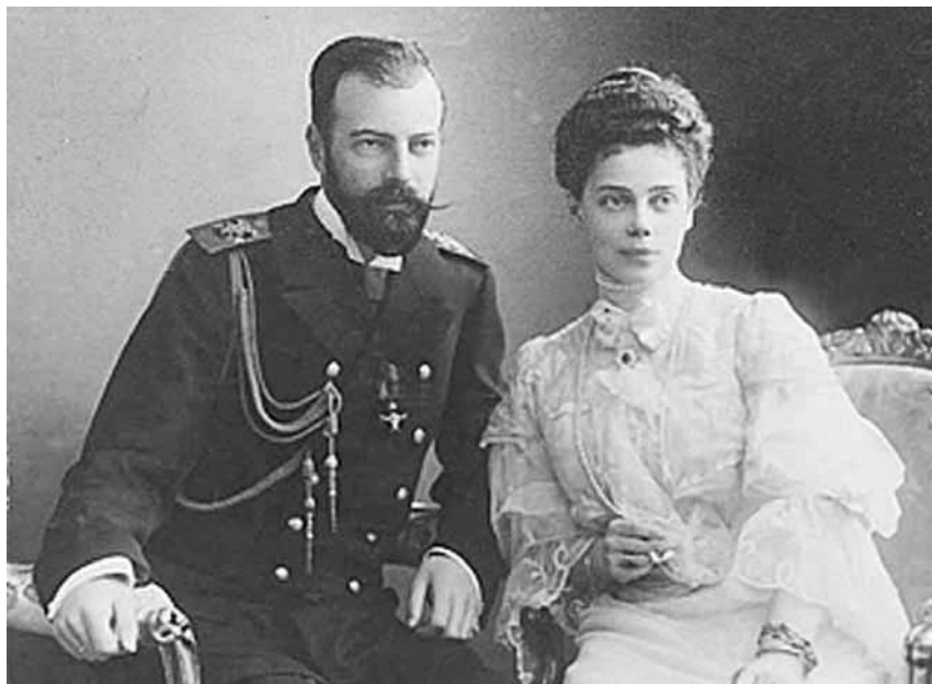
В. кн. Александр Михайлович и в. кн. Ксения Александровна.