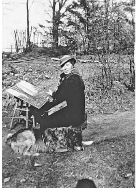
В. кн. Ольга Александровна в Кнудс-Минде, 1940-е гг.