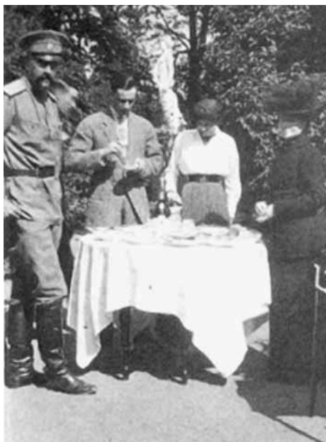
В. кн. Александр Михайлович, Феликс Феликсович и Ирина Александровна Юсуповы, императрица Мария Федоровна. Крым, Дюльбер, 1918 г.