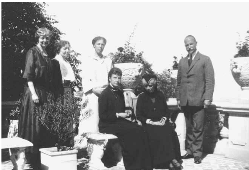
В. кн. Ольга Александровна, императрица Мария Федоровна, герцогиня Тира Датская. Видоре, 1920-е гг.