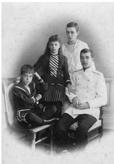
В. кн. Михаил, в. кн. Ксения, в. кн. Георгий и цесаревич Николай. Гатчина, 1880-е гг.