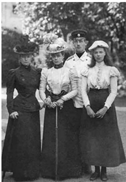
Императрица Мария Федоровна с детьми: в. кн. Ксенией, в. кн. Михаилом, в. кн. Ольгой. 1896 г.