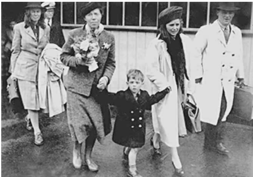
Переезд в. кн. Ольги Александровны в Канаду с семьей. 1948 г.