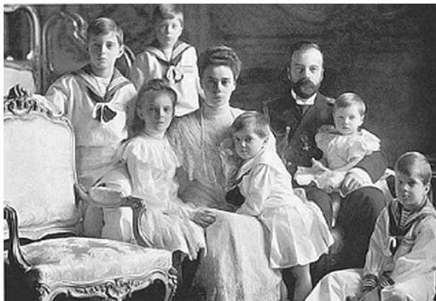
В. кн. Александр Михайлович и в. кн. Ксения Александровна с детьми.