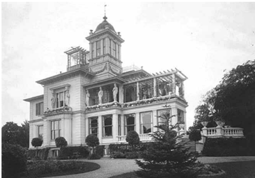
Вилла Видоре, где жила императрица Мария Федоровна в 1920-е гг.