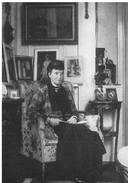
Императрица Мария Федоровна после эвакуации из Крыма. Видоре, 1924 г.