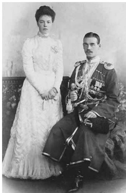
В. кн. Ольга Александровна с братом в. кн. Михаилом Александровичем. 1910 г.