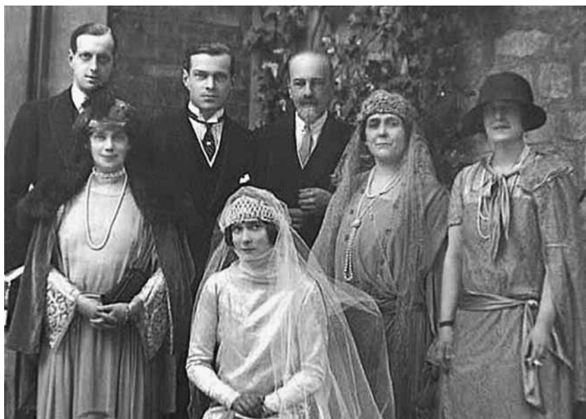
Свадьба кн. Федора Александровича и Ирины Павловны Палей. 1923 г.