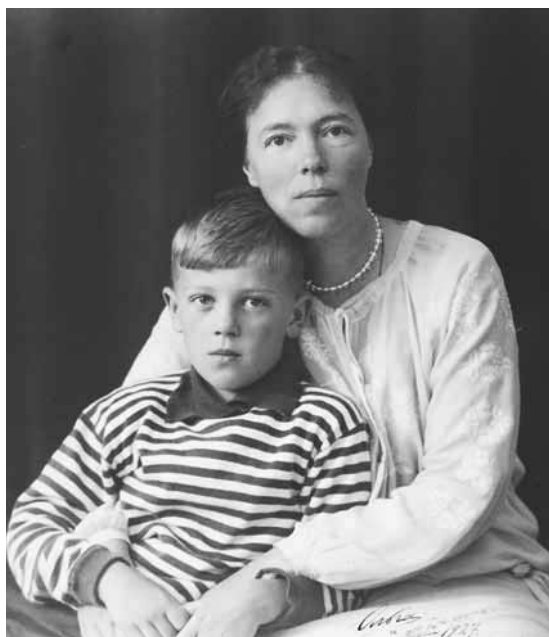
В. кн. Ольга Александровна с сыном Гурием. Видоре, 1927 г.