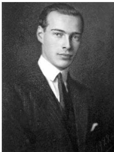
Кн. Ростислав Александрович 1920-е гг.