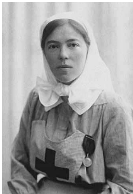
В. кн. Ольга Александровна, удостоенная Георгиевской медали как медсестра Красного Креста. 1915 г.