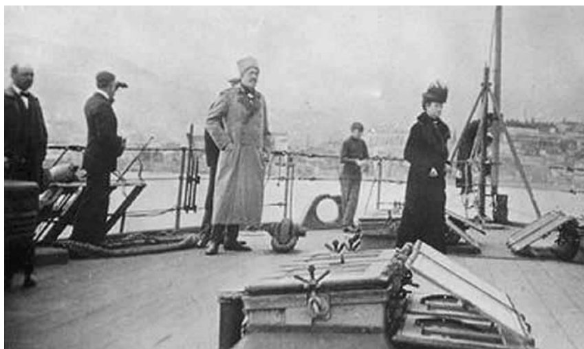
Императрица Мария Федоровна и в. кн. Николай Николаевич на борту крейсера «Мальборо» в день отплытия из Крыма. 1919 г.