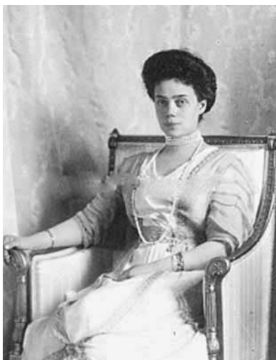
Великие княгини Ольга и Ксения Александровны