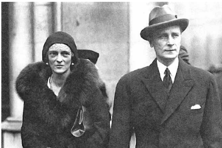
Ирина Александровна и Феликс Феликсович Юсуповы, выигравшие судебный процесс с кинокомпанией «МГМ». 1934 г.