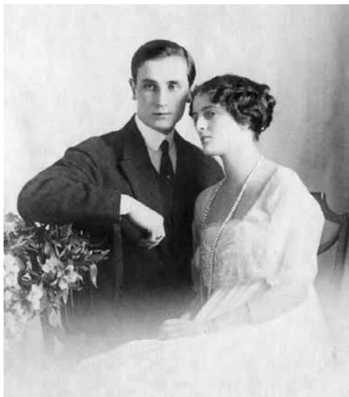
Феликс Феликсович Юсупов и кн. императорской крови Ирина Александровна.