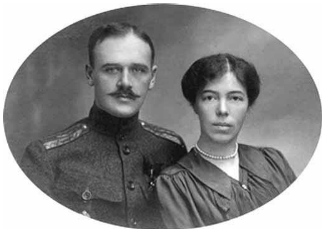
Полковник Николай Александрович Куликовский и в. кн. Ольга Александровна.