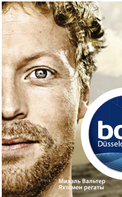
Михаэль Вальтер Яхтсмен регаты