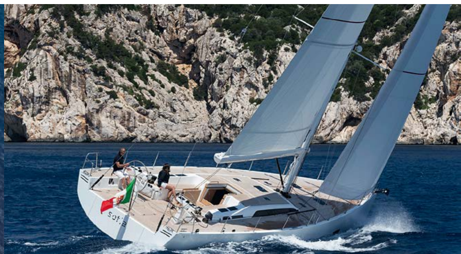
Solaris One 58

Длина 18,53 м, ширина 4,99 м, осадка 2,60 м, водоизмещение 21,7 т, запас топлива 480 л, запас воды 720 л, площадь парусов 188,2 кв. м.