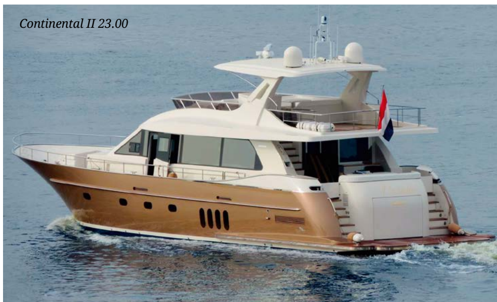
Continental II 23.00

На данный момент неизвестно, будет ли возможность провести полноценный тест-драйв во время выставки в Каннах. Обе яхты заслуживают внимания, и особенно интересно посмотреть на слаженную работу трех двигателей IPS, систем стабилизации и прочих нюансов, которые дают по-настоящему почувствовать всю прелесть этих великолепных судов.