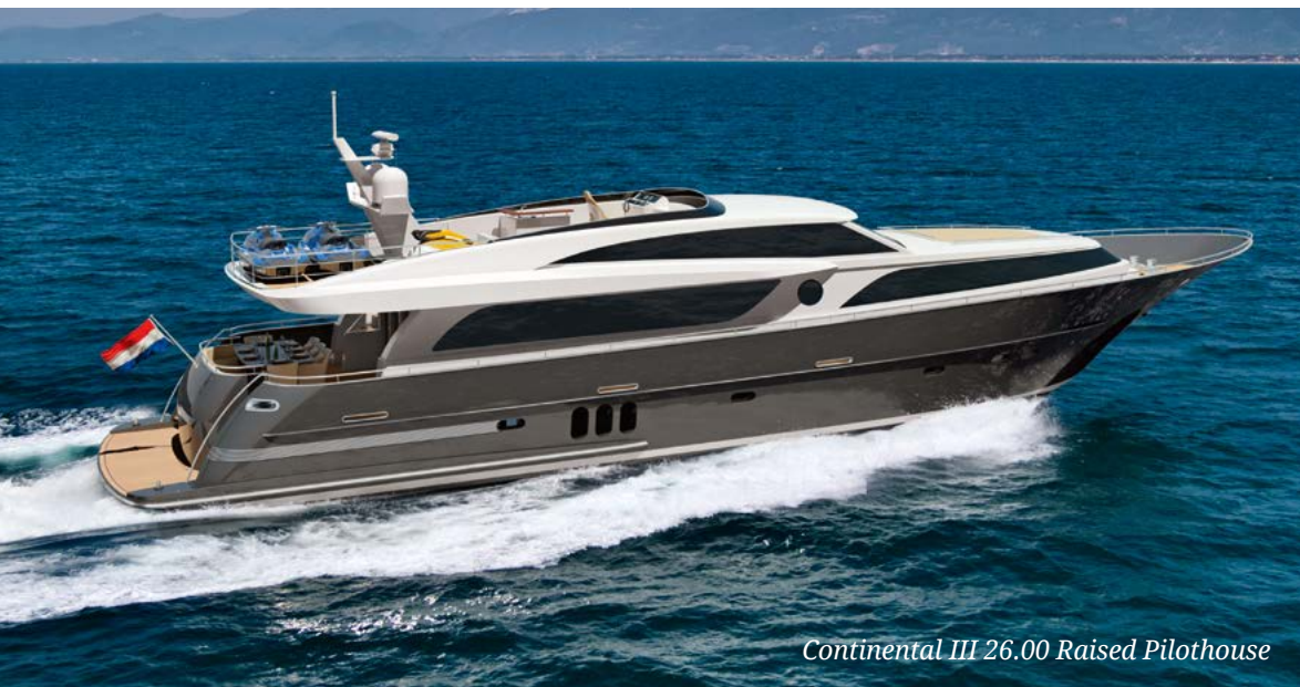
Continental III 26.00 Raised Pilothouse

Верфь Wim van der Valk представила одну из своих ярких и элегантных яхт — модель Continental III 26.00 Raised Pilothouse. Дебют состоялся в этом году в Дюссельдорфе, а в Каннах можно будет посмотреть на яхту уже на воде. Кстати, рядом будет выставлена другая известная модель верфи — Continental II 23.00. Несмотря на то, что лодки нельзя назвать полноценными новинками, не будем забывать о том, что все суда Wim van der Valk — это полностью custom-проекты, и каждая яхта строится согласно пожеланиям заказчика. Дизайном экстерьера и интерьера модели Continental III 26.00 Raised Pilothouse занималось бюро Guido de Groot Design.