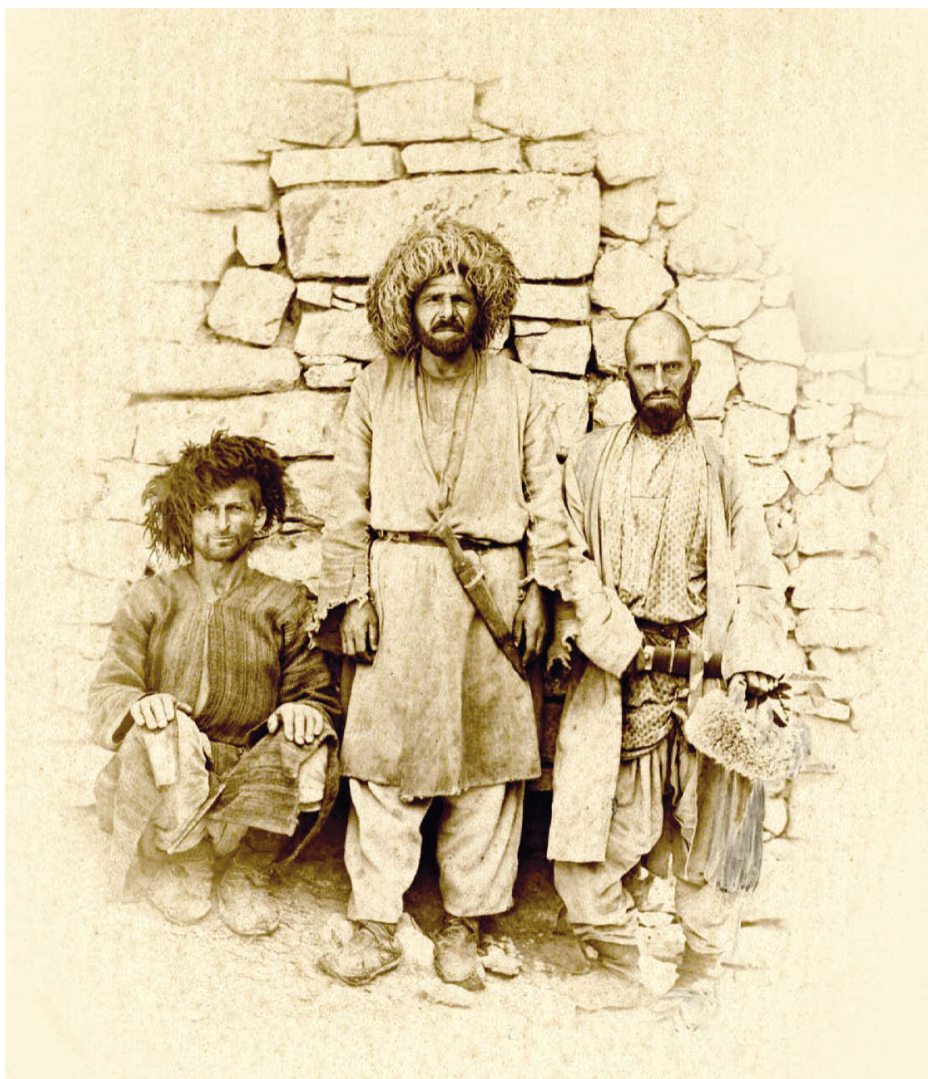
Десятники с. Унцукуль. Около 1865 г.

Foremen. Aul Untsukul About 1865.