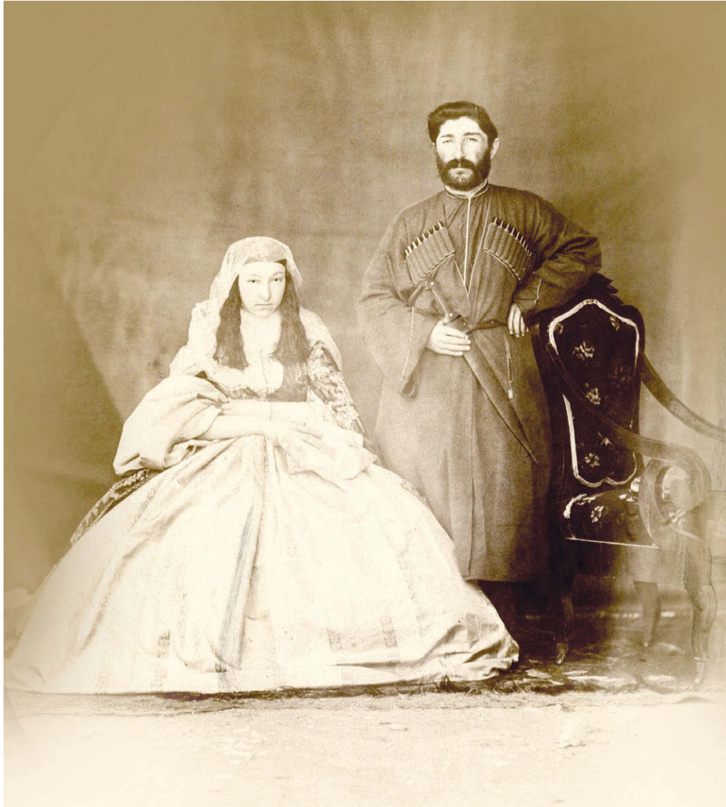
Рашид Хан Мехтулинский с супругой. Фотография поручика Кондратенко. Около 1865 г.