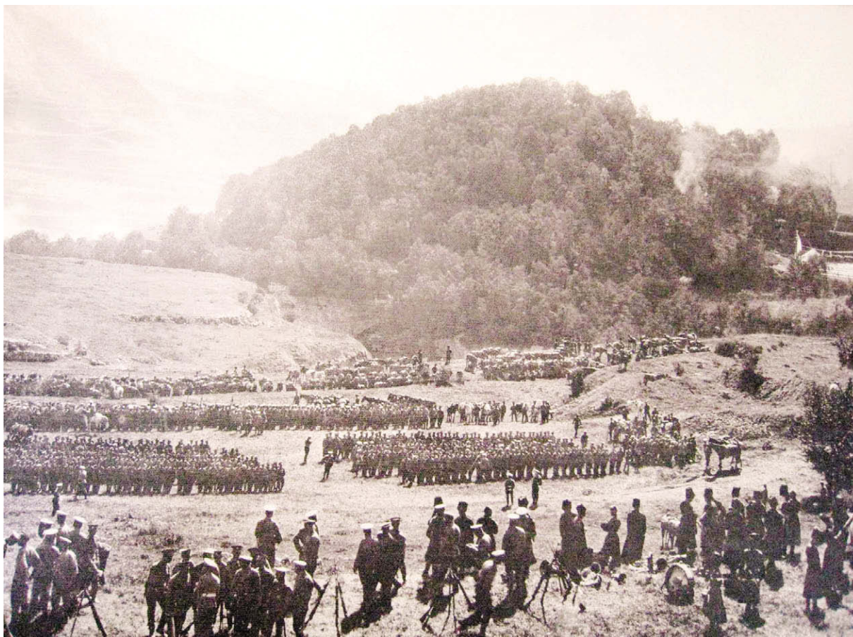
1859 год. Пленение имама Шамиля.