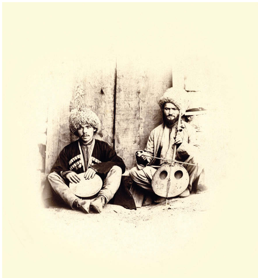
Музыканты из с. Гимры. Около 1865 г.

Musician from aul Gimry. About 1865.