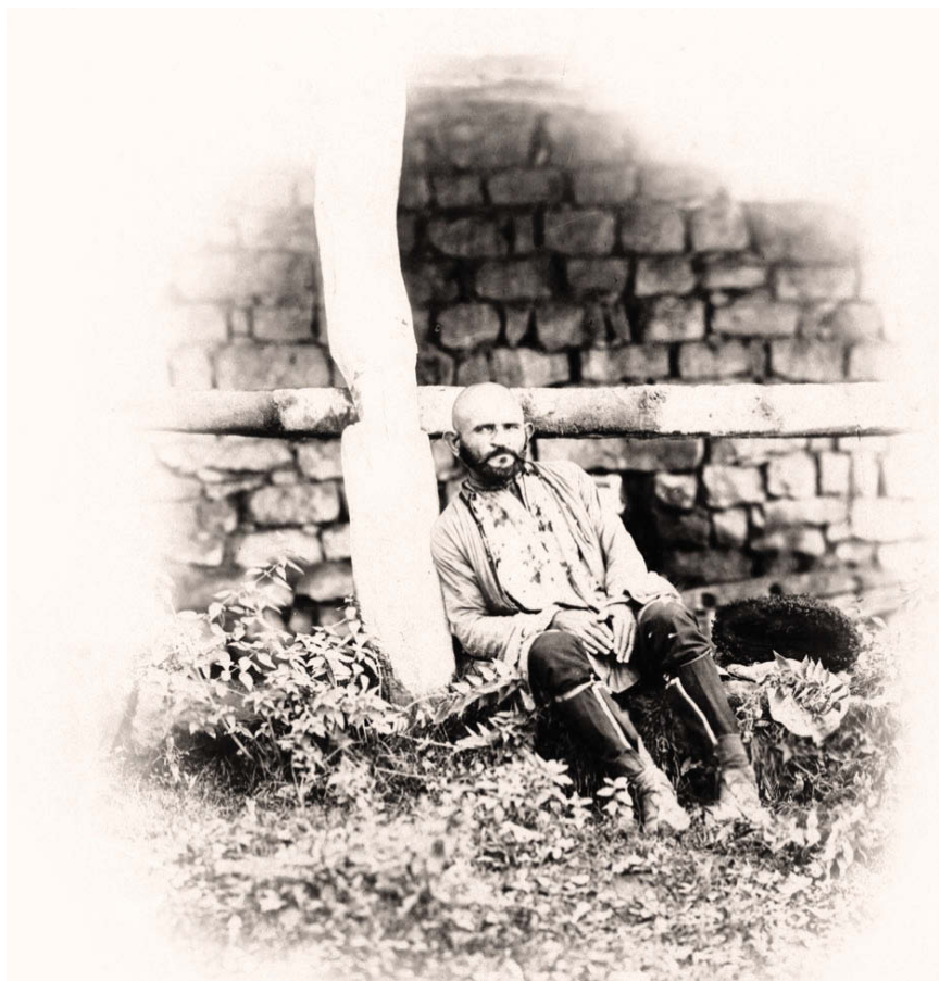
Нукер постоянной милиции житель с. Ашильта. Фотография поручика Кондратенко. Около 1865 г. Nuker of permanent militia, dweller of aul Ashilta Lieutenant Kondratenko's photo. About 1865.