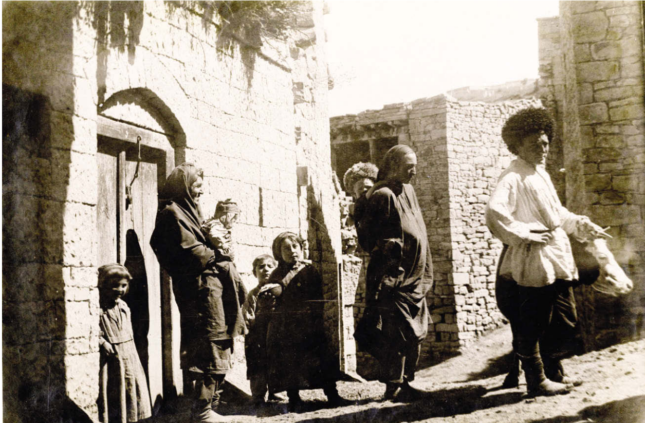
Ругуджинцы. Начало XX века.