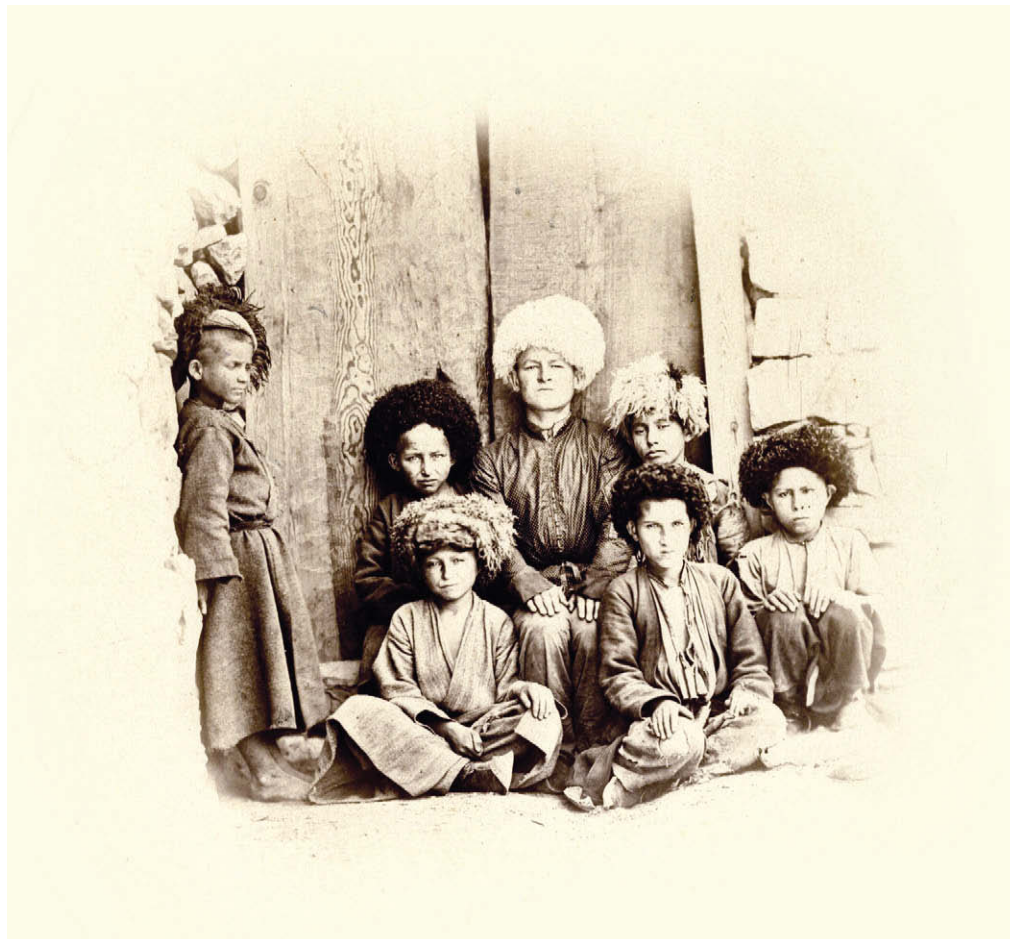
Маленькие гимринцы. Около 1865 г.