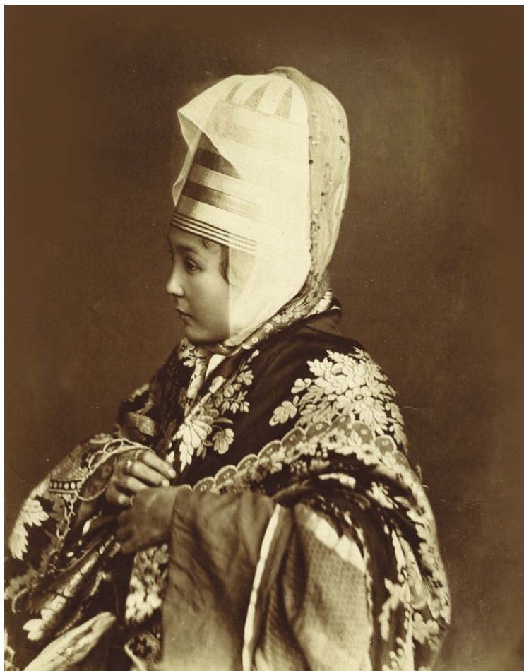
Ногайка. Около 1865 г.