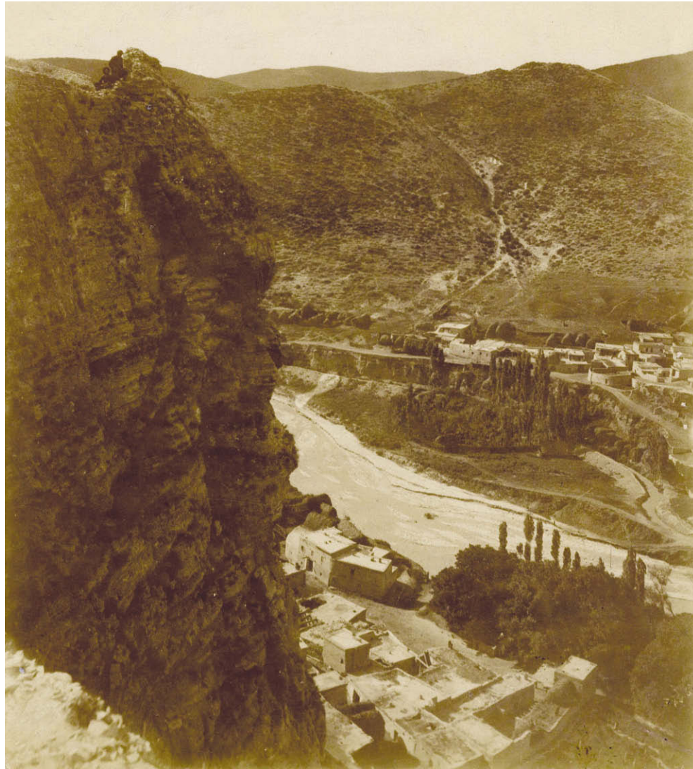
Губден. Конец XIX века.