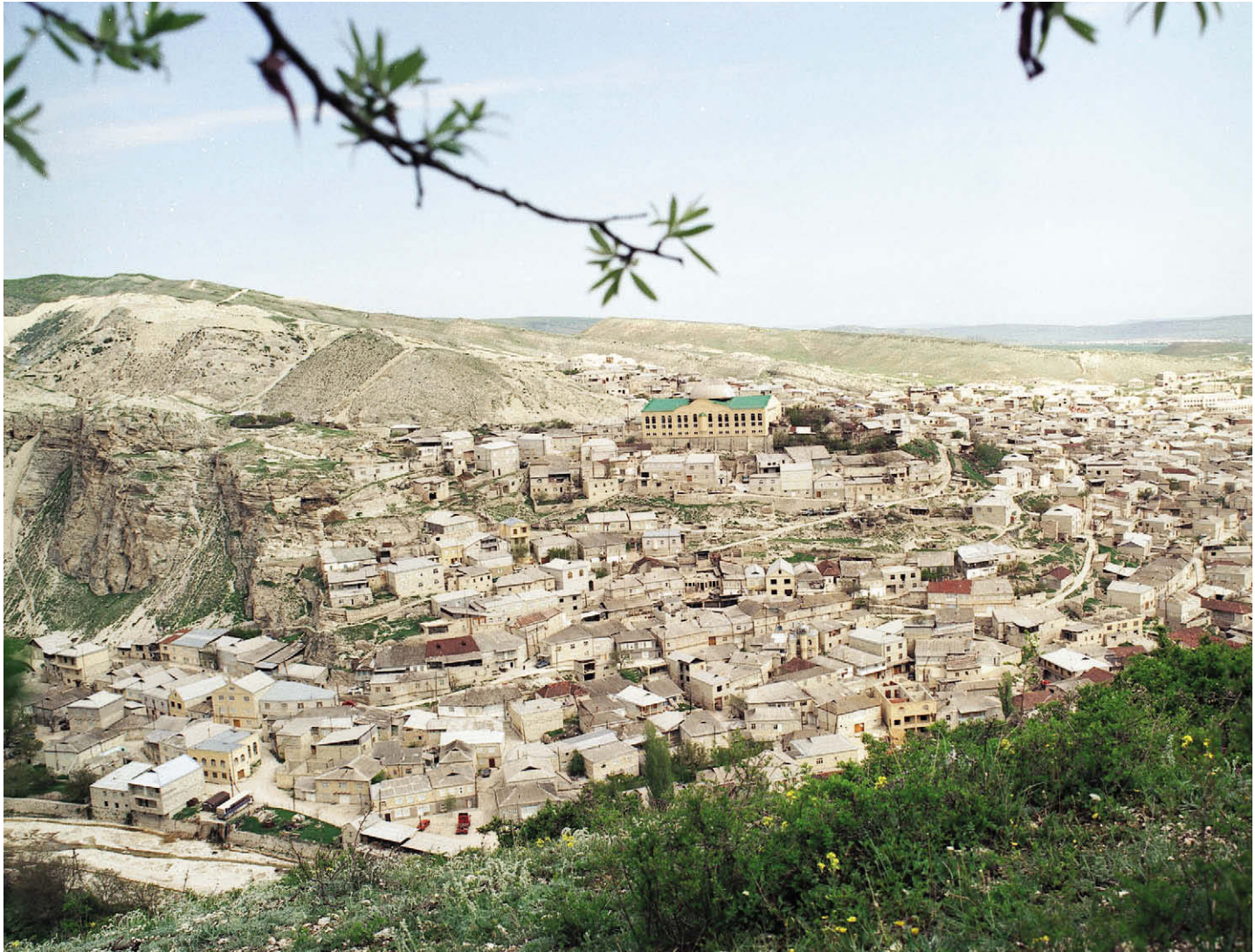
Губден. 2009 год.