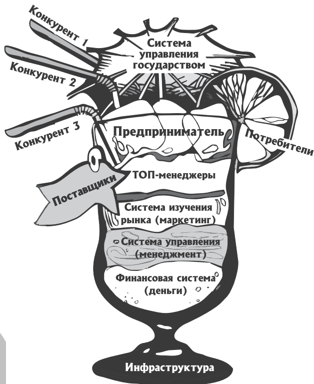
Рис. 1.4. Внутренняя и внешняя среда предпринимательства

Крупный бизнес имеет многоуровневую систему управления, развитые механизмы контроля рынка, обособленные специализированные подразделения. Например, подразделение по контролю рынка, подразделение стратегического планирования и т. д.