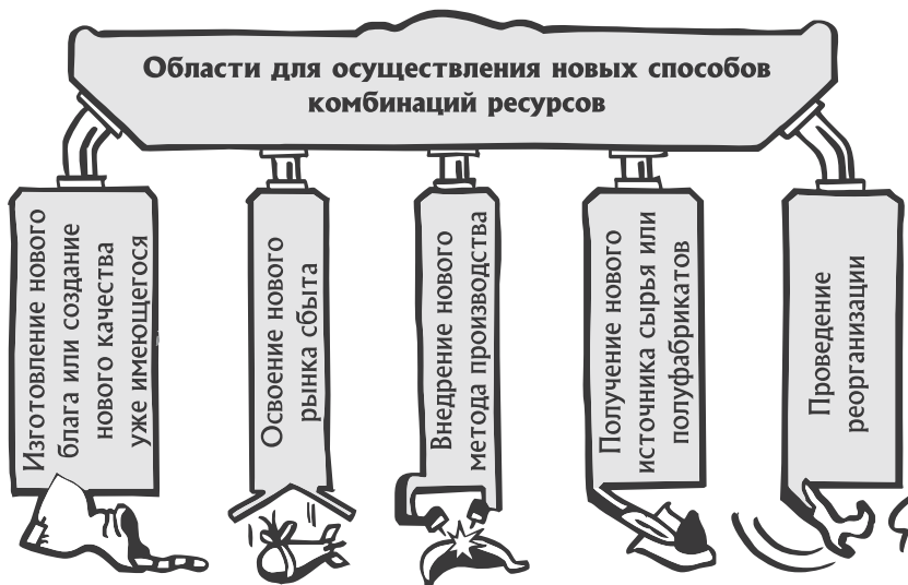
Рис. 1.1. Области применения предпринимательских идей