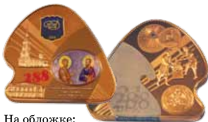
На обложке: Жетон, выпущенный к 288-летию Санкт-Петербургского монетного двора – филиала ФГУП «Гознак»

Состав редакционного совета формируется из национальных банков, монетных дворов и крупнейших компаний — дистрибьюторов монет. По вопросам вступления в редакционный совет «Золотого червонца», пожалуйста, обращайтесь по адресу редакции или по электронной почте info@watermark.ru