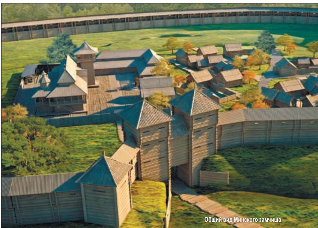
Общий вид Минского замчища

Роль традиций в жизни человека и общества в современных условиях стремительно изменяется. Динамика инновационных процессов, глобализация, ведущая к насаждению однородных культурных образцов и нивелированию различий, агрессивное наступление массовой культуры с ее стремлением к унификации и упрощению духовных потребностей человека придают особую остроту проблеме. Все это делает актуальным вопрос не только о роли и месте традиций, сохранении культурного наследия, но и о возможностях их использования.