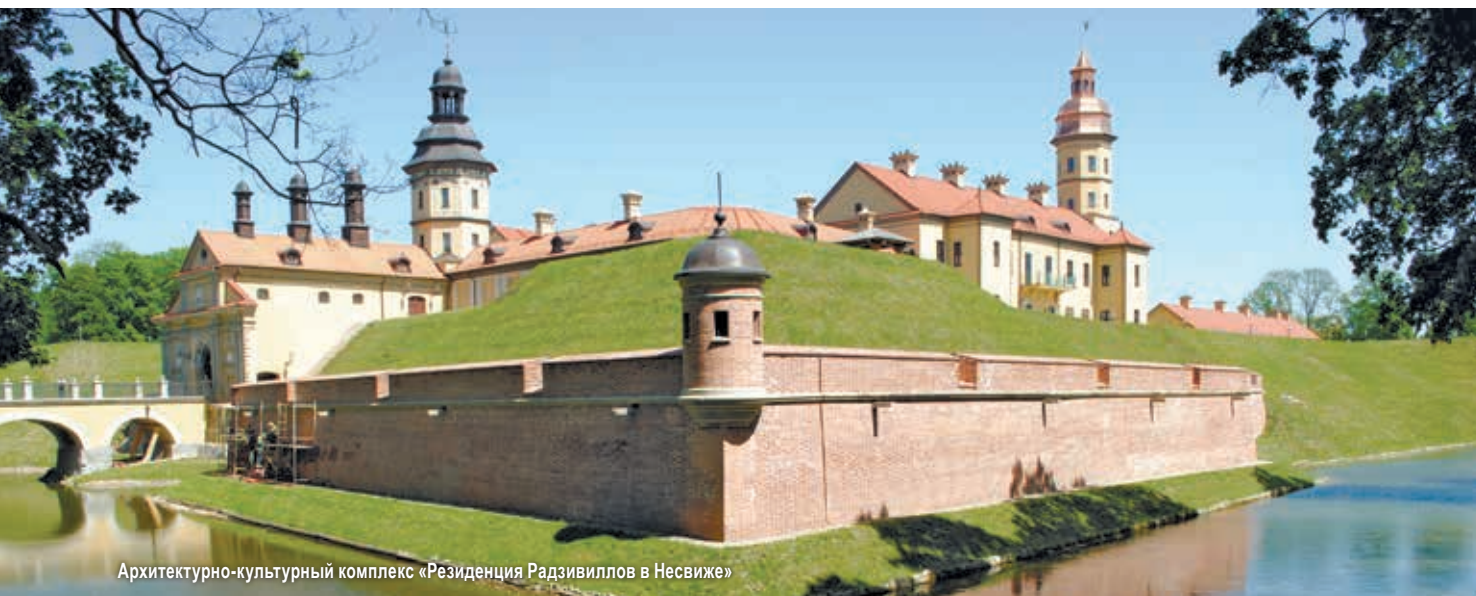
Архитектурно-культурный комплекс «Резиденция Радзивиллов в Несвиже»

ям «1» и «2» относятся ценности международной и национальной значимости, «3» – важные для отдельных регионов республики. На каждый объект составляется паспорт, содержащий полные научные и фактические сведения о нем, а также о порядке его использования и т.д.