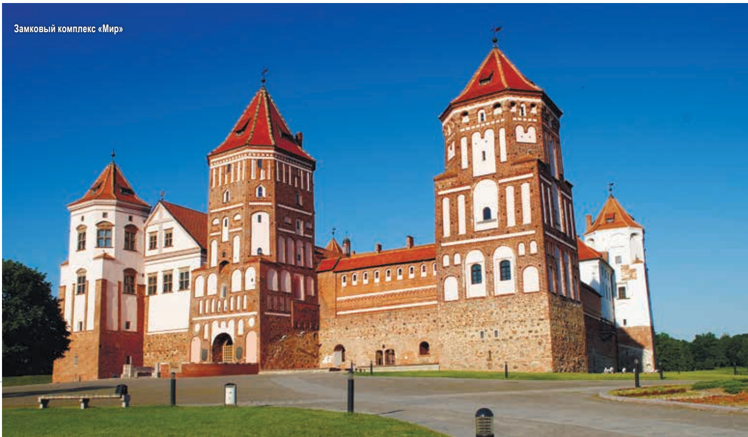
Замковый комплекс «Мир»

Материальные историко-культурные ценности подразделяются на категории. К примеру, категория «0» присваивается объектам, уже включенным или предложенным для включения в Список Всемирного культурного и природного наследия или Список всемирного наследия, находящегося под угрозой. К категори-