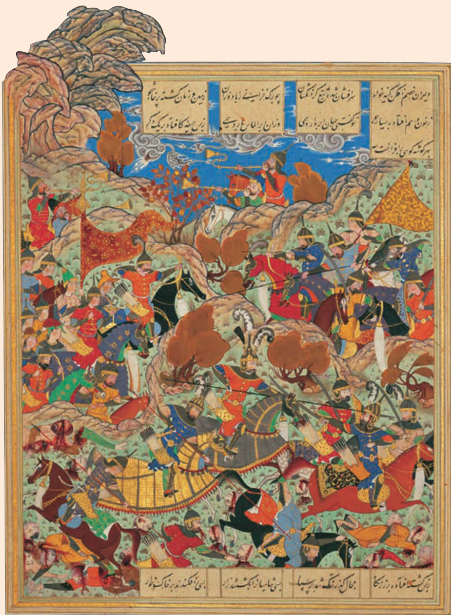
Битва Тамерлана с египетским царем. Дворец Гулистан, Тегеран. Иран