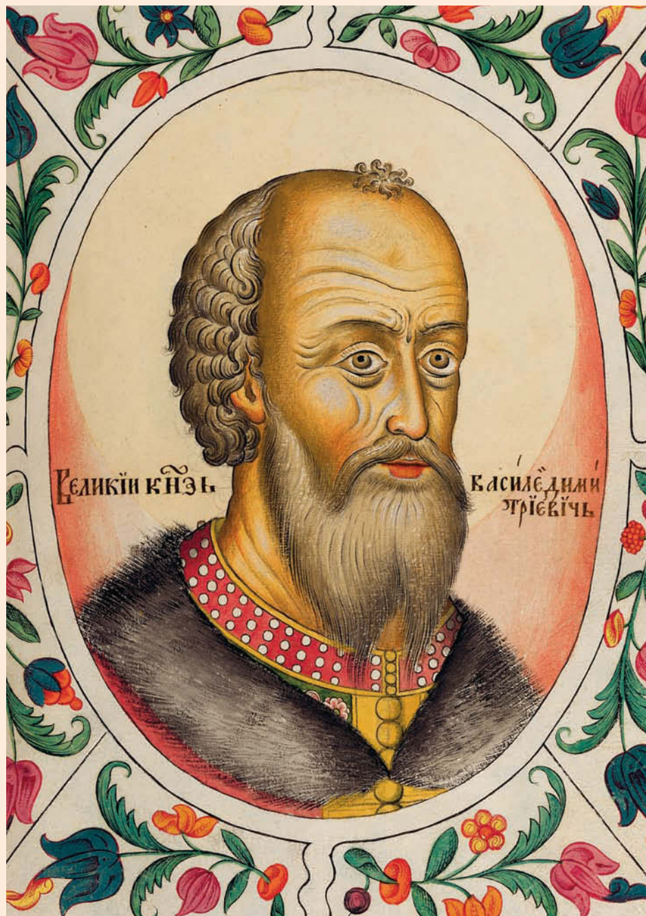
Великий князь Василий Дмитриевич. Миниатюра из «Титулярника»