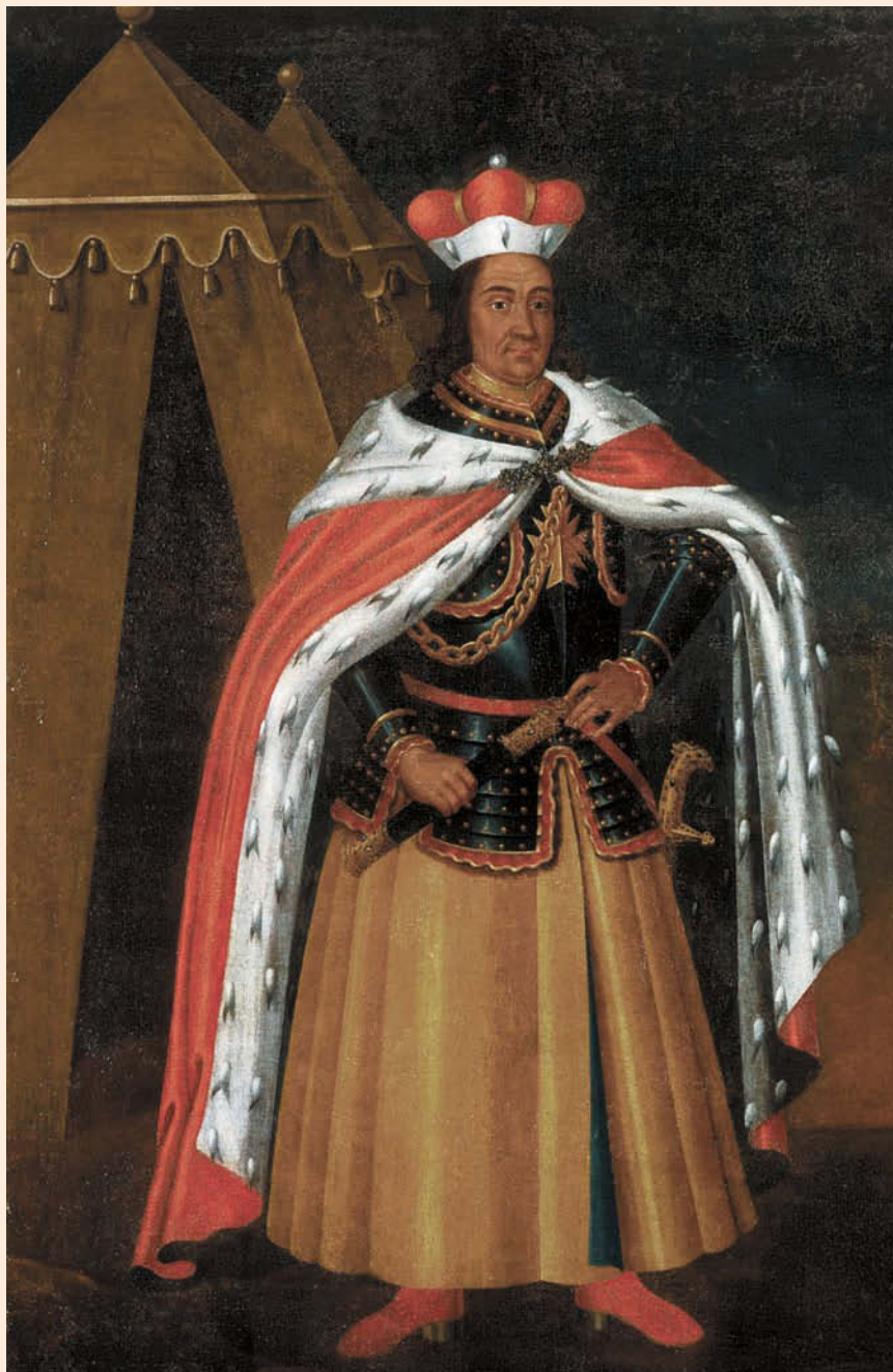
Неизвестный художник. Портрет Витовта Великого из монастыря августинцев в Бресте