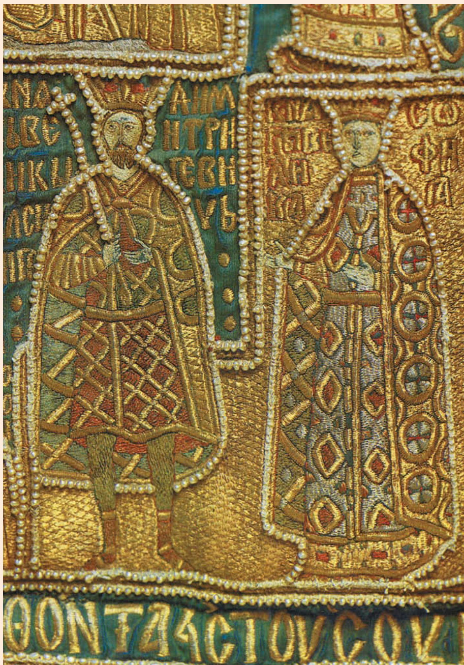
Великий князь Василий I Дмитриевич и великая княгиня Софья Витовтовна. Фрагмент большого саккоса митрополита Фотия