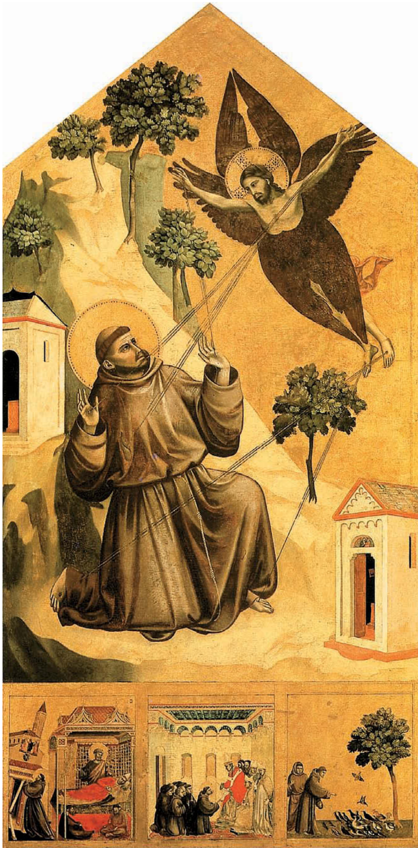
«Св. Франциск, получающий стигматы, с тремя сценами из жизни»