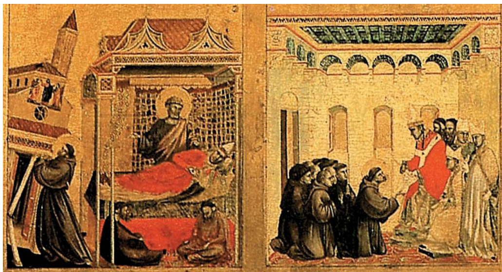
«Св. Франциск, получающий стигматы, с тремя сценами из жития» (фрагменты)

Франческо в Пизе. В Лувр она попала в 1814 году вместе с картинами Чимабуэ, Фра Анджелико и другими, собранными в Тоскане бароном Виван-Деноном. Центральный образ на картине приписывается самому Джотто. Маленькие житейные сцены написаны другой рукой, скорее всего кем-то из помощников мастера. Главная же сцена демонстрирует выход к монументальности нового толка, к осознанию трехмерности изображаемого пространства. На картине изображен один из наиболее почитаемых католических святых, Святой Франциск Ассизский – основатель монашеского ордена францисканцев. Его живописный образ очень много значил для ордена, так как Святой Франциск Ассизский считался не только преемником Христа, но и его живым воплощением, принявшим на себя с раны Спасителя – стигматы. Этот сюжет часто варьировался в более поздней живописи.