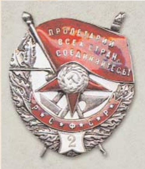
Орден Красного Знамени. Знак второго награждения

Order of the Red Banner. Sign of the second award