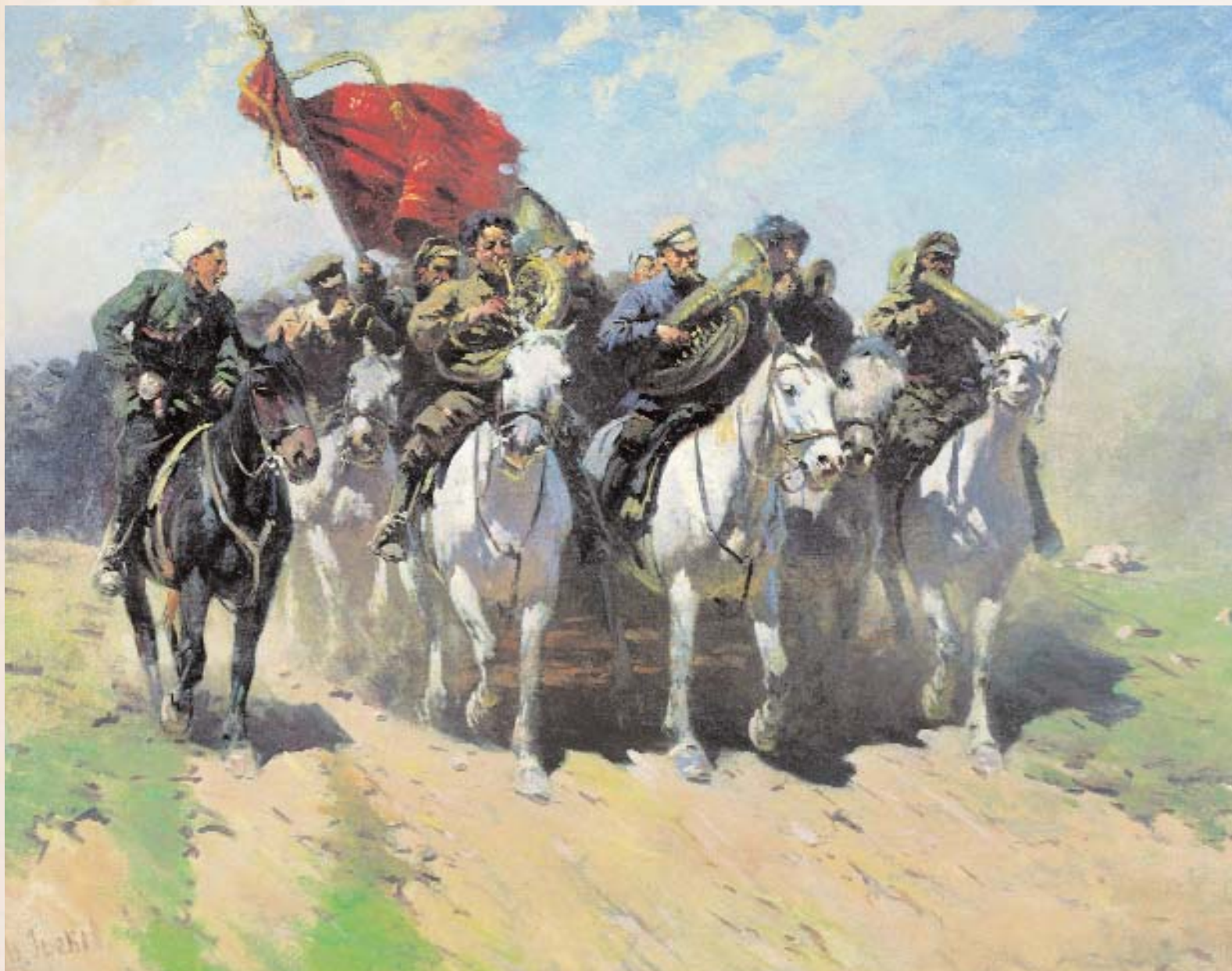
М. ГРЕКОВ. Трубачи Первой Конной M. GREKOV. Trumpeters of the First Cavalry Army

ская), Балтийский флот, 20 дивизий, 3 бригады, 18 полков, 2 батареи, 8 военно-учебных заведений.