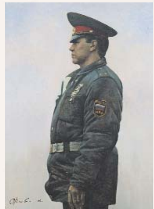
Ю. ОРЛОВ. Поставой

Медаль носилась на левой стороне груди на пятиугольной металлической колодке.