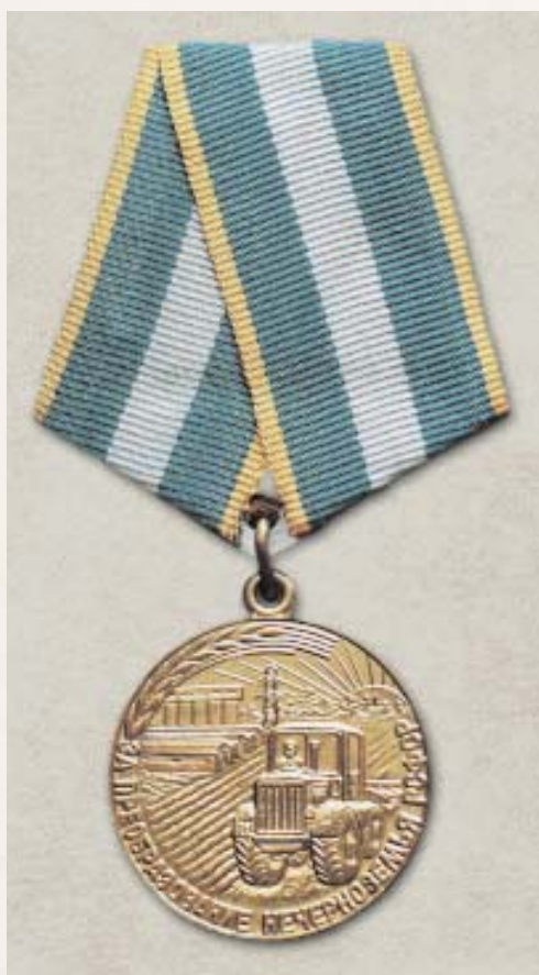
Медаль «За преобразование Нечерноземья РСФСР»

Medal 'For the Development of the Non-Black Earth Region of the RSFSR'