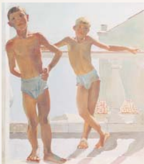
А. ДЕЙНЕКА. Крымские пионеры A. DEINEKA. Crimean Pioneers

Медаль учреждена Указом Президиума Верховного Совета от 16 февраля 1957 г. Награждено 27 тысяч человек.