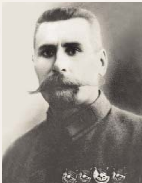
Комиссар Красной Армии Ян Фабрициус Comissar of the Red Army Yan Fabritsius