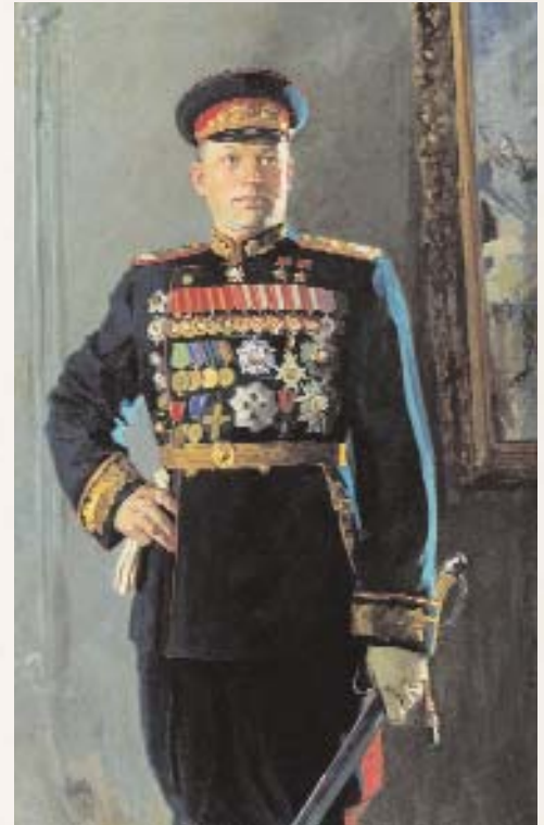
К. КИТАЙКА. Портрет маршала Советского Союза К.К. Рокоссовского

Всего в истории страны будет 60 человек, трижды на-