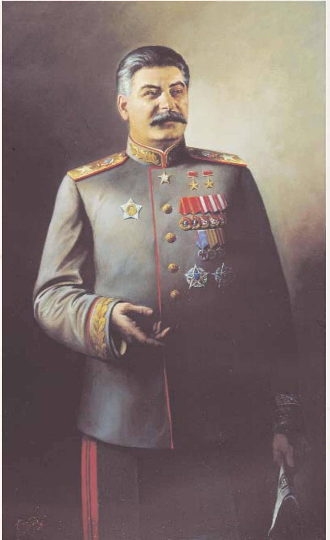
В. ЯКОВЛЕВ. Портрет И.В. Сталина

В следующие годы логикой жизни принимаются новые декреты Президиума ВЦИКа и Приказы Реввоенсовета, открываю-