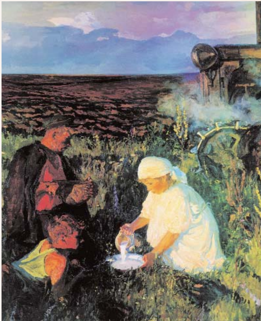
А. ПЛАСТОВ. Ужин трактористов A. PLASTOV. Supper of Tractor Drivers

Согласно положению, медалью «За преобразование Нечерноземья РСФСР» награждались рабочие, колхозники и служащие за ударный труд по выполнению долговременной программы развития сельского хозяйства Нечерноземной зоны РСФСР, проработавшие не менее 3 лет в расположенных в этой зоне колхозах, совхозах, в организациях и учреждениях, на предприятиях, деятельность которых непосредственно связана с преобразованием Нечерноземья России.