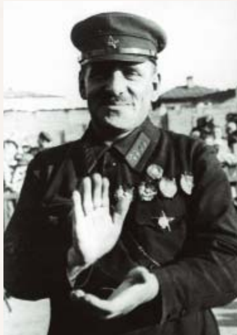
В.К. Блюхер — кавалер ордена Красного Знамени

Василий Константинович Блюхер, председатель Челябинского Совета и командующий Уральской партизанской армии, провел свой десятитысячный отряд почти полторы тысячи километров по тылам белых и, разгромив заслон из пяти полков, вышел на соединение с 3-й армией в районе Кунгура. Его подвиг сразу стал известен всей стране, на руки Блюхер получит орден лишь 11 мая 1919 г. Уже под № 114. Фактически же первым получил орден член РВС 8-й армии И.Э. Якир за умелое командование группой войск на воронежском направлении в декабре 1918 г. Так как готовых