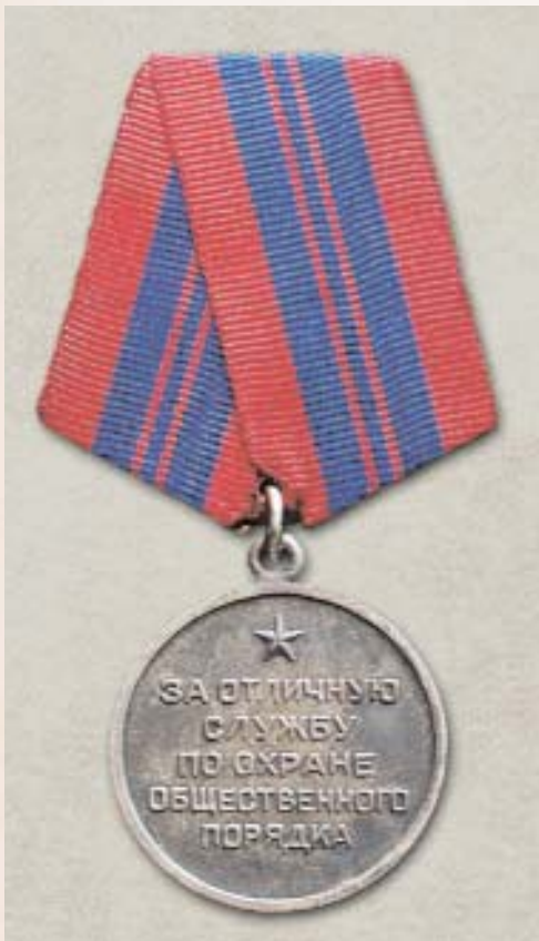
Медаль «За отличную службу по охране общественного порядка»

Medal for Distinguished Service in Protecting the Public Order