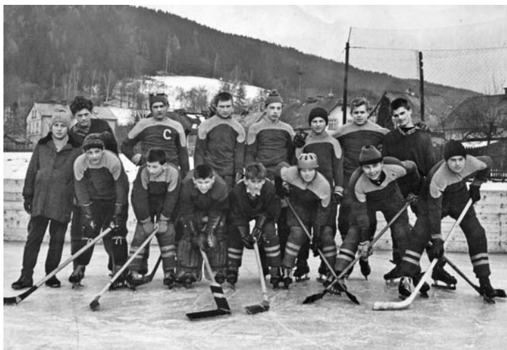
Рис. 1.4. Чешская юношеская команда на сборах, 1955 год

В конце XIX века канадский хоккей (именно так он и назывался) пришел в Европу. В 1908 году Великобритания, Богемия, Швейцария, Франция и Бельгия основали Международную лигу хоккея на льду (ЛИХГ, после 1978 года — ИИХФ) (рис. 1.4).