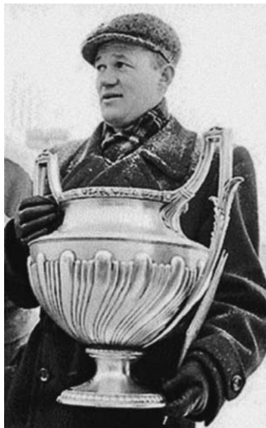
Рис. 2.3. Всеволод Бобров

1957 год — в СССР впервые проводился чемпионат мира по хоккею с шайбой. На московском льду сборная СССР, не проиграв ни одного матча, завоевала лишь серебряные медали. В решающем поединке со шведами нашим хоккеистам нужна была только победа. После двух периодов хозяева чемпионата вели 4:2. В третьей 20-минутке этого драматичного поединка скандинавы забросили две шайбы, добились ничьей, а вместе с ней и золотых медалей.