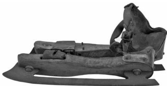
Рис. 1.1. Старинные коньки для игры в хоккей

Современный хоккей с шайбой возник в Канаде. Это страна, климат и природа которой (многочисленные водоемы, замерзающие зимой, и длинные зимы) создают отличные условия для распространения этой игры. Сначала играли не шайбой, а тяжелым мячом и по численности команды доходили до 50 и более игроков с каждой стороны. Затем, в период совершенствования правил, игра обрела форму современного хоккея — скоростной игры с малым количеством игроков на небольшой площадке с бортами и воротами с вратарем.