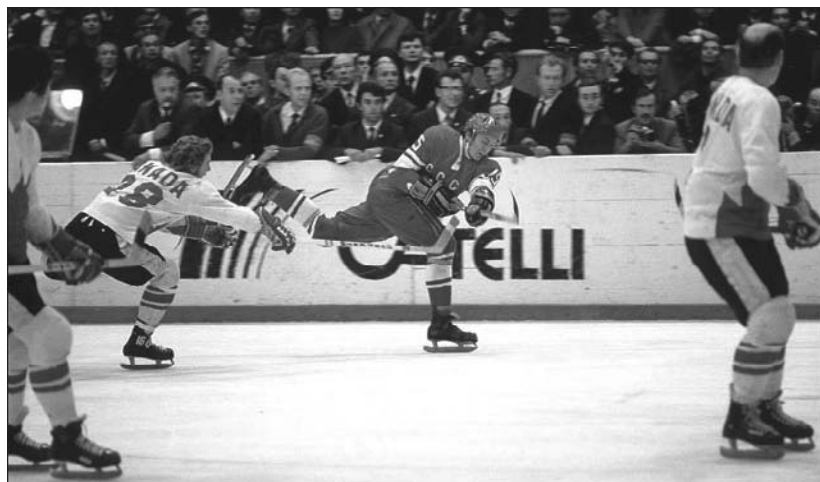
Рис. 2.4. Суперсерия 1972 года, СССР — Канада: бросок Александра Якушева

1974 год — в Зале хоккейной славы (Торонто, Канада) впервые помещен портрет иностранного специалиста. Им стал Анатолий Владимирович Тарасов. Рядом с портретом слова: «Анатолий Тарасов — выдающийся хоккейный теоретик и практик, внесший огромный вклад в развитие мирового хоккея. Мир должен благодарить Россию за то, что она подарила хоккею Тарасова».