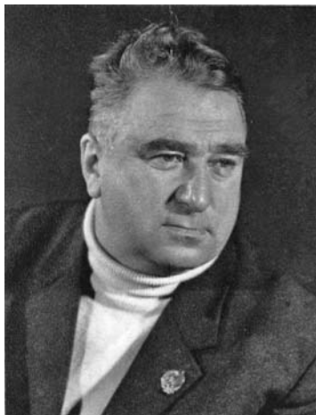
Рис. 2.2. Анатолий Тарасов

В сезоне 1951/1952 в СССР был проведен первый телевизионный репортаж о матче по хоккею.