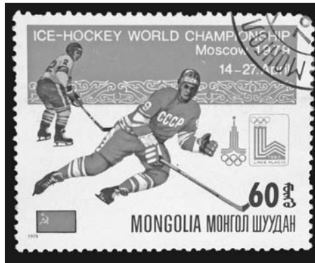
Рис. 2.1. Советскими хоккеистами восторгался весь мир (монгольская почтовая марка)

Большим событием стали в 1948 году международные матчи советских хоккеистов, тогда под флагом сборной Москвы, с чехословацкой командой ЛТЦ (Прага). В составе гостей выступали игроки, составлявшие основу сборной своей страны, завоевавшей годом ранее золотые медали на чемпионате мира (правда, в отсутствие на турнире в Праге родоначальников хоккея — канадцев). Те товарищеские матчи показали, что наши хоккеисты могут не только на равных противостоять ведущим командам мира, но и обыгрывать их. В первой же игре 28 февраля на льду Центрального стадиона «Динамо» москвичи победили со счетом 6:3. Советские хоккеисты отличались великолепной техникой катания и высокоскоростной игрой, ведь большинство из них прошли школу хоккея с мячом, а некоторые продолжали совмещать выступления и в том и в другом виде спорта (рис. 2.1).