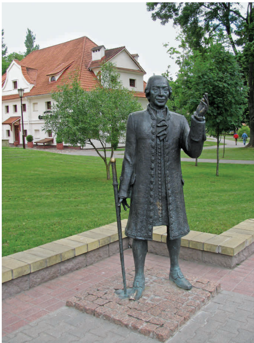
Памятник Жану Эммануэлю Жилиберу в Гродненском парке

дика китайская ( D. chinensis ), лилейник желтый ( Heimerocallis flava ), лилейник буро-желтый ( Heimerocallis fulva ), лилия луковичноносная ( Lilium bulbiferum ), нарцисс поэтический ( Narcissus poeticus ), птицемлечник зонтичный ( Ornithogalum umbellatum ), ирис форма «Вариегата» ( Iris sp. variegata ),