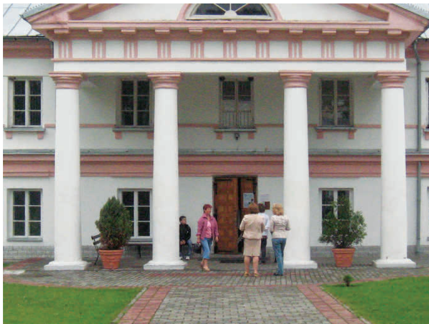
Здание школы пиаров в г. Щучин, Гродненская обл. (2010 г.)

Юндзилл был уважаемым ученым, но также и хорошим практиком, деятельность которого высоко оценивалась его современниками. Об этом говорит, к примеру, тот факт, что именно Юндзилла австрийский профессор Кноблах просил в 1795 г. устроить ботанический сад лекарственных растений при венском ветеринарном училище, когда Юндзилл находился в Австрии на стажировке. При помощи нескольких студентов он создал во дворе венского ветеринарного училища сад лекарственных растений.