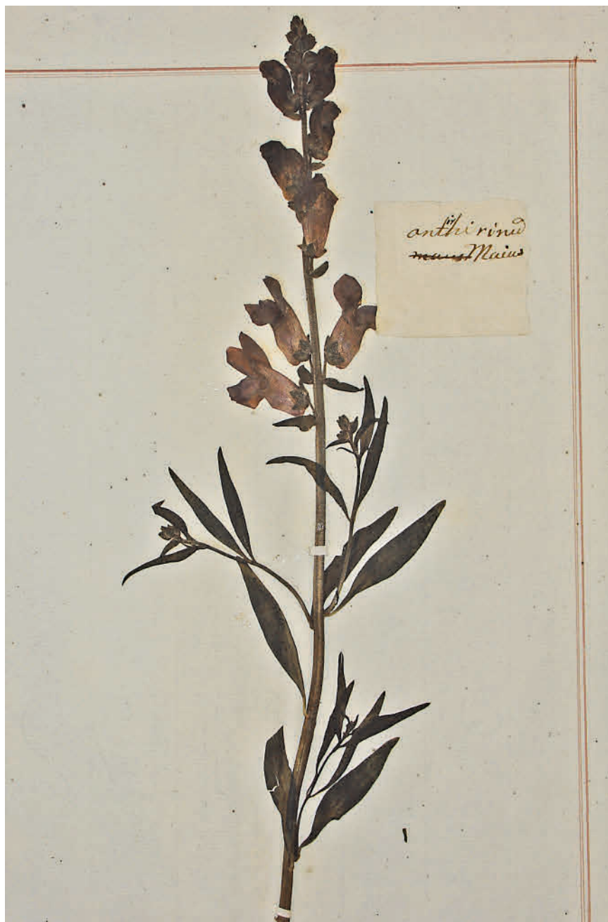
Гербарий Жилибера (1776–1778 гг.) Львиный зев ( Antirrhinum majus L.)

Изображения этих растений из гер- бария, собранного Жилибером в Грод- ненском ботаническом саду, пред- ставлены на рисунках.