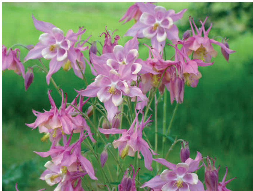
Аквилегия гибридная ( Aquilegia x hybrida hort. )