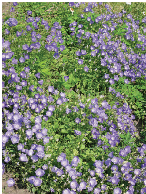
Колокольчик карпатский ( Campanula carpatica Jacq. )