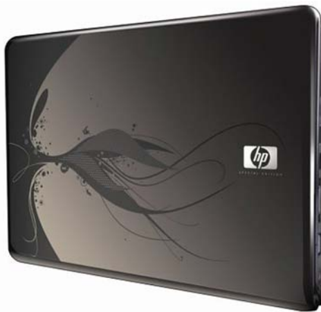
Рис. 1.2. Первое отличие ноутбука — его мобильность

Теоретически и настольный компьютер можно переносить с места на место, но те, кто этим занимался (хотя бы при переезде), знают, во что может вылиться такой, казалось бы, безобидный вопрос — начиная с отсутствия необходимых шнуров и заканчивая невозможностью дотянуться до розетки в связи с маленькой длиной кабеля. Следовательно, размеры, масса,