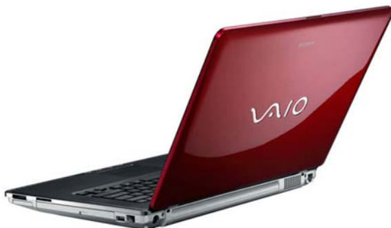
Рис. 1.1. Каждый ноутбук "заточен" под свою задачу

На самом деле разница огромная. Если компьютер — универсальная машина, изначально рассчитанная на выполнение разнообразных задач (разница, по большому счету, только в процессоре, размере памяти и видеопамяти, а также в объеме жесткого диска), то с ноутбуками все не так просто. Каждый класс ноутбуков "заточен" под выполнение своих, специфических задач, т. е. область применения у них различная (рис. 1.1). Либо это 12-дюймовый "тонкий — легкий" аппарат, подходящий тем, кому приходится целый день перемещаться, имея при себе портативный компьютер, вводя туда какие-то данные; либо это мощная машина, предназначенная для серьезных графических приложений; либо ноутбуку придется трудиться в тяжелых полевых условиях в какой-нибудь геологоразведочной экспедиции, что предполагает более серьезную защиту (прочный корпус, демпфирующие прокладки под жесткий диск и экран, клавиатуру с защитой от влаги) и т. д.