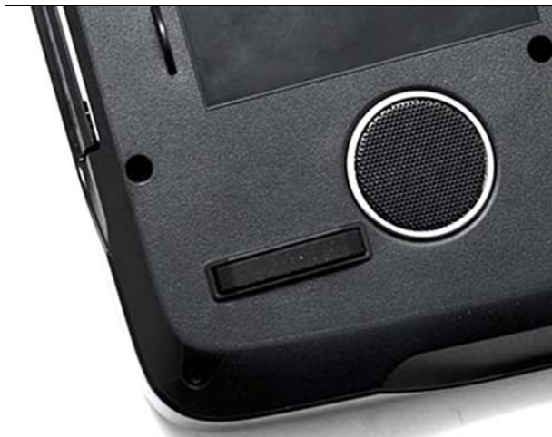
Рис. 1.3. Сабвуфер, находящийся на нижней части корпуса ноутбука

буках — и нигде более. Вывод таков: ноутбук является более высокотехнологичным устройством, чем настольный компьютер.