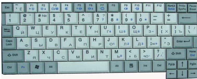
Рис. 1.4. Типичная клавиатура ноутбука

отсутствие мерцания. И еще: отсутствие серых полей по краям в жидкокристаллических матрицах делает всю ее область рабочей. То есть на 14-дюймовом экране будет такой же размер изображения, как на 15-дюймовом мониторе, имеющем электронно-лучевую трубку.