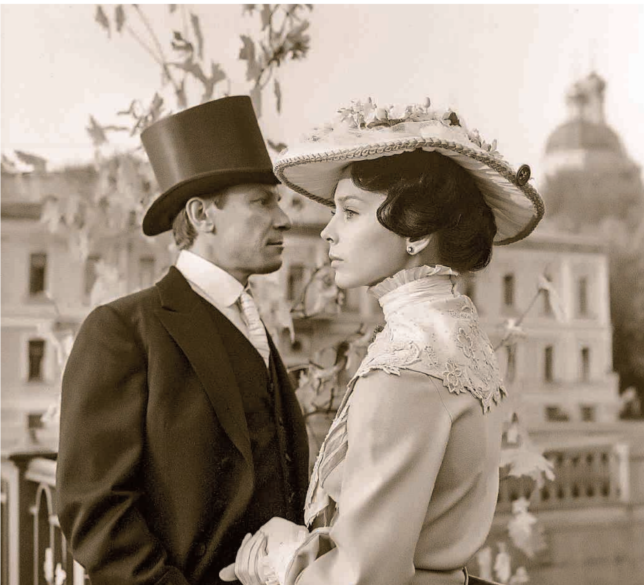
Сергей Шакуров и Галина Беляева в фильме «Анна Павлова», 1983 год