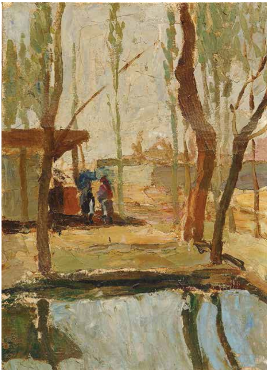
Улица в Маргилане. 1960 Картон, масло Собственность автора. Ташкент