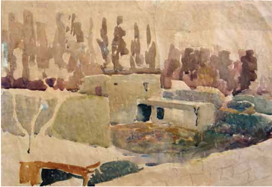
Маргиланский дворик 1959. Бумага, акварель Государственный музей искусств им. И.В. Савицкого Нукус

но они не имели на нас такого влияния, как Мартаков, потому что прежде всего он присутствовал все время, весь рабочий день. Это не значит, что он сидел около нас, он уходил, давал нам возможность свободно работать, но присутствовал целый день. И его обаяние, его талант рассказчика были необыкновенны. Он столько замечательных историй рассказывал, такие байки военных лет, и морские, и житейские, про Ташкент и так далее. И они все были поучительны. И самое интересное, что он время от времени повторял: «Художнику очень важно развить в себе силу воли. Сила воли – самое главное качество художника». Это он повторял неустанно. Тогда мы не совсем это понимали. А впоследствии я понял, насколько он был прав. Так что он учил не только держать карандаш и резинку в руках, но был таким наставником по жизни, что ли. У каждого из нас свои какие-то особенности, проблемы, и он всегда оказывался рядом. Сам он в свое время учился в училище у А.Н. Волкова, а потом – в Ленинградской Академии. И учился не у кого-нибудь, а у Бернштейна 9 , очень серьезного педагога по рисунку. Потом я ознакомился с книгой Бернштейна «Учебный рисунок». Я считаю, что это один из лучших учебников. Это блестящая книга, с таким анализом рисунков художников, каких я не встречал больше нигде. Кстати, Волков тоже в свое время учился в школе Бернштейна, так что эта линия и через Волкова,