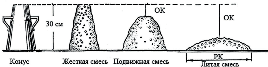
Рис 1.1. Определение вида и подвижности бетонной смеси при помощи стандартного конуса [3]

По удобоукладываемости бетонные смеси делятся на подвижные и жесткие. Определение вида смеси и ее подвижности производится при помощи стандартного конуса [11]. Он заполняется бетонной смесью (с уплотнением), а затем снимается. Если смесь при этом сохраняет форму, она является жесткой, а если деформируется (оседает), то подвижной (рис. 1.1).