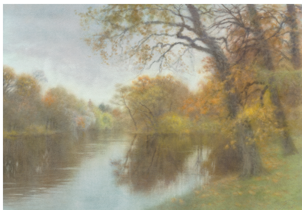
Е. ДУБИЦКИЙ. Елагин остров. Осенние пруды. E. DOUBITSKY. Yelagin Island. Autumn Ponds. 38×55 cm. 2013