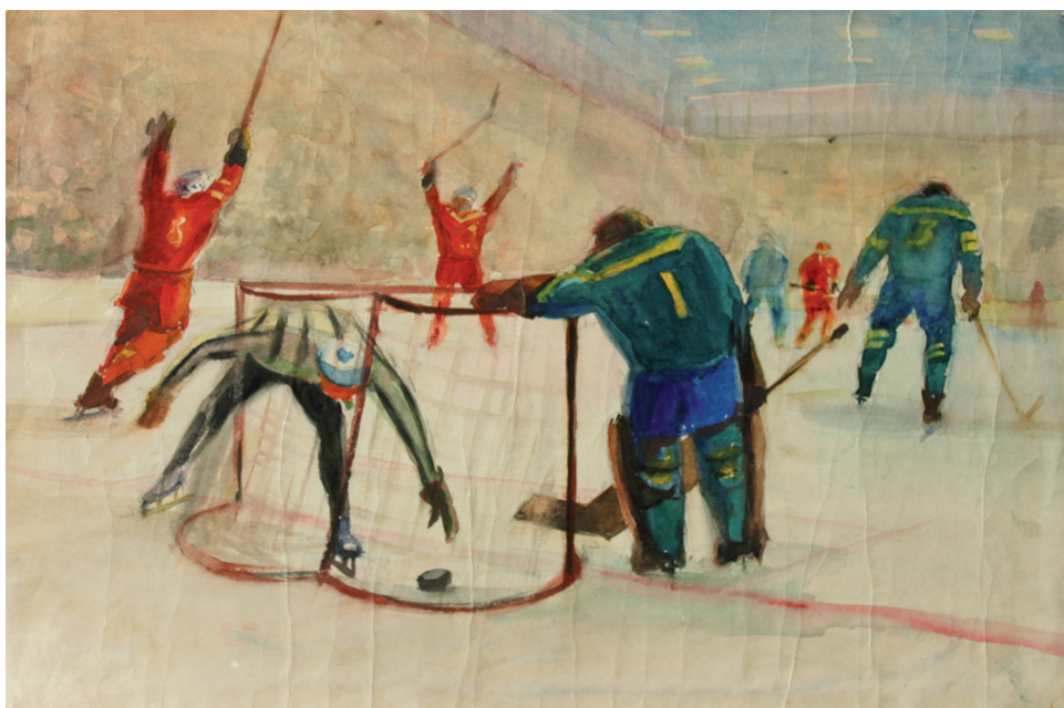
Гол! / Goal! 39×44 cm. 1964