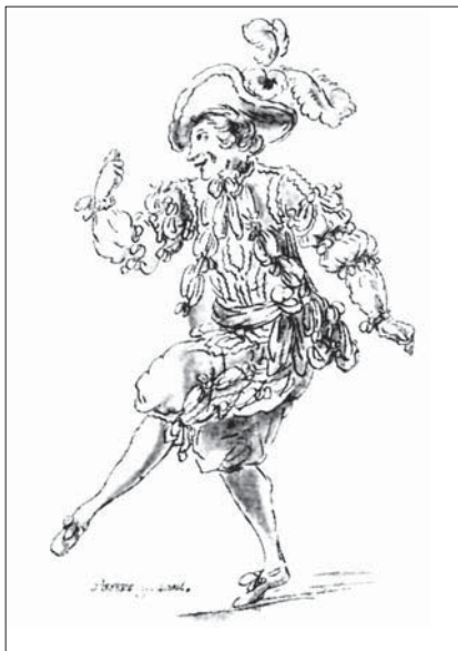
«Комический танец». Рисунок костюма худ. Бокэ для одного из балетов Новера. XVIII в.