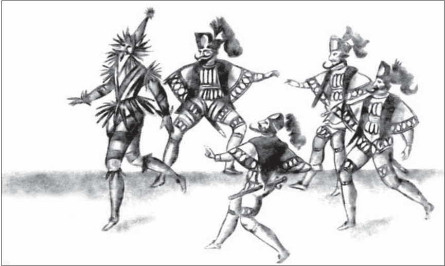
Танцевальный выход «Великого хана». Балет «Четыре страны света». 1628 г.

женного народного характера, не перестало быть движением, присущим многим национальным танцам, упоминаемым в литературных источниках чуть ли не с XV столетия. О нем говорит «патриарх» хореографии — Лангрский каноник Табуро (Туано Арбо), который в своей книжке «Орхесография» 4 уделяет много места примитивной классификации и записи французского бытового танца.