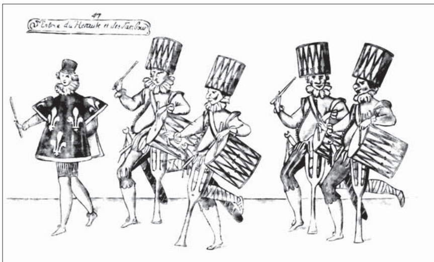
Танцевальный выход «Герольда и барабанщиков». Балет «Вдова из Бильбао». 1625 г.

От «Докучных» (1661) до последнего, предсмертного создания — «Мнимый больной» (1673), творчество Мольера как автора хореографических эпизодов идет по восходящей линии, достигая драматического и танцевального апогея в «Мещанине во дворянстве». Тема «Мольер и его роль в хореографии» 16 заслуживает специального и большого исследования.