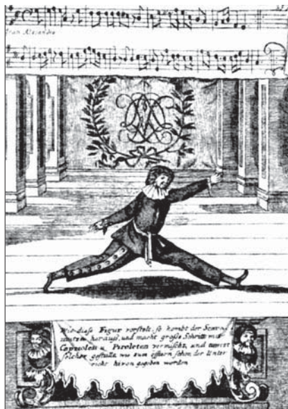
Шпагат. Ламбранци. Школа театрального танцевания. 1716 г.

А я спрошу, в свою очередь, — куда девалось благородство вашего танца? Его давно не существует» 26 .