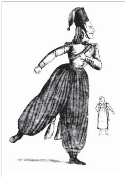
«Па де козак» — из мелодрамы «Польский сержант», соч. Риго. Театр «Porte St.-Martin». Париж. 1820 г.

является вторым по очереди, а не третьим жанром. Третье место у Блазиса занимает совершенно новый вид танца — «низкий», этнографический, почитающийся еще недостойным академической системы.