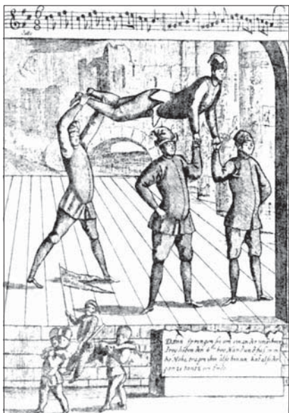
Финал танца. Ламбранци. Школа театрального танцевания. 1716 г.

и танца, сочиненных по всем правилам придворной хореографической эстетики, эти балеты, смешивающие все жанры и нарушающие установленные каноны и рецепты, действительно кажутся зрителю того времени грубыми. Авторы балетов не стеснялись в выборе средств, черпая их в пантомимах ярмарочного театра, в трюках акробатов, в приемах игры актеров ярмарочного-площадного балагана, наконец, в репертуаре канатных плясунов 32 .