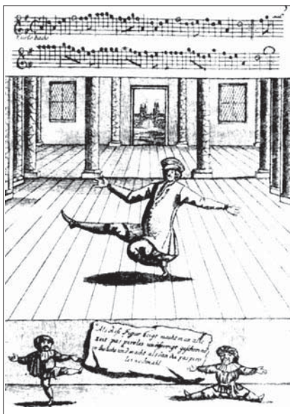
Присядка и пируэт. Ламбранци. Школа театрального танцевания. 1716 г.