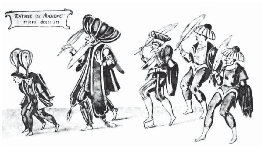
Танцевальный выход «Магомета и докторов». Балет «Вдова из Бильбао». 1625 г.

В характерных entrées преобладали реально-бытовые образы буффонного и фарсового порядка, и это обстоятельство лишней раз свидетельствует о влиянии городского драматического театра на придворный.