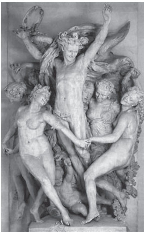
Ж.-Б. Карпо. «Танец» (Париж, 1869)