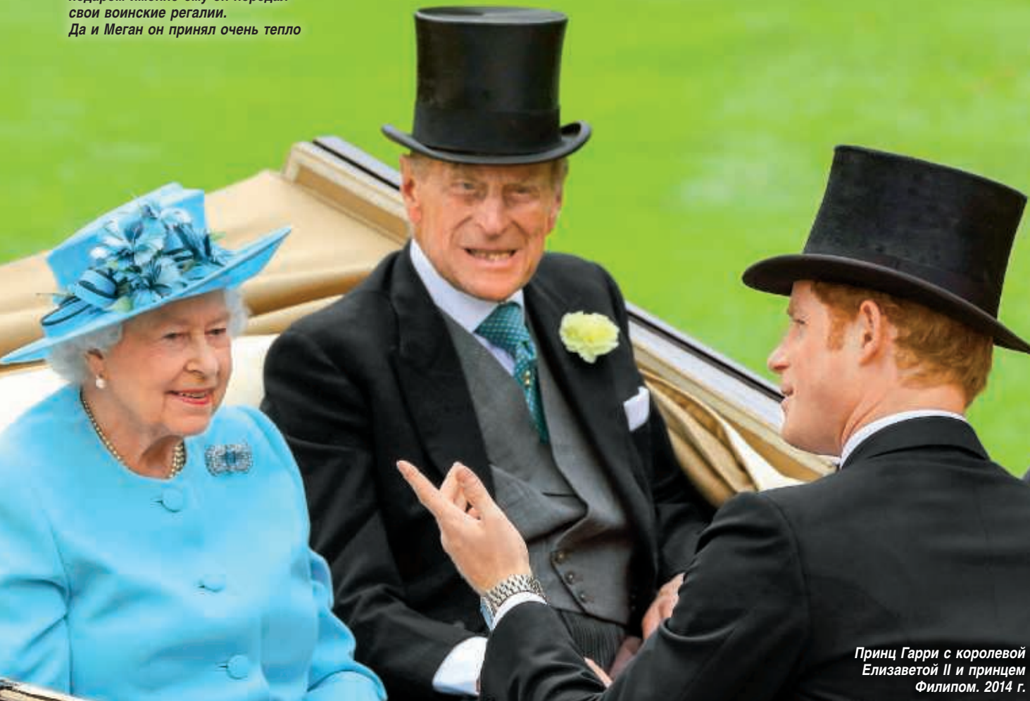
Принц Гарри с королевой Елизаветой II и принцем Филипом. 2014 г.

У 99-летнего Филипа (он не дожил до своего 100-летия 2 месяца) были особые отношения с Гарри, недаром именно ему он передал свои воинские регалии. Да и Меган он принял очень тепло