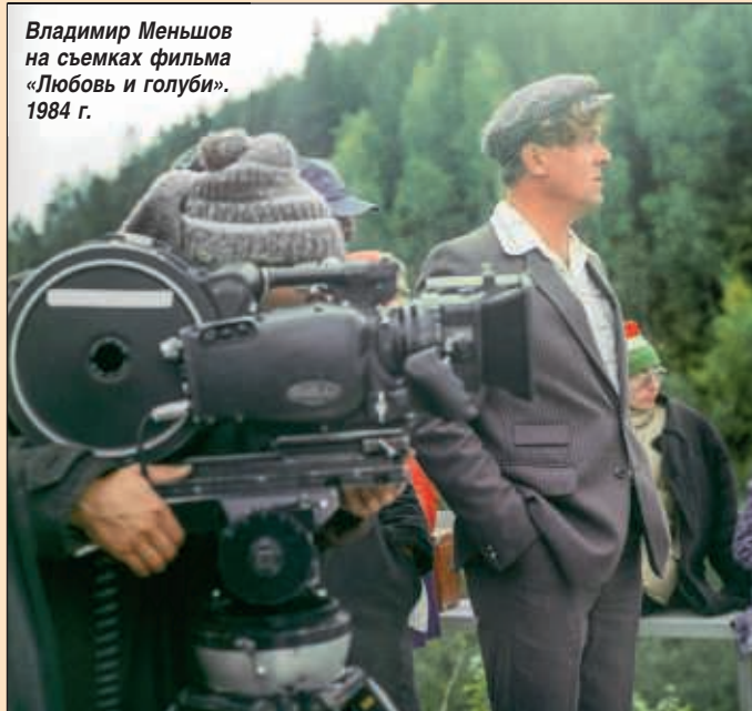
Владимир Меньшов на съемках фильма «Любовь и голуби». 1984 г.