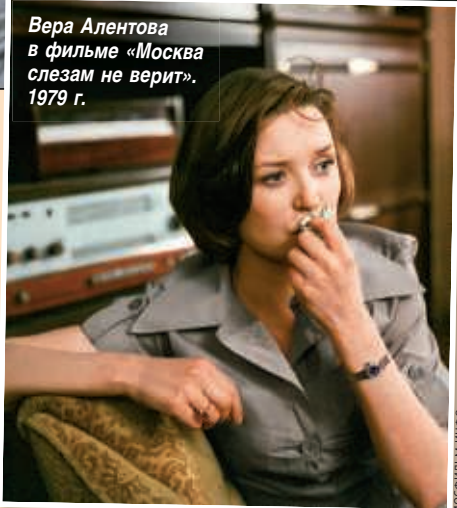
Вера Алентова в фильме «Москва слезам не верит». 1979 г.

«Есть люди такие, постоянно самоутверждающиеся, — рассуждал мэтр. — Люди, вечно доказывающие, что они — первые, лучшие, бесконечные. У меня этого, к счастью, нет. Если кто вдруг идеальный получился, то жизнь его обязательно поправит. Я далеко не идеален, но мне ни за что не стыдно, я сделал в жизни много хороших, достойных дел. И, как пел Высоцкий, «мне есть, что спеть, представ перед Всевышним...»