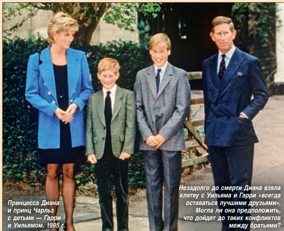
Принцесса Диана и принц Чарльз с детьми — Гарри и Уильямом. 1995 г.

События в королевской семье развиваются стремительно, как в хорошем сериале. 4 июня в клинике Санта-Барбары Меган родила дочку, которую назвали Лилибет Дианой Маунтбеттен-Виндзор. И выбор такого имени многим показался дерзким и вызывающим. Лилибет — так когда-то называл