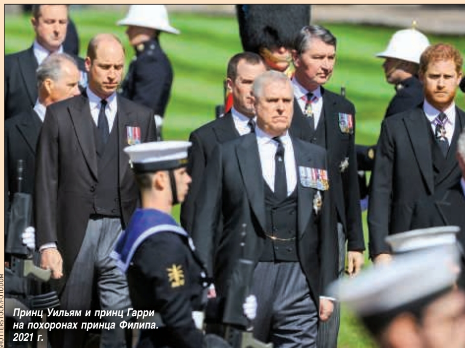
Принц Уильям и принц Гарри на похоронах принца Филипа. 2021 г.

9 апреля принц Филип умер. Гарри впервые за почти полтора года прилетел в Англию. Один. Меган, беременной вторым ребенком, врачи не советовали сопровождать мужа в этой поездке. Хотя осенью 2018 года ездить по странам Содружества (Австралия,