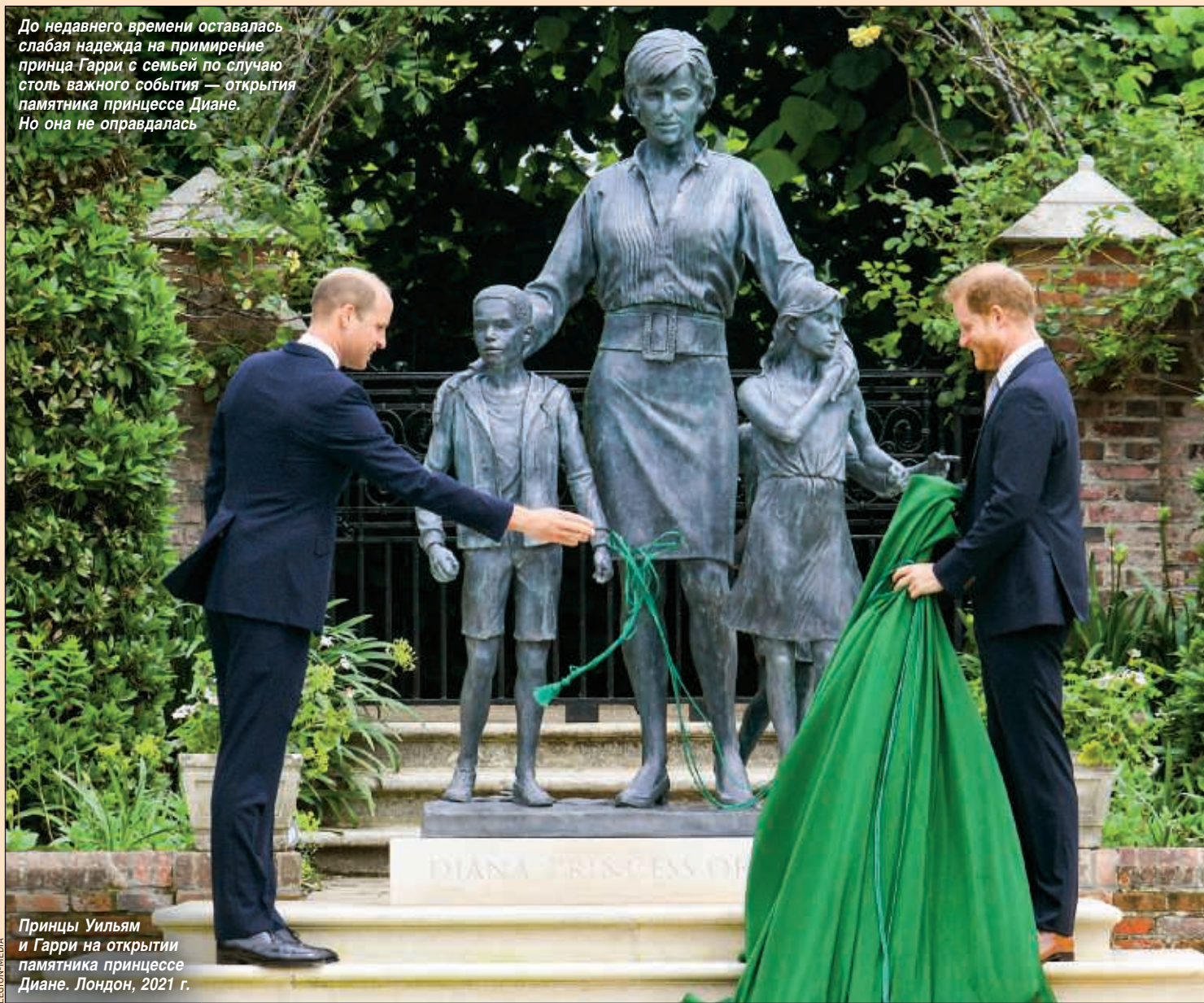
Принцы Уильям и Гарри на открытии памятника принцессе Диане. Лондон, 2021 г.

До недавнего времени оставалась слабая надежда на примирение принца Гарри с семьей по случаю столь важного события — открытия памятника принцессе Диане. Но она не оправдалась