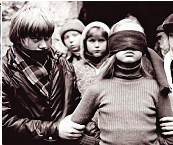
▲ Фильм «Чучело» (1983) рассказывает об издевательствах школьников над одноклассницей