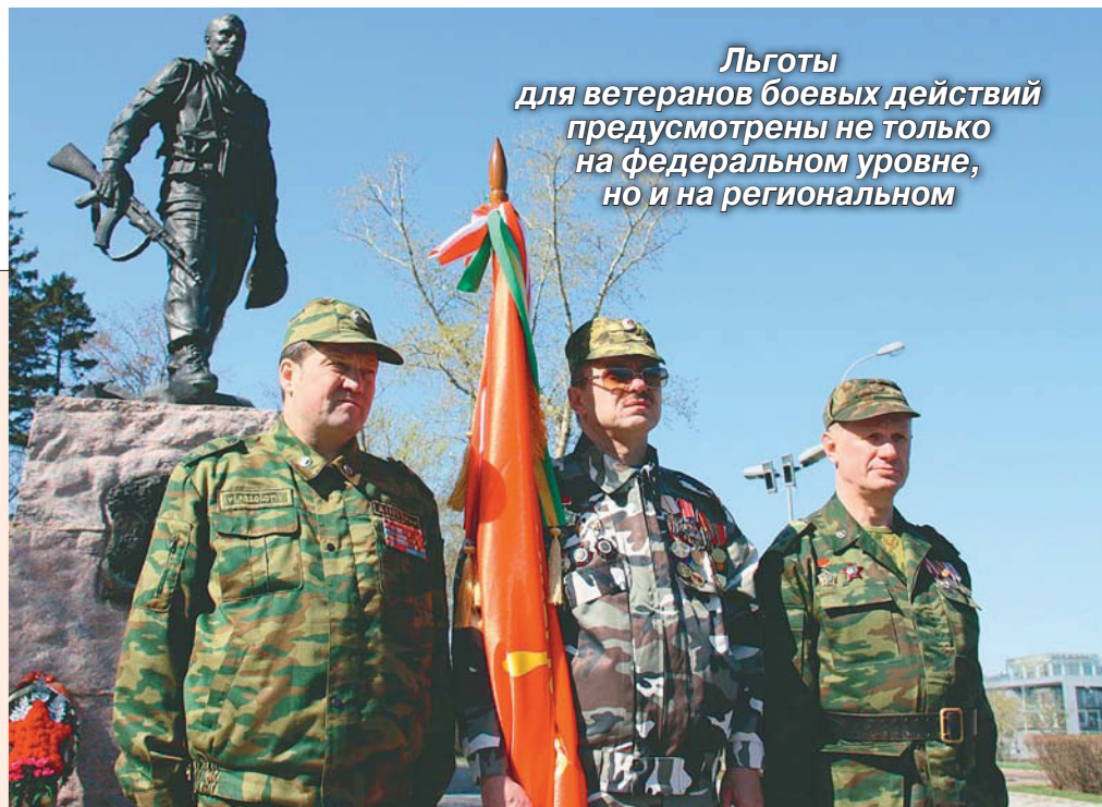
Льготы для ветеранов боевых действий предусмотрены не только на федеральном уровне, но и на региональном

П раво на льготы ветеранам боевых действий возникает только при подтверждении этого статуса. Но получают его не все участники военных конфликтов. Если мирным путем статус вам не дают, идите в суд.