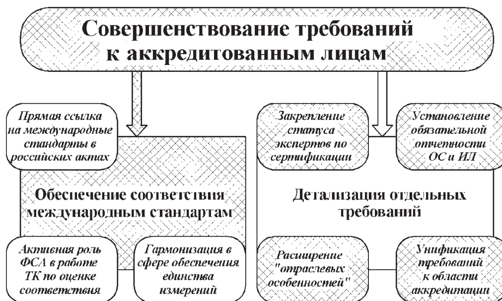
Рис. 1.2. Схема предстоящей работы в области совершенствования требований к аккредитованным лицам:

Второе направление – это дополнительная детализация требований к аккредитованным лицам (рис. 1.2). Основная проблема, которая уже много лет обсуждается, – это проблема закрепления статуса эксперта по сертификации, т. е. сотрудника органа по сертификации, ответственного за выдачу сертификата соответствия. Сегодня есть целый ряд систем добровольной аттестации экспертов по сертификации. Какие требования предъявляются в этих системах к экспертам, как эти системы работают – государство не контролирует. Между тем именно эти эксперты оценивают безопасность товаров и подписывают сертификаты, а значит, должны быть компетентными для выполнения этого вида работ. Требуется ввести государственную процедуру подтверждения компетентности экспертов по сертификации. Существуют разные способы реализовать этот механизм, но лучшей может быть модель аккредитации органов по сертификации персонала, принятой в международной практике.