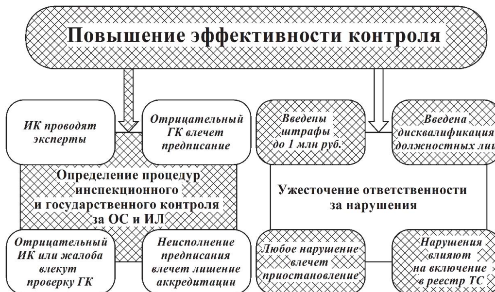
Рис. 1.5. Работа, проделанная в направлении повышения эффективности контроля за деятельностью аккредитованных лиц: ИК – инспекционный контроль; ГК – государственный контроль; реестр ТС – реестр Таможенного союза

сударственного контроля может быть зафиксировано нарушение, может быть выдано предписание и может быть составлен протокол об административном правонарушении. Неисполнение выданного предписания влечет лишение аттестата аккредитации.