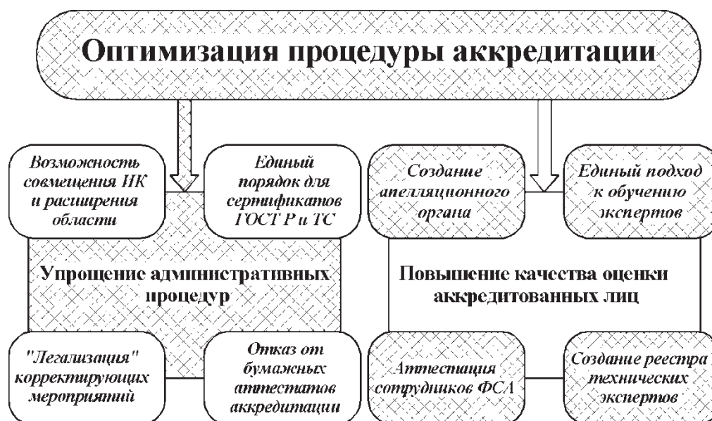
Рис. 1.4. Предстоящая работа по оптимизации процедуры аккредитации: ИК – инспекционный контроль

комплекса по обучению сотрудников Росаккредитации и экспертов по аккредитации. Более того, планируется разместить этот комплекс на сайте и сделать его открытым и бесплатным для всех, кто готов дистанционно обучаться и стать экспертом по аккредитации.