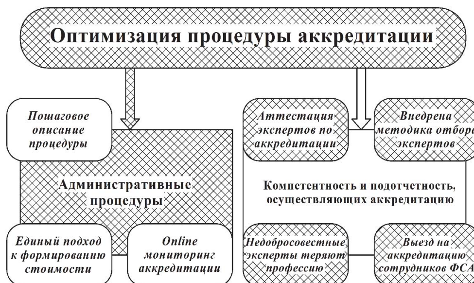
Рис. 1.3. Прделанная работа по оптимизации процедуры аккредитации

Что касается компетентности тех, кто участвует в проведении аккредитации, ключевым фактором стало формирование системы обязательной аттестации экспертов по аккредитации. Была создана также система ответственности за деятельность экспертов: в случае, если Росаккредитация установила факт нарушений со стороны эксперта по аккредитации (в частности, предоставление недостоверной информации о деятельности органа по сертификации или испытательной лаборатории), последний может лишиться статуса эксперта по аккредитации и, следовательно, лишиться профессии за необъективные оценки деятельности аккредитуемых лиц. Кроме того, специалисты Росаккредитации разработали, внедрили и автоматизировали методику отбора экспертов для проведения работ по аккредитации.