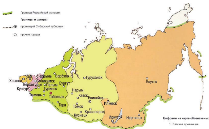
Административно-территориальное устройство. 1727 г.

ды), города (если отдаленные, то комиссарства), пригородки, крепости, остроги, слободы и зимовья. Енисейская провинция существовала до 1775 г. (рис. 1.4).