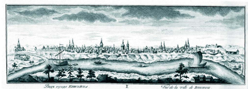
Рис. 1.3. Гравюра Е. Федосеева «Панорама Енисейска» по рис. И.-В. Люрсениуса, 1770 г. 2

Енисейск развивался как транзитный торговый пункт на дороге в Восточную Сибирь. Город рос. В начале XVIII в. в нем насчитывалось 4 000 жителей обоего пола, а в 1761 г. – 825 дворов с населением 6 500 чел. 1 (рис. 1.3).