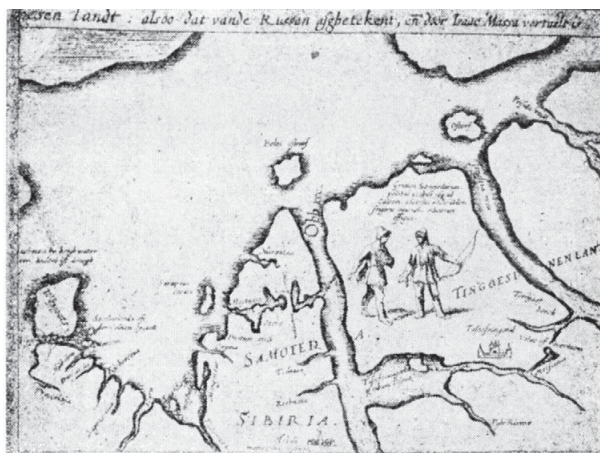
Рис. 1.1. Карта Сибири Исаака Массы, голландского купца, 1604 г. 2

царство «чингисовых потомков», расположенное до конца XVI в. в Датша-Кипчаке (что Российские летописи называли Золотой Ордой), имело территории по реке Иртыш, что в Западной Сибири. Русские землепроходцы ходили за «Большой камень» (Уральские горы) в поисках «мягкой рухляди» (пушнины) еще задолго до Ивана IV Грозного. А в самом начале XVII в. на иностранных картах Сибири уже были показаны низовья и устье реки Енисей (Jeniseiarea), западное побережье полуострова Таймыр с рекой Пятиной (Peisidareca) и Мангазея (Tasoofcoigorod) (рис. 1.1) 1 .