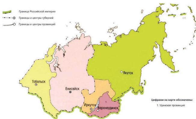
Административно-территориальное устройство. 1775 г.