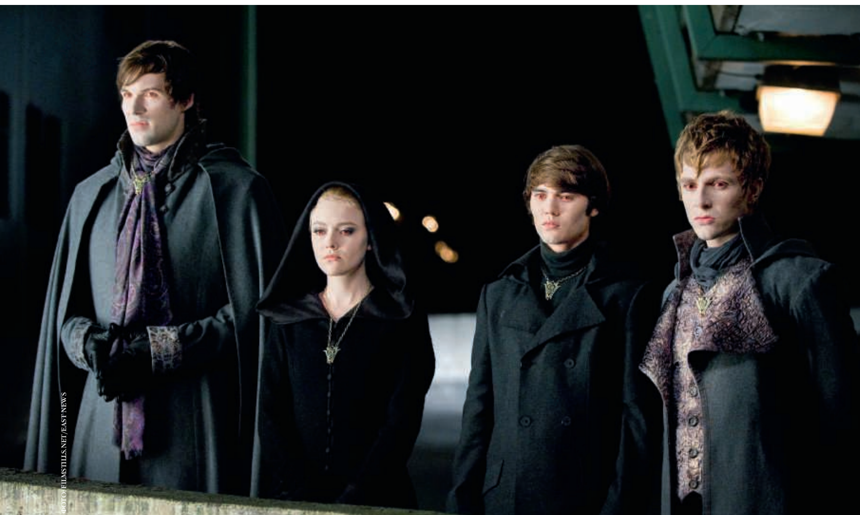
«Сумерки. Сага. Затмение», 2010 год