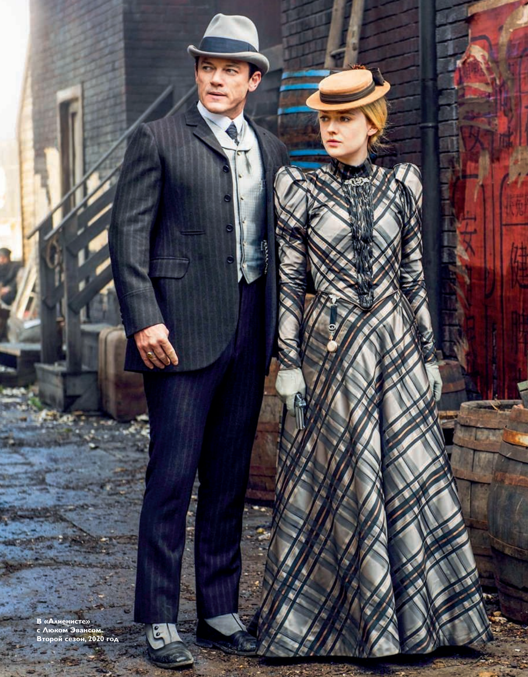
В «Алиенисте» с Люком Эвансом. Второй сезон, 2020 год