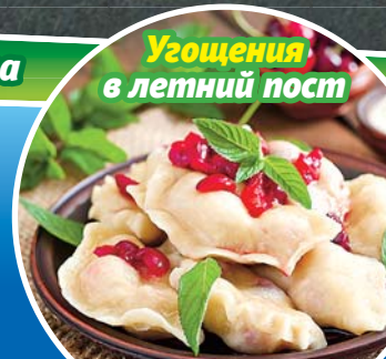
Угощения в летний пост