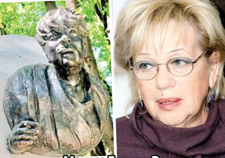
Могила Галины Волчек