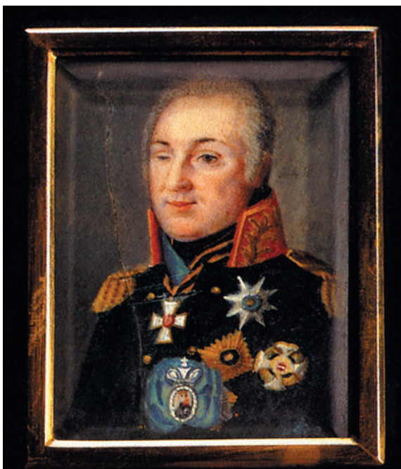
М.И. Кутузов. Миниатюра по гравюре Ф. Боллингера с оригинала Г. Розентреттера. 1-я четверть XIX в.

гие линейные полки превзошли основы егерского учения.