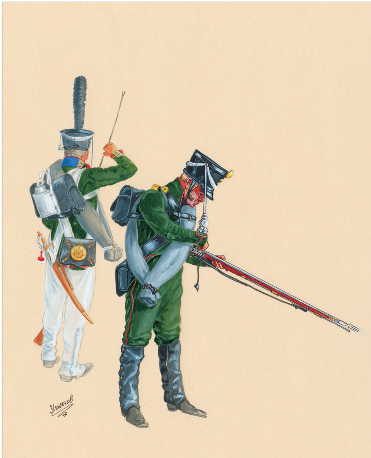
Рядовой 3-й гренадерской роты лейб-гвардии Семеновского полка. Стрелок 1-й гренадерской роты первого по старшинству егерского полка дивизии.