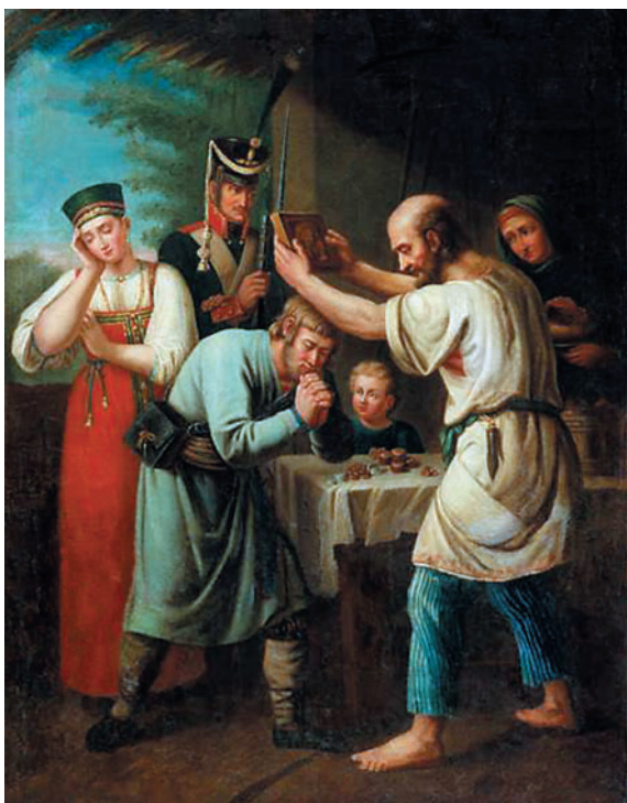
Благословение ополченца 1812 года. И.В. Лучанинов. 1812 г.

ность распространялась на все податные сословия. Как правило, при объявлении набора указывалось, в каких губерниях и сколько рекрутов нужно было собрать. Так, во время 83-го набора брали по 5 рекрутов с 500 душ, во время 84-го набора — по 8 рекрутов с 500 душ. Помимо этих основных наборов, в 1812 г. был проведен и целый ряд дополнительных, причем требования при приеме рекрутов были существенно снижены. Возраст принимаемых людей в 1812 г. колебался в широких пределах — от 18 (в реальности от 17) лет до 40. Обычная ростовая планка в 2 аршина 4 вершка к 83-му набору снизилась до 2 аршин 2 вершков.