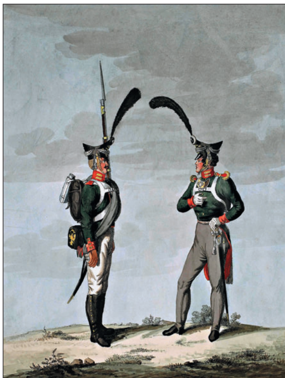
Обер-офицер и гренадер лейб-гвардии Преображенского полка. И. Каппи. 1815 г.