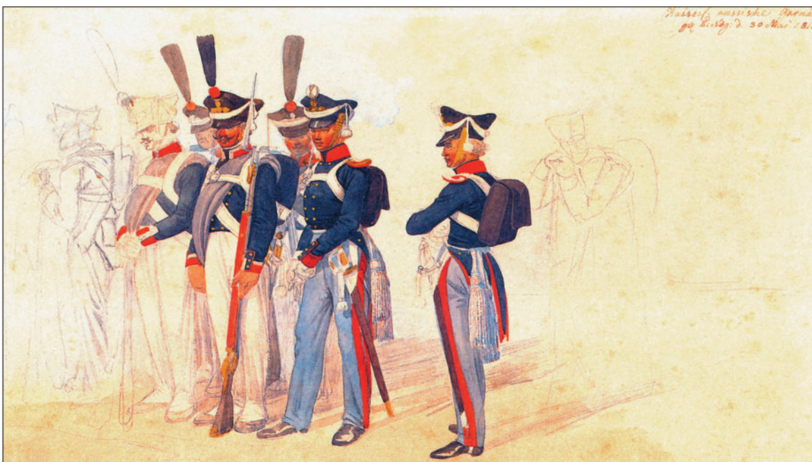
Гренадеры, унтер-офицер и обер-офицеры гренадерской роты. И.А. Клейн. 1815 г. Городской исторический музей г. Нюрнберга. Германия.

Практически все полки полевой пехоты имели общую структуру: полк делился на 3 батальона, батальон — на 4 роты. С 12 октября 1810 г. три батальона полка получили единообразную организацию: каждый батальон теперь состоял из одной гренадерской роты и трех рот, называемых во Франции «центральными» (в гренадерских полках это были фузилерные роты, в пехотных — мушкетерские, в егерских — егерские). В строю батальона взводы гренадерской роты — гренадерский и стрелковый — вставали на флангах, три остальные роты размещались между ними. Первый и третий батальоны считались действующими, а второй — запасным (в поход выступала только его гренадерская рота, а три остальные, выслав