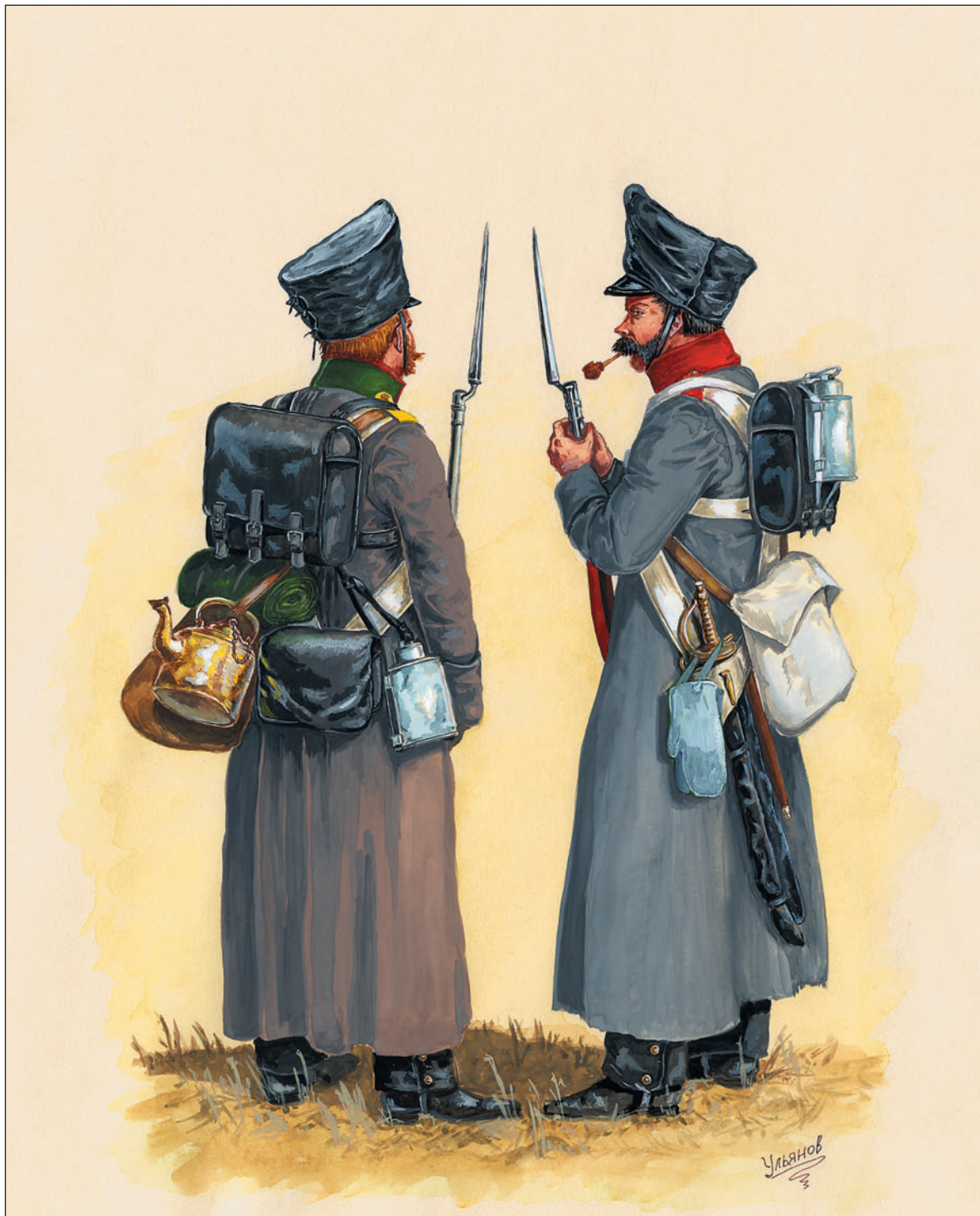
Гренадер линейной пехоты. Солдат первого по старшинству егерского полка дивизии. Кивер и патронная сума закрыты клеенчатыми чехлами. У солдата зачехлены кивер и ножны тесака (к которым также подвязан чехол с султаном). С тесака снят темляк, а на ручку повешены рукавицы шинельного сукна.