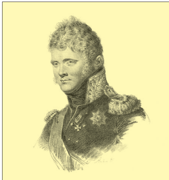
Император Александр I Рисунок Луи де Сент-Обена. 1812–15 гг.

тельно низкорослых и подвижных солдат. В целом к 1812 г. функциональные особенности видов пехоты в известной степени нивелировались: если егерские части изначально изучали правила сомкнутого строя, то и мно-