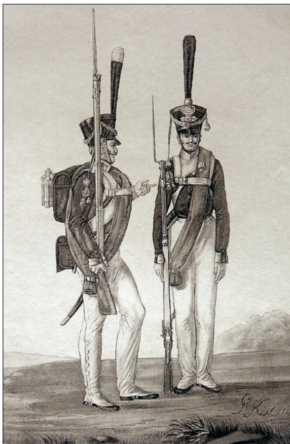
Унтер-офицер и гренадер гренадерского полка. Л.И. Киль. 1815 г.

поведением. Рост имел значение лишь при разделении самой гренадерской роты: высокие солдаты комплектовали гренадерский взвод, низкорослые — стрелковый. Офицерам предписывалось обращаться к военнослужащим отборных рот, используя термины «гренадер» или «стрелок», оставляя обезличенные обращения «солдат» или «рядовой» («рядовой») для нижних чинов «рот центра».