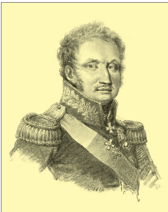
Князь П.Х. Витгенштейн. Рисунок Луи де Сент-Обена. 1812–15 гг.

ка. Сводные батальоны не формировались в приграничных (6, 19, 20, 21, 25-я) и в воевавших с Турцией (8, 10, 13, 16, 22-я) дивизиях.