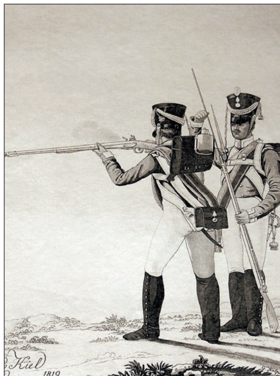
Егерь и унтер-офицер егерского полка. Л.И. Киль. 1815 г.

воротника составляла от 1\frac{3}{4} до 2 вершков, застегивался воротник на 3 крючка. Длина фалд кафтана — 9 вершков, ширина нижнего среза — 2\frac{3}{4} вершка.