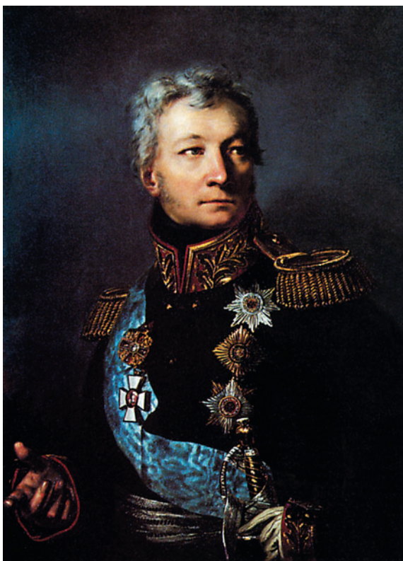
Генерал от кавалерии, граф А.П. Тормасов

34-го полка — в 4-й, 36-го полка — в 11-й, 40-го полка — в 19-й, 41-го полка — в 6-й, 42-го полка — в 5-й, 50-го полка — в 49-й. При этом ряд оставшихся полков были рассчитаны на 3 батальона. В конце ноября такая же процедура последовала и в отношении линейной пехоты. В распоряжении М.И.Кутузова говорилось: «В каждой пехотной дивизии из 4 пехотных полков один слабейший обратить на укомплектование остальных полков той же дивизии, то есть 3 пехотных и 1-го (одного. — И.У.) Егерского» [149, с. 200].