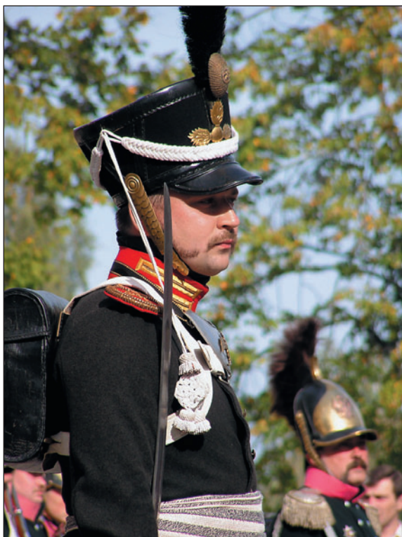
И.Э. Ульянов в форме поручика Московского гренадерского полка. 1812. Реконструкция.

Офицерский корпус армии преимущественно комплектовался представителями потомственного дворянства. Дворяне, добровольно вступая в армию сразу в унтер-офицерском чине, должны были прослужить 3 года для получения первого офицерского звания, хотя в ряде случаев этот срок менялся.