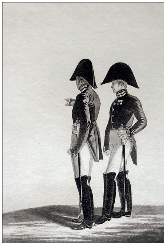
Военные медики. Л.И. Киль. 1816 г.

Аудитор вел судебное делопроизводство, а также заведовал полковым обозом; в его подчинении находились профосы, исполняющие полицейские обязанности, вагенмейстер унтер-офицерского чина, коновал, кузнецы, плотники и фурлейты. Медицинская часть состояла из штаб-лекаря, батальонных лекарей, фельдшеров и цирюльников. За полковым лазаретом следил надзиратель больных и лазаретные служители. Оружейный и ложенной мастера с учениками осуществляли мелкий ремонт оружия.