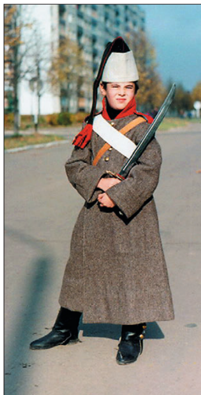
«Флейтщик» Московского гренадерского полка. Реконструкция.

10 сентября 1811 г. при внутренних гарнизонных батальонах в Петрозаводске, Новгоро-