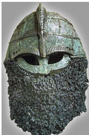
Шлем скандинавского воина VI в. из могильника Вальсарде — классический богат украшенный шлем вендельского времени

ми. По-видимому, проникновение славян в глубину финского мира происходило мирно, а если какие-то войны и имели место, то в такое время, от которого не сохранилось даже устных преданий. Конечно, отдельные конфликты могли иметь место и, вероятно, случались. И меряне (жители Верхнего Поволжья), и приладожская весь были воинственными народами, которые охотно приобретали импортное оружие, в том числе скандинавское, и, несомненно, при удобном случае пускали это оружие в ход.