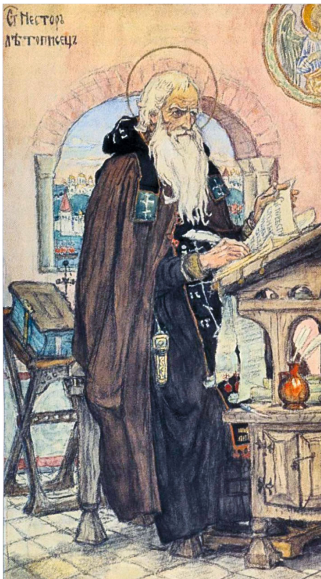
В. М. Васнецов. Нестор-летописец. Нестор был одним из редакторов «Повести временных лет», он работал над нашей летописью во второй половине XI столетия

славянам удалось прорваться в глубину империи — на полуостров Пелопоннес, и осесть там.