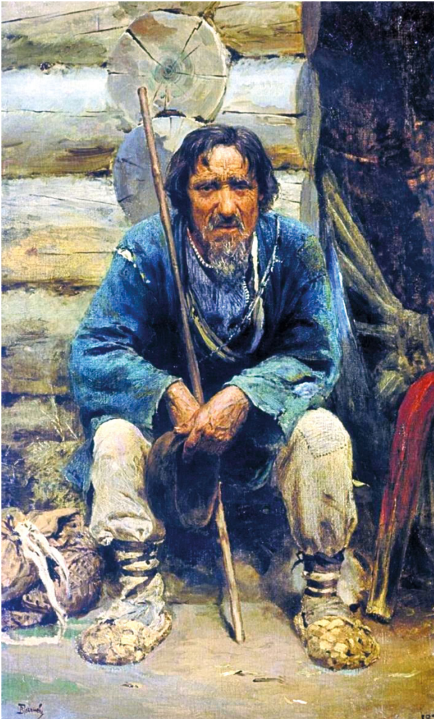
В. Д. Поленов. Портрет сказителя былин Никиты Богданова. Со слов таких сказителей, живших на Урале и Русском Севере, ученые на протяжении XIX и первой половины XX века записывали былины. В наши дни живая традиция исполнения героических песен почти исчезла

Нашим предкам пришлось впитать ратную науку самых разных народов. Мы увидим, как Русь училась воевать на заре своей истории — в IX–XI столетиях.