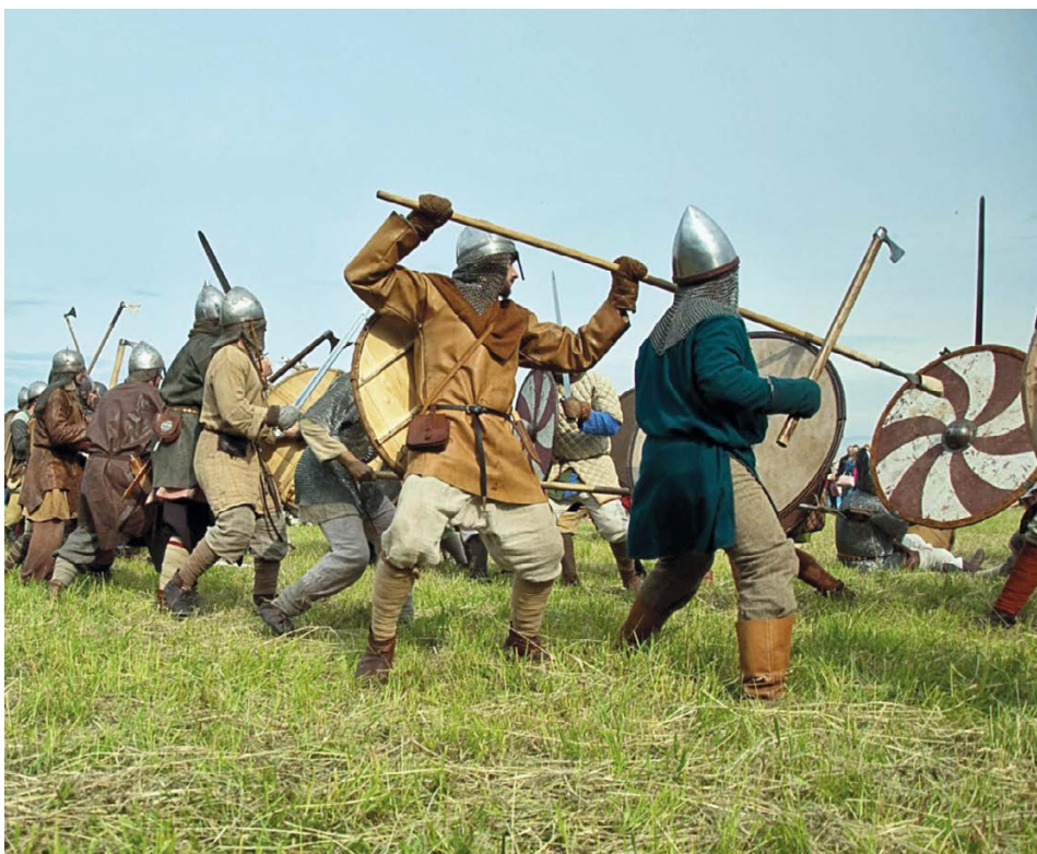
Строевое сражение в поле. По описаниям византийцев, именно таких сражений славяне старались избегать... Тактика строя появилась, по-видимому, в более позднее время. Фестиваль «Первая столица Руси-2011» (Старая Ладога).

«Пребывающих у них в плену они не держат в рабстве неопределенное время, как остальные племена, но, определив для них точный срок, предоставляют на их усмотрение: либо они пожелают вернуться домой за некий выкуп, либо останутся там как свободные люди и друзья».