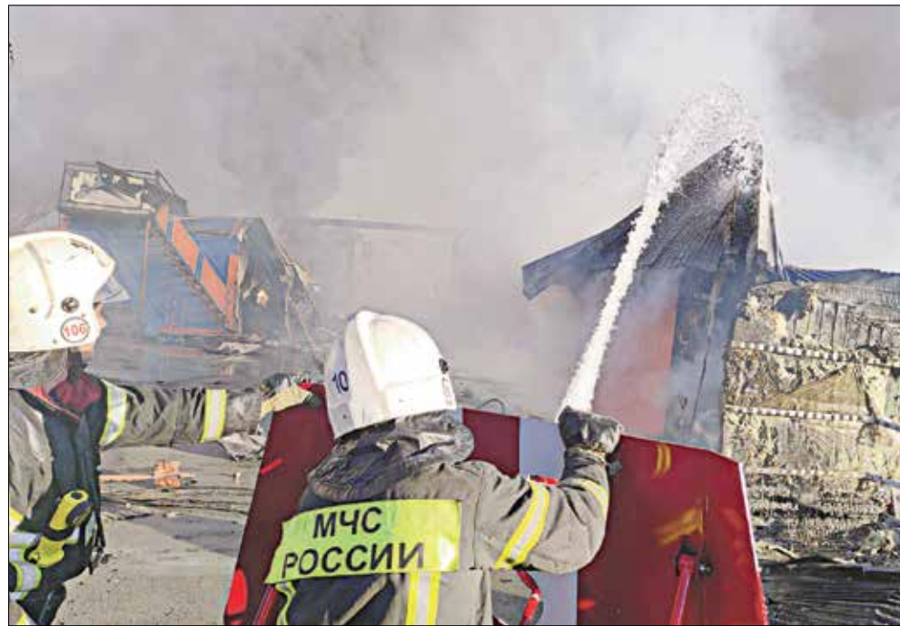
В 21:03 по местному времени пожарные ликвидировали открытое горение на АЗС на Гусинобродском шоссе.

Чрезвычайное происшествие стало главным вопросом повестки дня на оперативном совещании, которое провел губернатор Новосибирской области Андрей Травников. Глава региона подчеркнул, что период пандемийных надзорных каникул некоторые предприниматели восприняли как сезон бесхозяйственности и безответственности по отношению к своему делу, к своим сотрудникам и вообще к окружающим людям.