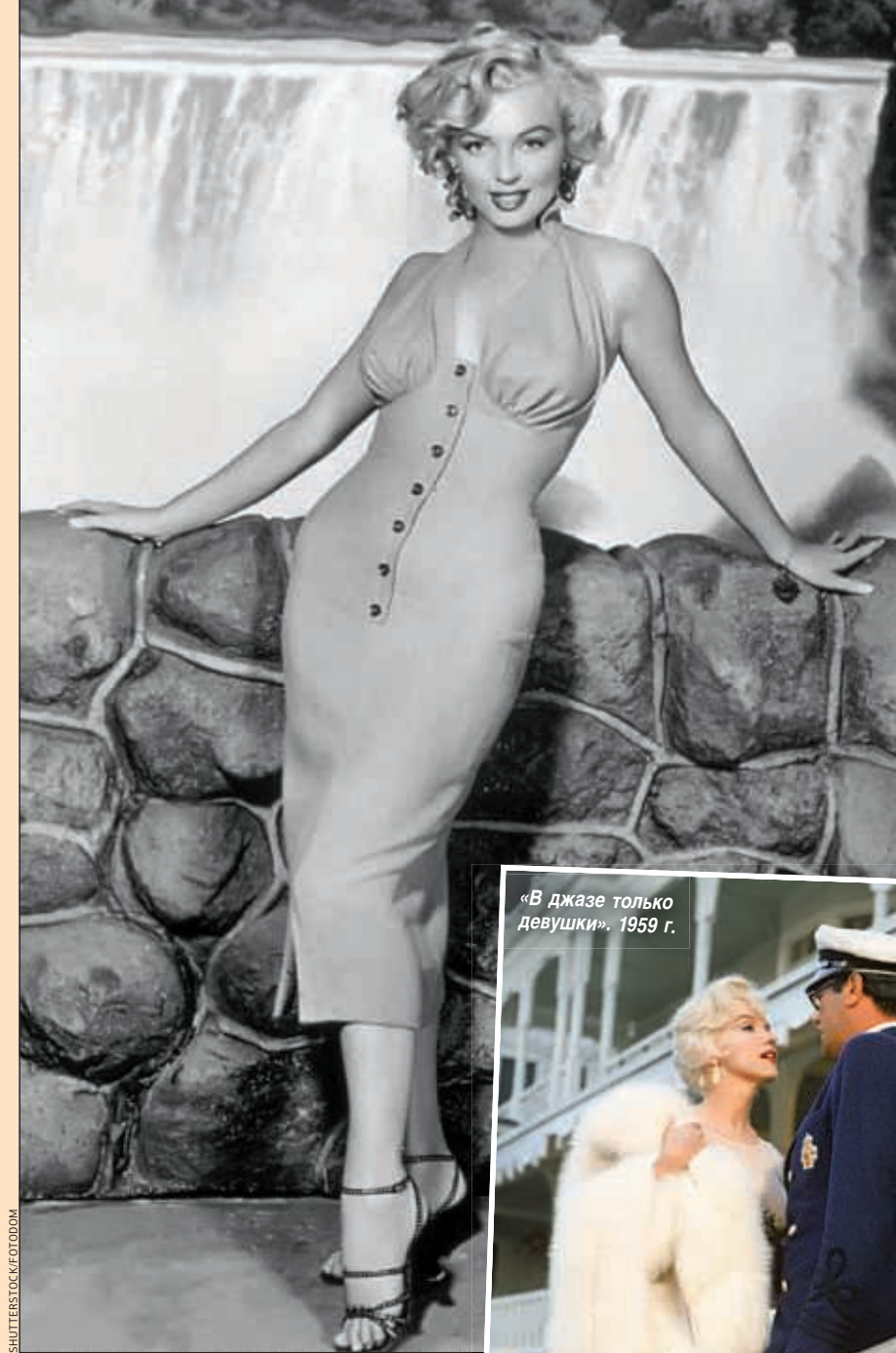
«В джазе только девушки». 1959 г.

Почти все личные вещи Мэрилин достались ее близкому другу — Ли Страсбергу. Только после его ухода в 1982 году в прессу попали записи актрисы, сделанные на ресторанных меню и гостиничных счетах. Среди них есть описание ее сна: «Меня разрезали, но