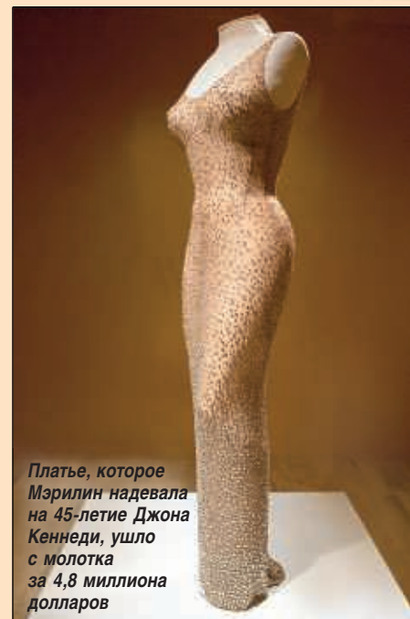
Платье, которое Мэрилин надевала на 45-летие Джона Кеннеди, ушло с молотка за 4,8 миллиона долларов