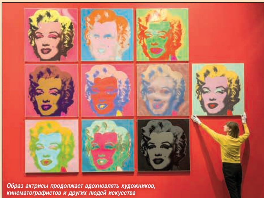
Образ актрисы продолжает вдохновлять художников, кинематографистов и других людей искусства