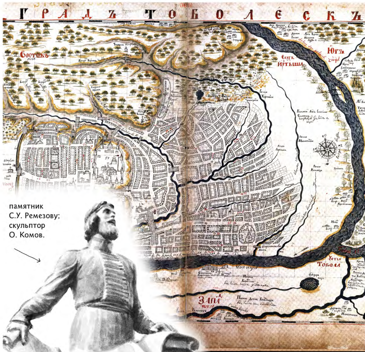
памятник С.У. Ремезову; скульптор О. Комов.