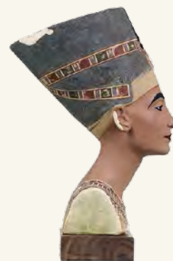
Нефертити Staatliche Museen Preussischer Kulturbesitz (Ägyptisches Museum und Papyrussammlung), Берлин

Создание хурритскими и семитскими племенами государства Митанни (Ханигальбат) (1560–1260 гг. до н. э.) со столицей в Вашшуканни. Митаннийцы занимались коневодством и владели усовершенствованной техникой изготовления колесниц, что давало воинам преимущества в бою. Благодаря этому в 1500–1300 гг. до н. э. границы Митанни быстро расширились. Цари Митанни, в отличие от хурритов и семитов, были индоарийцами, вели войны с Хеттским царством, занимавшим обширную территорию в Малой Азии, и заключили союз с Древним Египтом. Союз между Митанни и Древним Египтом скреплялся междинастическими браками. По одной из версий, египетская царица Нефертити, жена фараона Эхнатона (Аменхотеп IV), родом из Митанни.