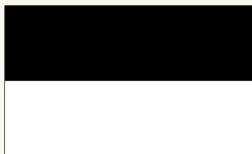
Флаг эмирата Соран (1816–1835)

Восстание Мира Сулеймана Бабе в юго-восточном Курдистане (Бабане) против Персидской и Османской империй.