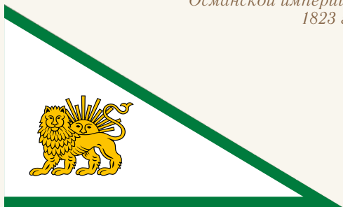
Флаг династии Зенд

Курдистан в составе Османской империи. 1823 г.