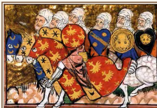
Армия Салах-ад-дина (Айюбиды). Иллюстрация из манускрипта 1337 г.