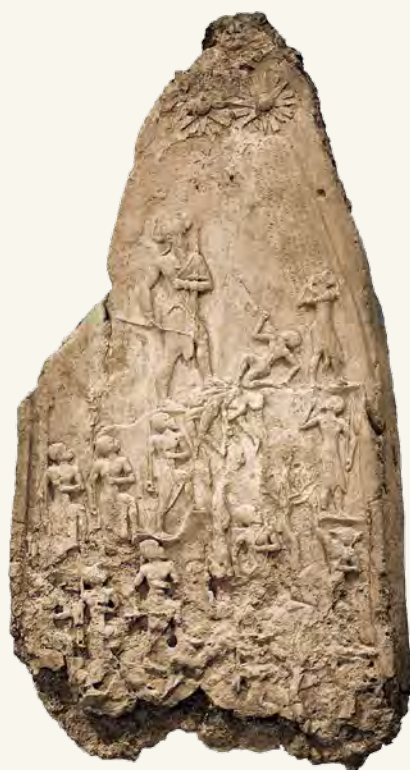
Стела «Победа Нарам-Суэна над луллубеями». Ок. XXIII в. до н. э. Коллекция Лувра

В пределах Загроса и Тавра, в долинах Месопотамии и Иранского нагорья живут хурриты, язык которых принадлежал, предположительно, к северо-восточной группе кавказской семьи языков. Хурритские элементы остались в названиях курдских племен современного Курдистана, но прямыми предками курдов хурриты считаться не могут.