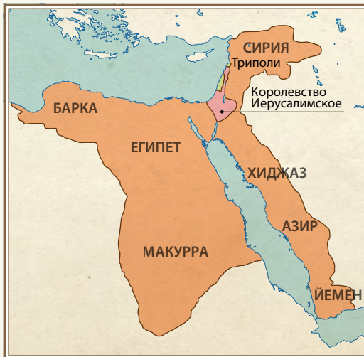
Арабский халифат под властью Салах-ад-дина

Салах-ад-дин из династии Айюбидов становится султаном Египта и Сирии.