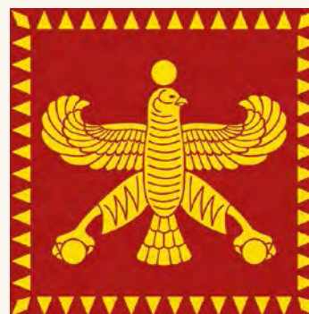
Флаг царя Кира II из династии Ахеменидов