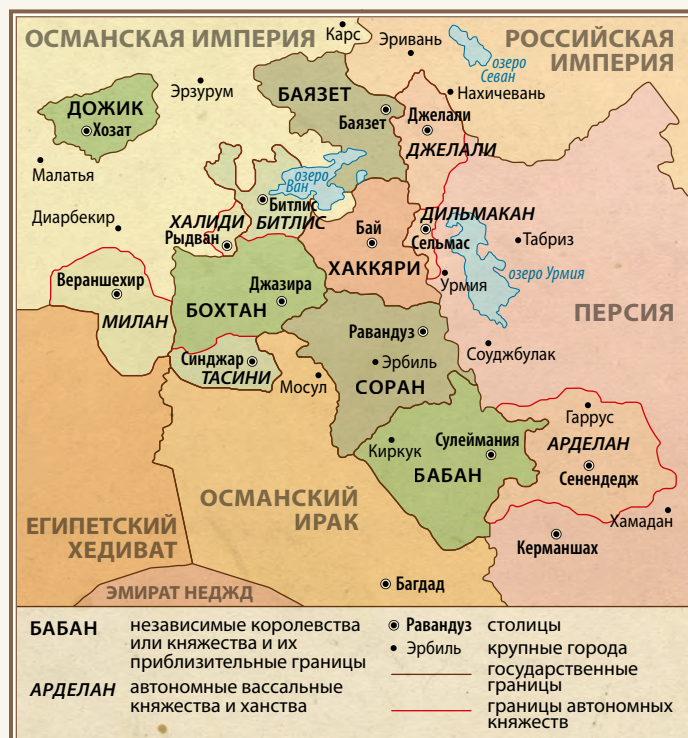
Курдские княжества в 1835 г.

Ликвидация независимости княжества Соран.