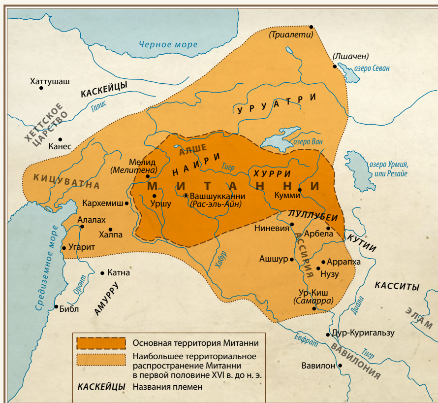
Митанни в XVI в. до н. э.