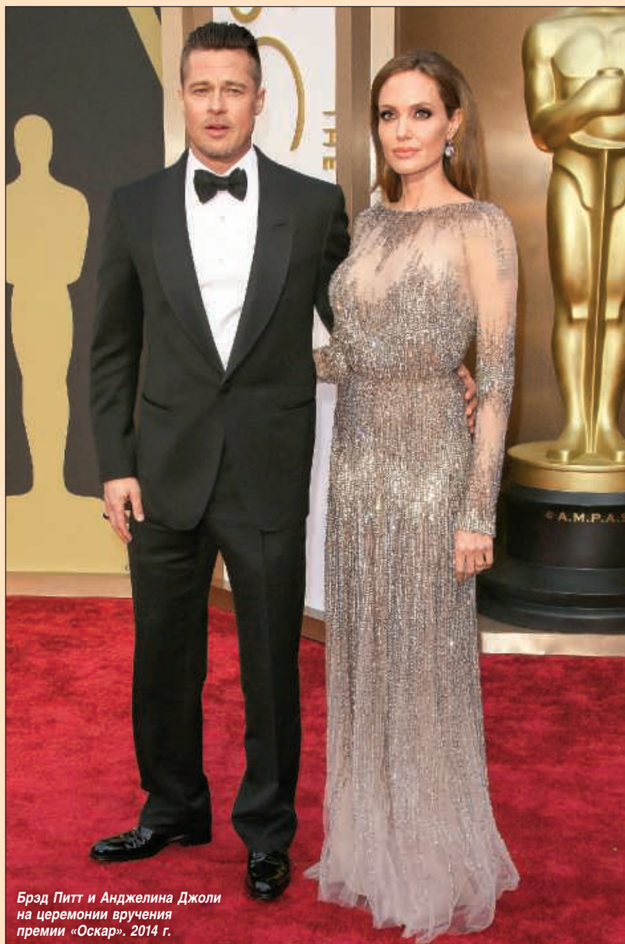
Брэд Питт и Анджелина Джоли на церемонии вручения премии «Оскар». 2014 г.