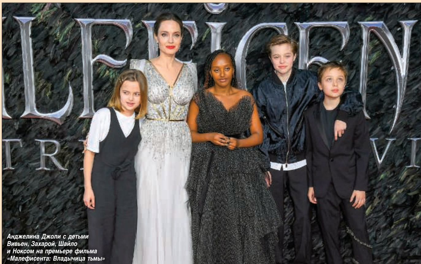
Анджелина Джоли с детьми Вивьен, Захарой, Шайло и Ноксом на премьере фильма «Малефисента: Владычица тьмы»