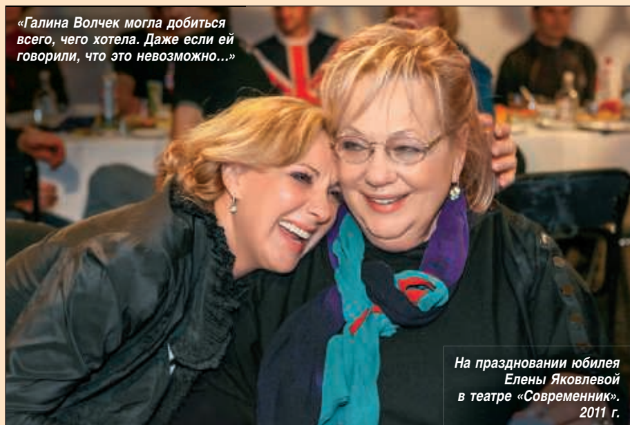
На праздновании юбилея Елены Яковлевой в театре «Современник». 2011 г.

«Галина Волчек могла добиться всего, чего хотела. Даже если ей говорили, что это невозможно...»