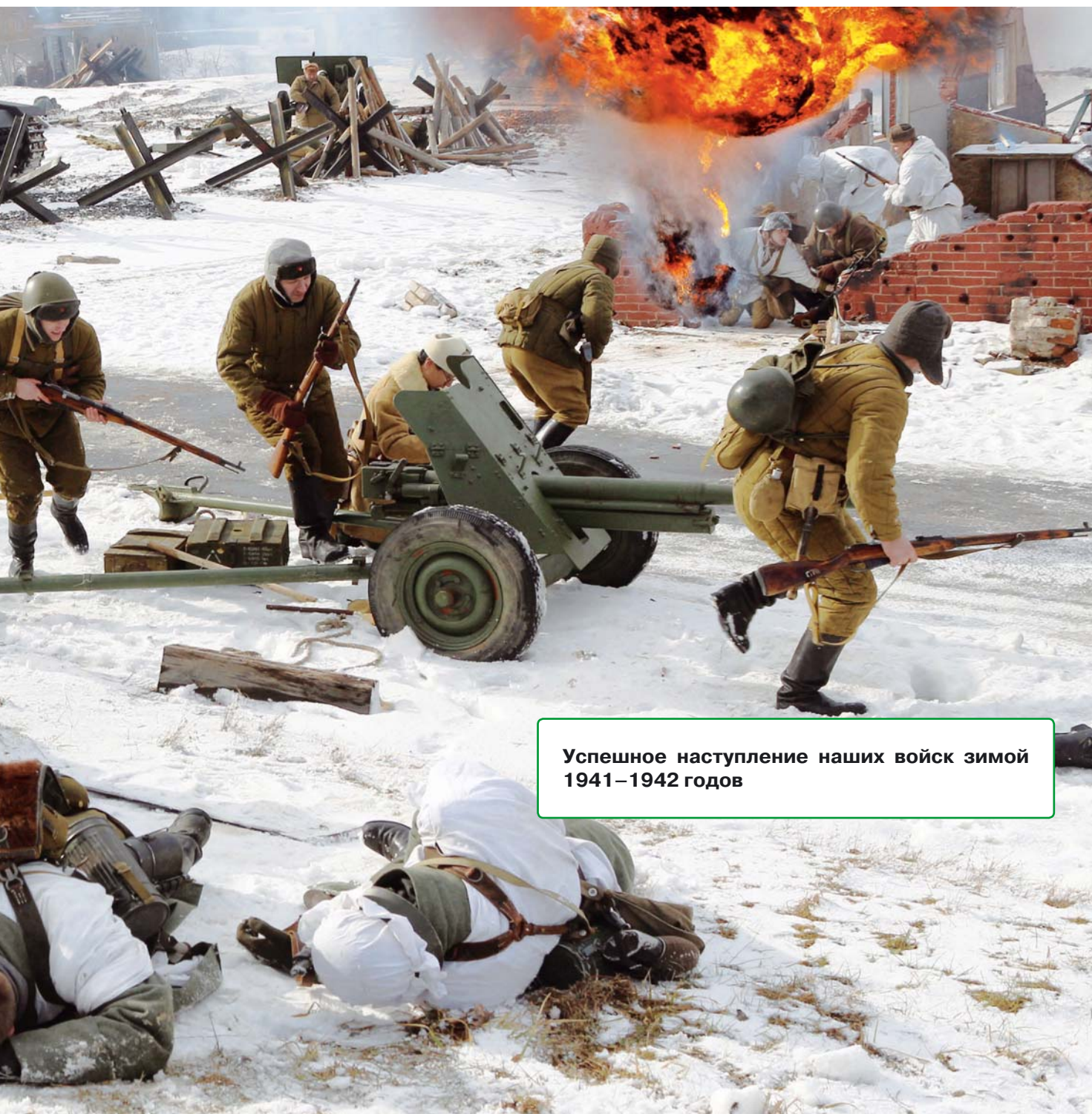
Успешное наступление наших войск зимой 1941–1942 годов

крупных победах, просили резервов и обещали успех операций. Несмотря на то, что военные заводы не могли дать нужного количества техники и вооружений, полководцы настаивали на наступлениях. Подведя итог совещания, Сталин утвердил план всеобщего наступления: «Мы должны быстро разбить немцев, чтобы они сами не смогли наступать, когда придёт весна».