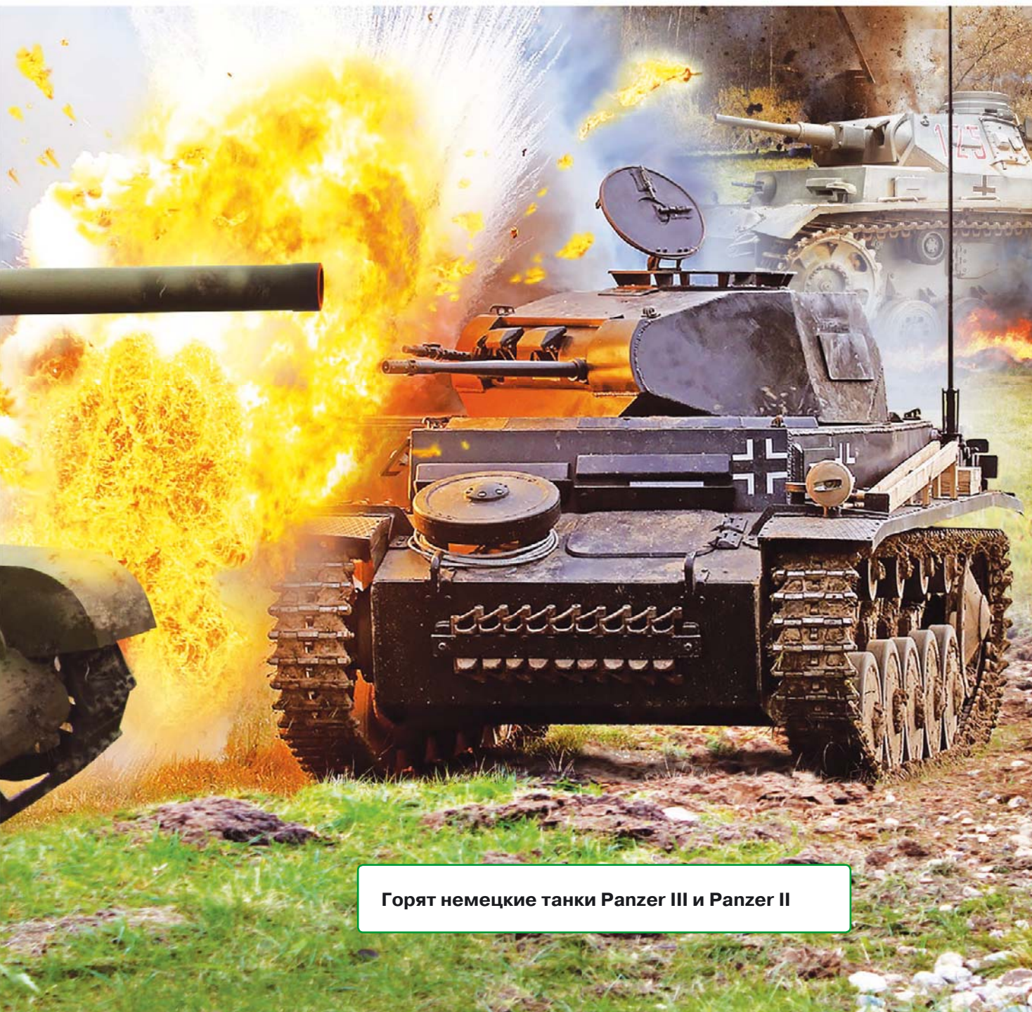
Горят немецкие танки Panzer III и Panzer II