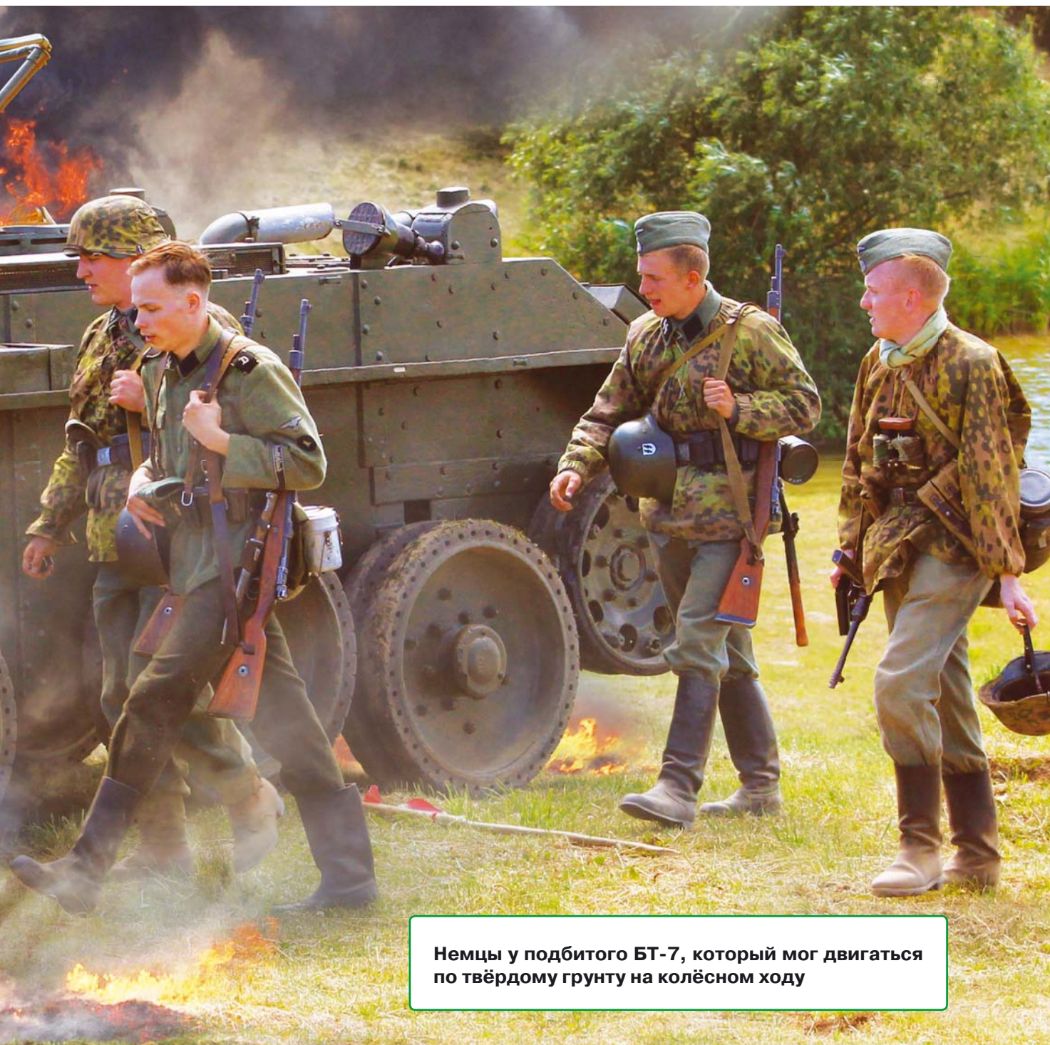
Немцы у подбитого БТ-7, который мог двигаться по твёрдому грунту на колёсном ходу

Лишь части войск при поддержке сводной танковой группы генерала Кузьмина удалось пробиться к своим. В окружении погибло до 200 тысяч бойцов и 10 генералов.