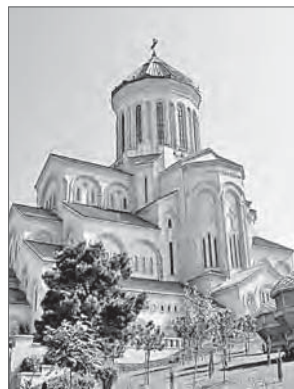
Собор Святой Троицы (Самеба) в Тбилиси

Самые ранние христианские постройки на территории современной Болгарии относятся к IV–VII векам. В этот период в болгарской церковной архитектуре наиболее распространенным был тип трехнефной базилики с полукруглой апсидой в восточной части. В последующие века преобладающим становится крестовокупольный храм. К числу характерных особенностей болгарской архитектуры до X века включительно относится наличие пастофорий 46 , боковых конх, пристроек с востока и запада, башен на западном фасаде, двора с южной стороны, объединение нескольких нефов под общей крышей 47 .