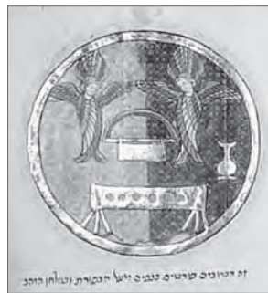
Принадлежности скинии Книжная миниатюра. XII в.

Скиния неоднократно переносилась с одного места на другое до тех пор, пока при царе Давиде она не была водворена в Иерусалиме, превращенном в главный духовный и политический центр еврейского государства. Теперь, когда странствия евреев закончились и они получили в удел землю обетованную, надлежало вместо походного храма из брусьев и ткани построить каменный храм. Эта мысль появилась у царя Давида, однако Бог не благоволил, чтобы строительство храма осуществил он (см.: 2 Цар 7, 1–17). Храм был построен при его сыне Соломоне.