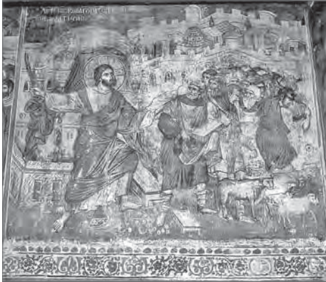
Христос изгоняет торгующих из храма Собор Протата в Карее. Афон. XIII в.

времен Иисуса Христа, и Сам Иисус в этом плане мало отличался от Своих соплеменников.