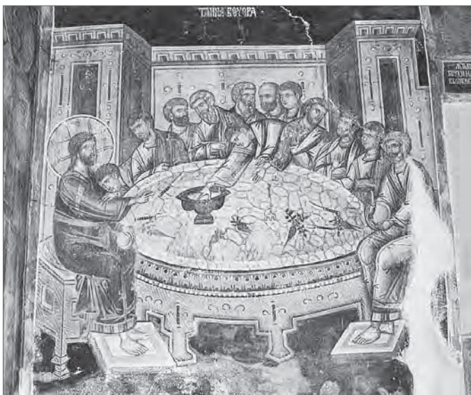
Тайная Вечеря Фреска. Монастырь Студеница. Сербия. XIII в.

У раннехристианской общины не сразу появились свои культовые здания. Христос совершил Тайную Вечерю в обычном жилом доме, в горнице большой, устланной, готовой (см.: Мк 14, 15; Лк 22, 12). Местами христианских евхаристических собраний после воскресения Христа также были горницы — комнаты в частных домах (см.: Деян 1, 13). Преломляя по домам хлеб, христиане принимали пищу в веселии и простоте сердца (Деян 2, 46). Этот домашний, частный, семейный характер первохристианских евхаристических собра-