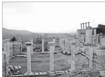
Руины храма Апостола Иоанна в Ефесе

Были проведены две прямые линии, посередине пересекающиеся друг с другом наподобие креста; первая прямая шла с востока на запад, пересекающая ее вторая линия была обращена с севера на юг. Огражденные извне по периферии стенами, внутри, и наверху и внизу, они были