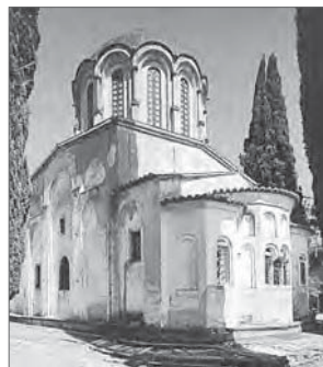
Церковь монастыря Неа-Мони

Возрождение интереса к крестово-купольной архитектуре византийского образца наблюдается в течение всего XX века. Крупнейший греческий архитектор Г. Номикос построил более 200 церквей в неовизантийском стиле, в том числе множество крестово-купольных храмов и купольных базилик. Одним из наиболее известных творений архитектора является собор Святого Нектария Эгинского на о. Эгина (1973–1994), задуманный как уменьшенная копия константинопольской Софии.