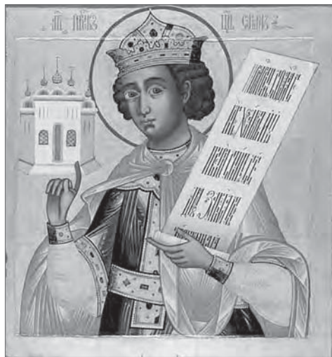
Пророк царь Соломон Икона из Преображенской церкви Спасо-Кижского погоста. Нач. XVIII в.

Несмотря на ту исключительную важность, которую в ветхом Израиле придавали храму и сопряженному с ним культу жертвоприношений, ни храм, ни культ не могли сами по себе очищать и освящать человека, если он не отказывался от злых дел и идолопоклонства, не исполнял заповеди и законы Божии. Об этом неустанно напоминали пророки: