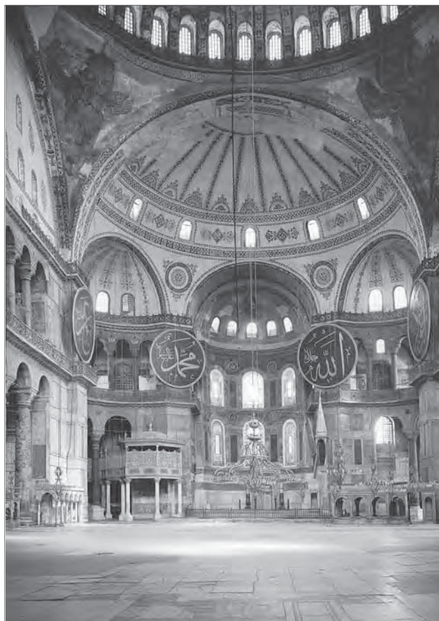
Внутреннее убранство храма Святой Софии

храма Святой Софии можно судить лишь весьма приблизительно, так как иконоборцы уничтожили многие первоначальные мозаичные изображения. Изготовленные заново в послеиконоборческую эпоху (IX–XII вв.), мозаики Святой Софии были в большинстве своем уничтожены турками после превращения храма в мечеть в 1453 году. Лишь некоторые мозаичные изображения, оказавшиеся под толстым слоем штукатурки, уцелели и были раскрыты в XIX веке.