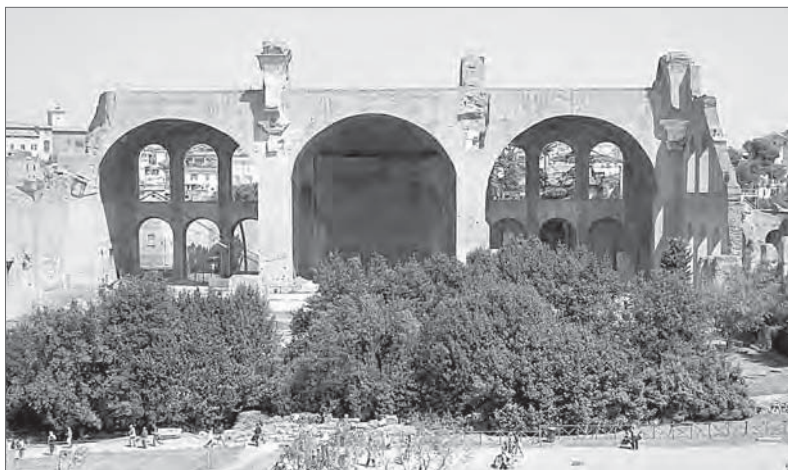
Базилика Максенция- Константина

Использование светских построек для христианского богослужения было широко распространено в эпоху гонений. Однако уже в этот период появляются и первые здания, построенные