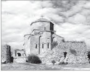
Церковь монастыря Джвари

распространялось восточное (православное) христианство. Генетическая связь с Византией сохранялась, в частности, в церковной архитектуре Грузии и Балкан.