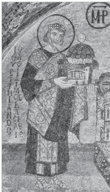
Император Юстиниан предстает Богородице с моделью храма Святой Софии в руках

Мозаика. Храм Святой Софии в Константинополе