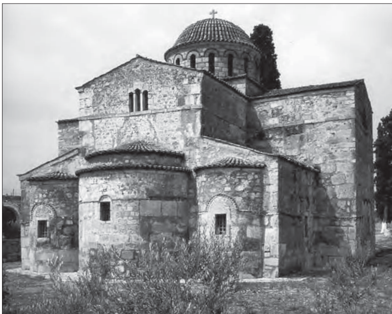
Церковь Успения Божией Матери Охромена. Греция. IX в.

В современном православном словоупотреблении храмом, или церковью 3 , называется здание, предназначенное для совершения богослужений, таинств и обрядов.