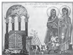
Процветший жезл Ааронов. Моисей и Аарон в скинии откровения Книжная миниатюра. XIII в.

У древних евреев во времена патриархов не было особых зданий для богослужения. Этим евреи отличались от языческих народов, в частности от египтян, у которых существовала широко развитая храмовая архитектура. У евреев были, однако, священные места, связанные с явлениями Бога человеку (см.: Быт 32, 30). Такие места могли обозначаться памятниками в виде камня, на который возливали елей (см.: Быт 28, 18–22). В местах явлений Божиих устраивались жертвенники (см.: Быт 12, 8; 26, 25), представлявшие собой груду неотесанных камней для разжигания костра под открытым небом. Жертвенники устраивались также на новоприобретенных участках земли (см.: Быт 8, 20; 33, 20).