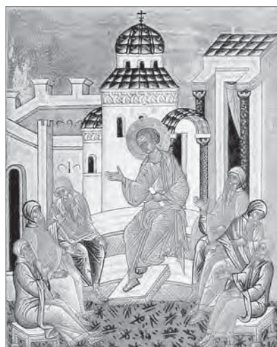
Отрок Иисус в храме «Таблетка». Новгород. Кон. XV–нач. XVI в.

Обычай ежегодного посещения храма в праздник Пасхи Христос сохраняет на протяжении всей Своей земной жизни. Кроме того, согласно Евангелию, обычаем Иисуса было посещать синагогу по субботам (Лк 4, 16: вошел, по обыкновению Своему, в день субботний в синагогу ). Посещение синагоги в субботу и храма на Пасху было основой молитвенной жизни благочестивого иудея