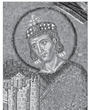
Константин Великий приносит город в дар Христу Храм Святой Софии в Константинополе. Мозаика

Однако подлинный «бум» христианского строительного искусства начался не после миланского эдикта, а после 381 года, когда было окончательно побеждено арианство. Именно в конце IV века, при императоре Феодосии, сооружение базилик приобрело массовый характер, «их начали строить во всех городах всех провинций, иногда группами по две или несколько, если речь шла о епископских кафедрах, местах паломничества, монастырях или наиболее