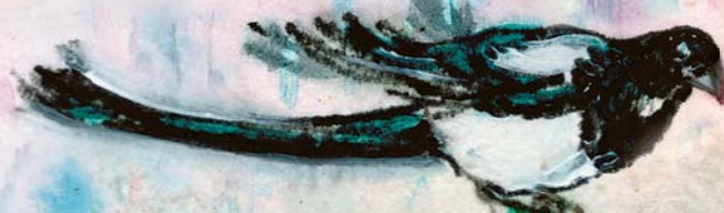
Рис. художника Елены Болговой