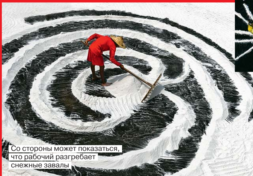
Со стороны может показаться, что рабочий разгребаёт снежные завалы