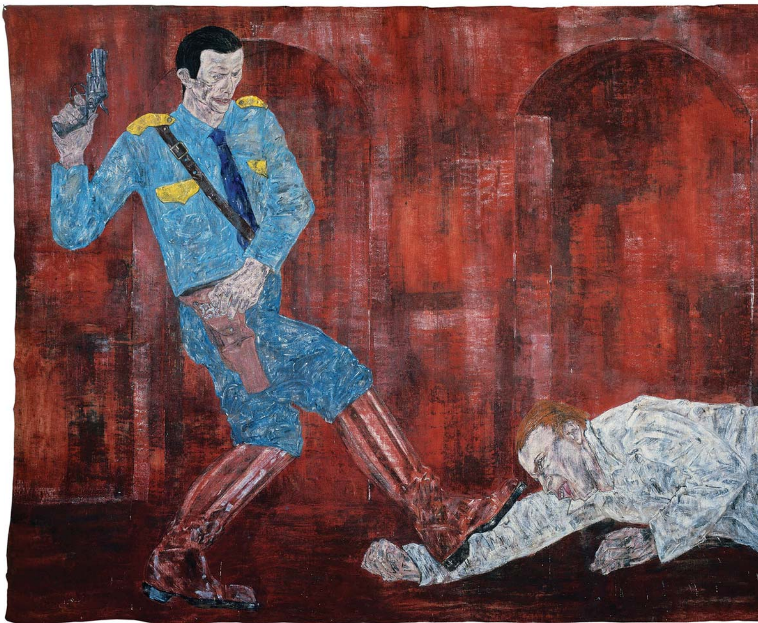
Леон Голуб White Squad V . 1984 Холст, акрил

На протяжении всей своей почти шестидесятилетней карьеры художник исследовал травму социального насилия, зачастую выраженную через ужасные и шокирующие образы. Он считал значимым лишь то искусство, которое способно установить связь с событиями, искажающими человеческую этику и культуру. White Squad V — это одна из семи картин, созданных в начале 1980-х годов в ответ на действия сальвадорских эскадронов смерти, которые в то время привлекли большое внимание международных СМИ. Военизированные формирования совершили подавляющее большинство казней и массовых убийств во время гражданской войны и были тесно связаны с правительством, поддерживаемым США. Эскадроны смерти почти всегда были укомплектованы бойцами вооружённых сил Сальвадора. Они не столько воевали с повстанцами, сколько занимались целенаправленным уничтожением всех, кто так или иначе был заподозрен в «антигосударственной деятельности». К началу 1980-х годов сальвадорские эскадроны смерти в большинстве своём прекратили существование. Наиболее успешные из них приобрели легальный статус, отошли от противозаконных действий и включились в легальный политический процесс.