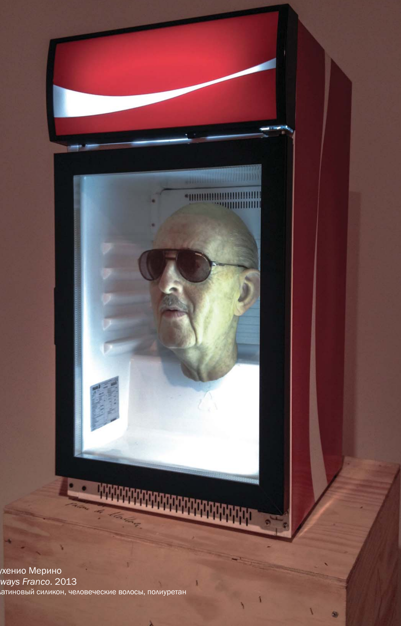
Эухенио Мерино Always Franco . 2013

Платиновый силикон, человеческие волосы, полиуретан