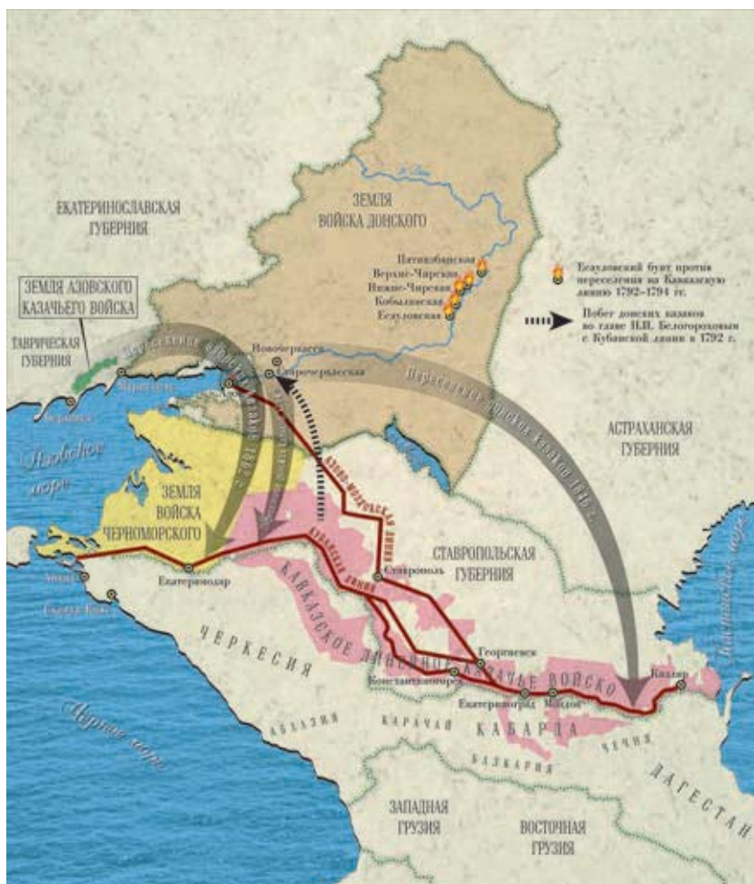
Казачьи войска Юга Российской империи (первая половина – середина XIX в.)