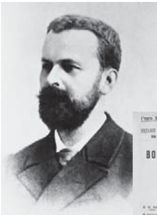
Е. Н. Трубецкой.