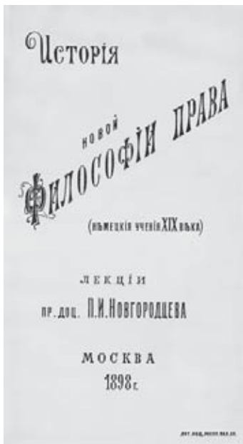
История новой философии права (немецкие учения XIX века). 1898 г.