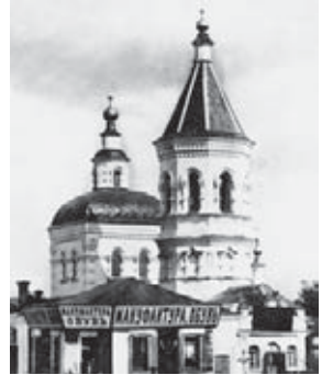
г. Бахмут, где родился П. И. Новгородцев (общий вид города и Свято-Троицкий собор)