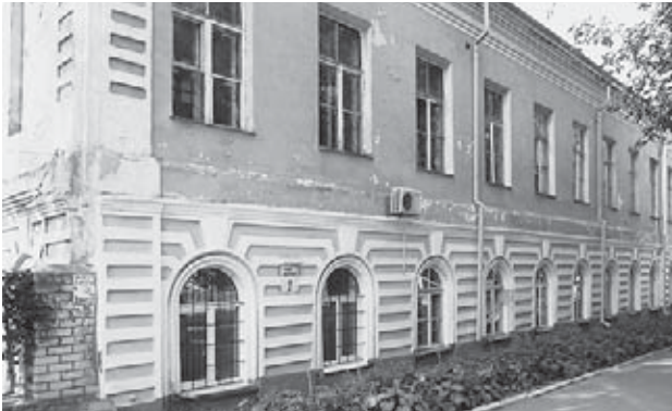
Екатеринославская гимназия.