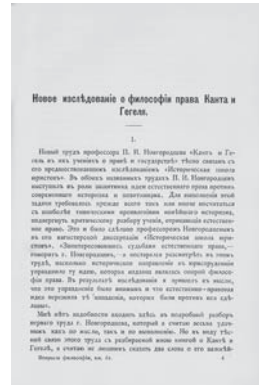
Трубецкой Е. Н. Новое исследование о философии права Канта и Гегеля. ВФип. 1902 г.