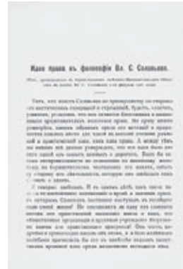
Портрет Вл. Соловьева, обложка и 1-я страница статьи П. И. Новгородцева «Идея права в философии Вл. С. Соловьева». Сб. статей, посвященных памяти Владимира Соловьева. ВФип. 1901 г.