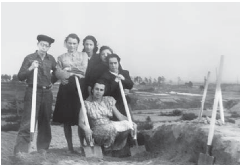
На раскопках курганов у села Зюзино. 1950 г.