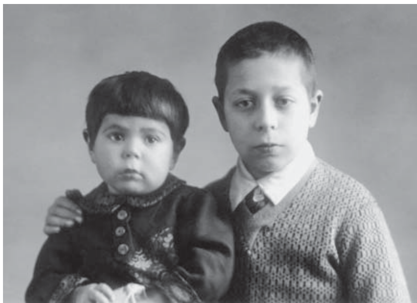
С сестрой Дусей. 1941 г.