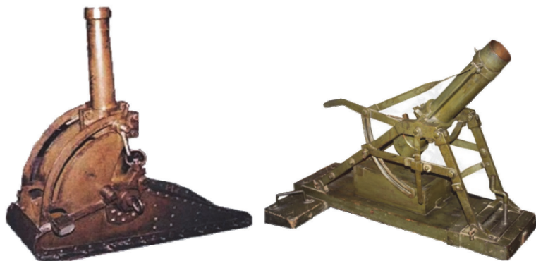
Рис. 1.4. Минометы: 89-мм миномет Ижорского завода; 90-мм миномет Г-Р (германо-русский) 1

Подразделения, вооруженные минометами, к 1917 году были сведены в Тяжелую артиллерию особого назначения. Перед октябрьской революцией было сформировано два минометных дивизиона, один запасный минометный артиллерийский дивизион и минометная артиллерийская школа.