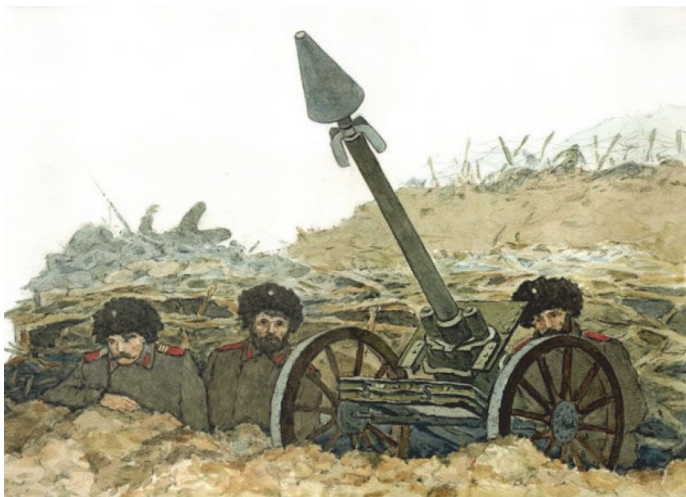
Рис. 1.2. Мина и миномет капитана Л.Н. Гобято, изготовленный на основе 47-мм морской пушки 1