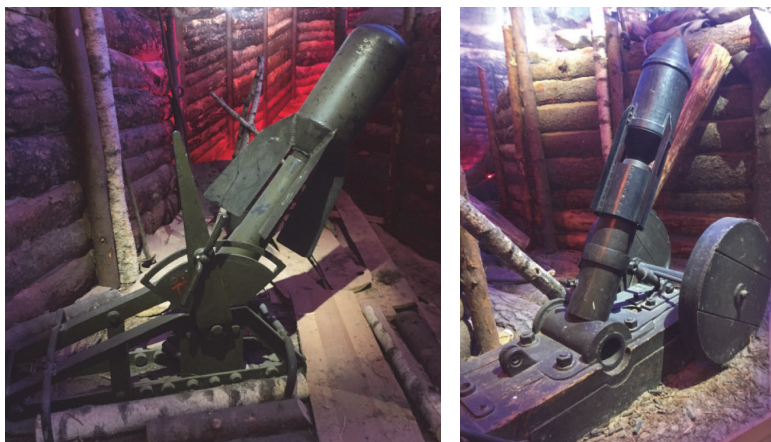
Рис. 1.3. Русские минометы капитана Лихонина начала XX века: 47-мм миномет и модернизированный 58-мм миномет ФР (Франция — Россия) с миной

С 1914 года были разработаны ряд отечественных образцов минометов, тогда они чаще назывались бомбометами. Кроме них использовались и иностранные образцы минометного вооружения. Их характеристики сведены в таблицу 1.1.