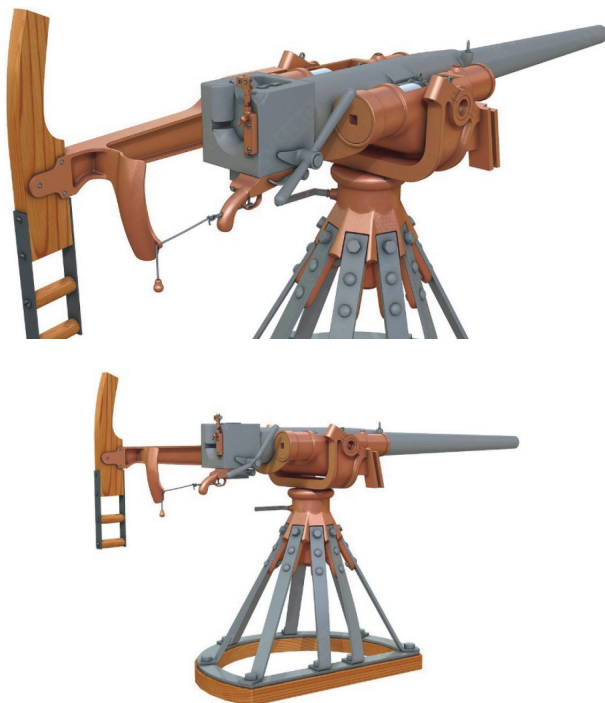
Рис. 1.1. 47-мм морская пушка Гочкиса обр. 1885 г. 1

Его конструкция была достаточно проста. У лёгкого 47-мм орудия урезали ствол и поставили его на колесный лафет (морское орудие изначально имело стационарный лафет-платформу) с таким расчетом, что стрелять из него стало возможно при больших углах возвышения. Мину изготовили из листового железа, залили взрывчатым веществом (пироксилин), к задней ее части приделали шест. На шест с зазором одели оперенное кольцо, которое выполняло роль стабилизатора. Орудие заряжалось с казенной